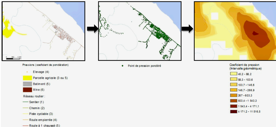
Figure 2 – Carte de densité