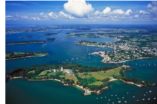
Golfe du Morbihan