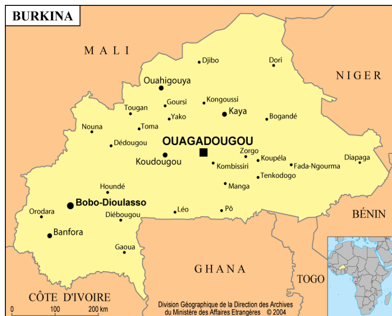
Carte 1. Carte du Burkina Faso