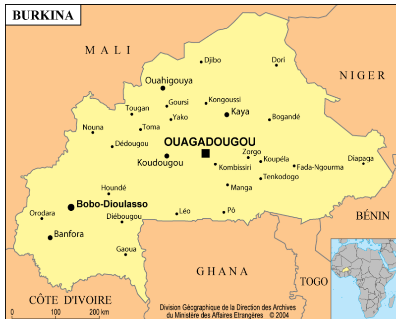
Carte 1. Carte du Burkina Faso