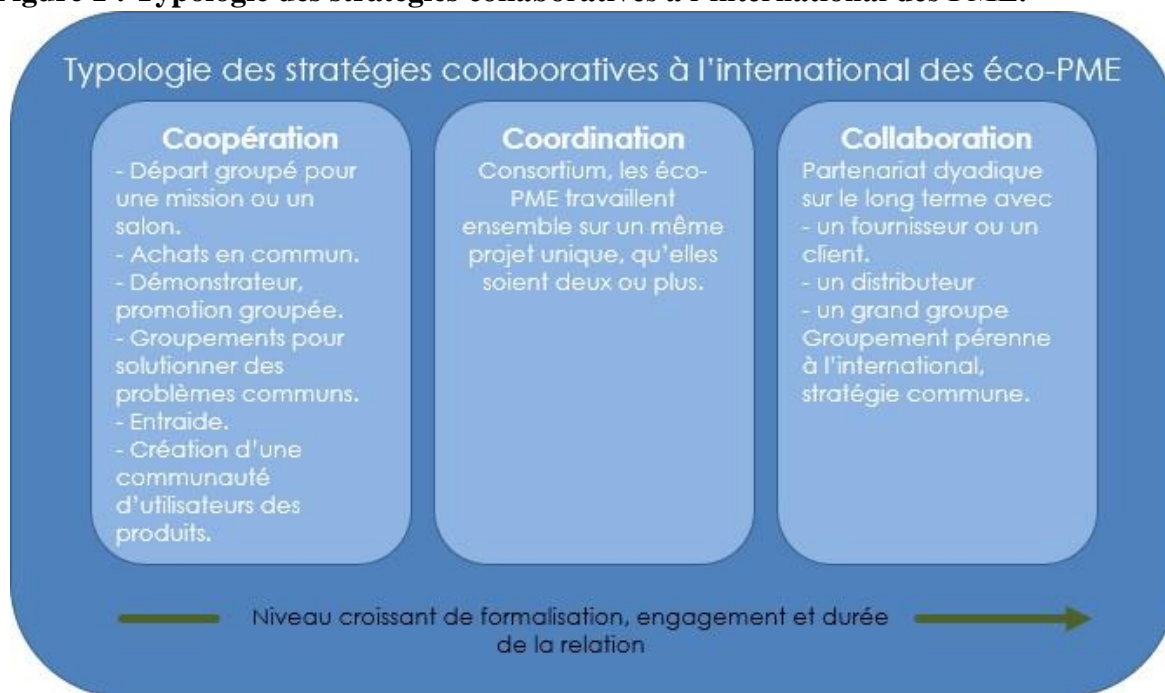
Figure 1 : Typologie des stratégies collaboratives à l'international des PME.

Et puis il y a le processus le plus abouti qui est un consortium permanent, où là c'est des règles de gouvernance, où en fait c'est une vraie stratégie commune de déploiement à l'international. [...] Si le consortium pérenne tourne bien sur un pays en particulier, ça fait une joint-venture après. » (Interprofession)