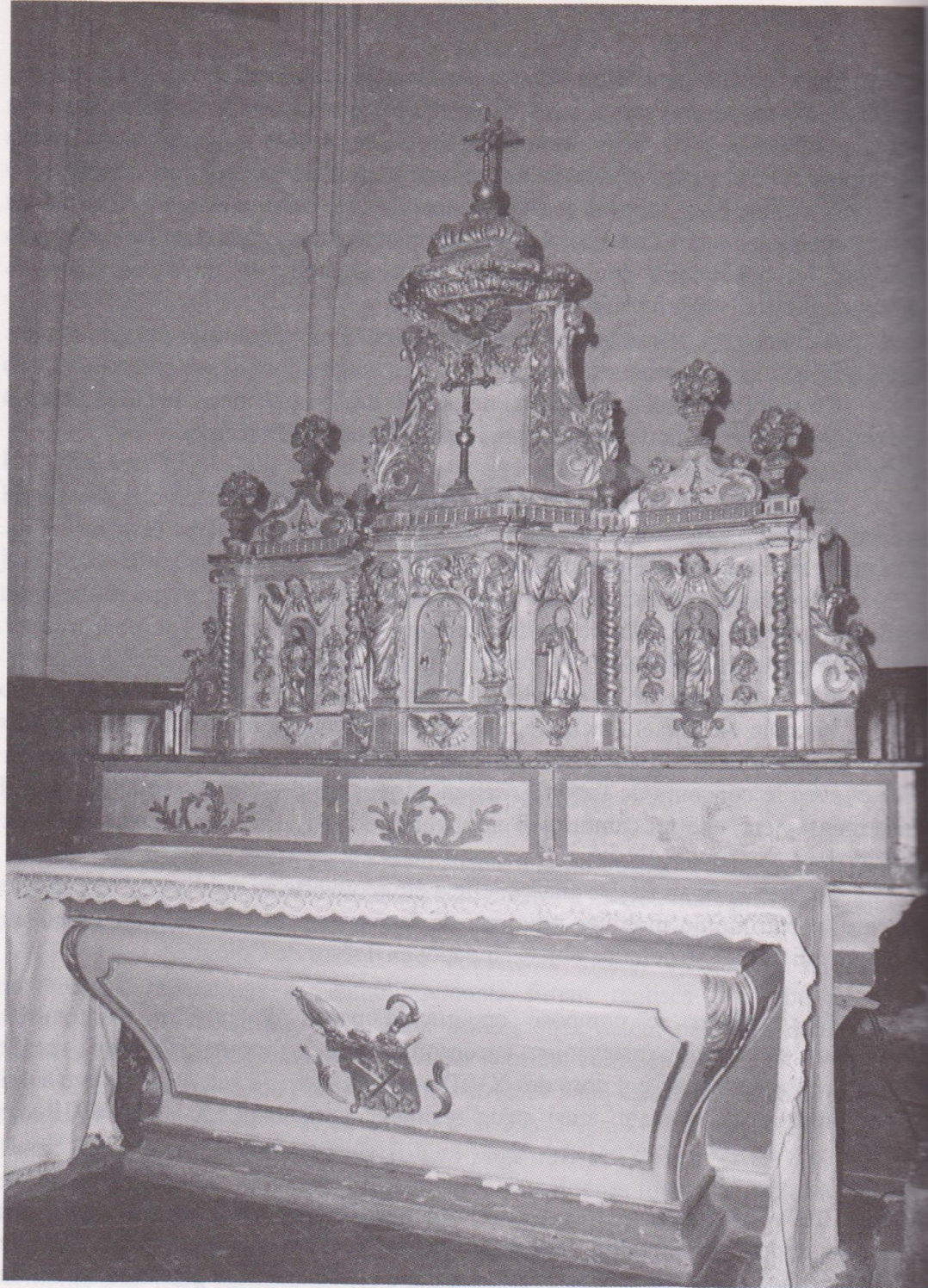
Tabernacle de l'église de Touget.