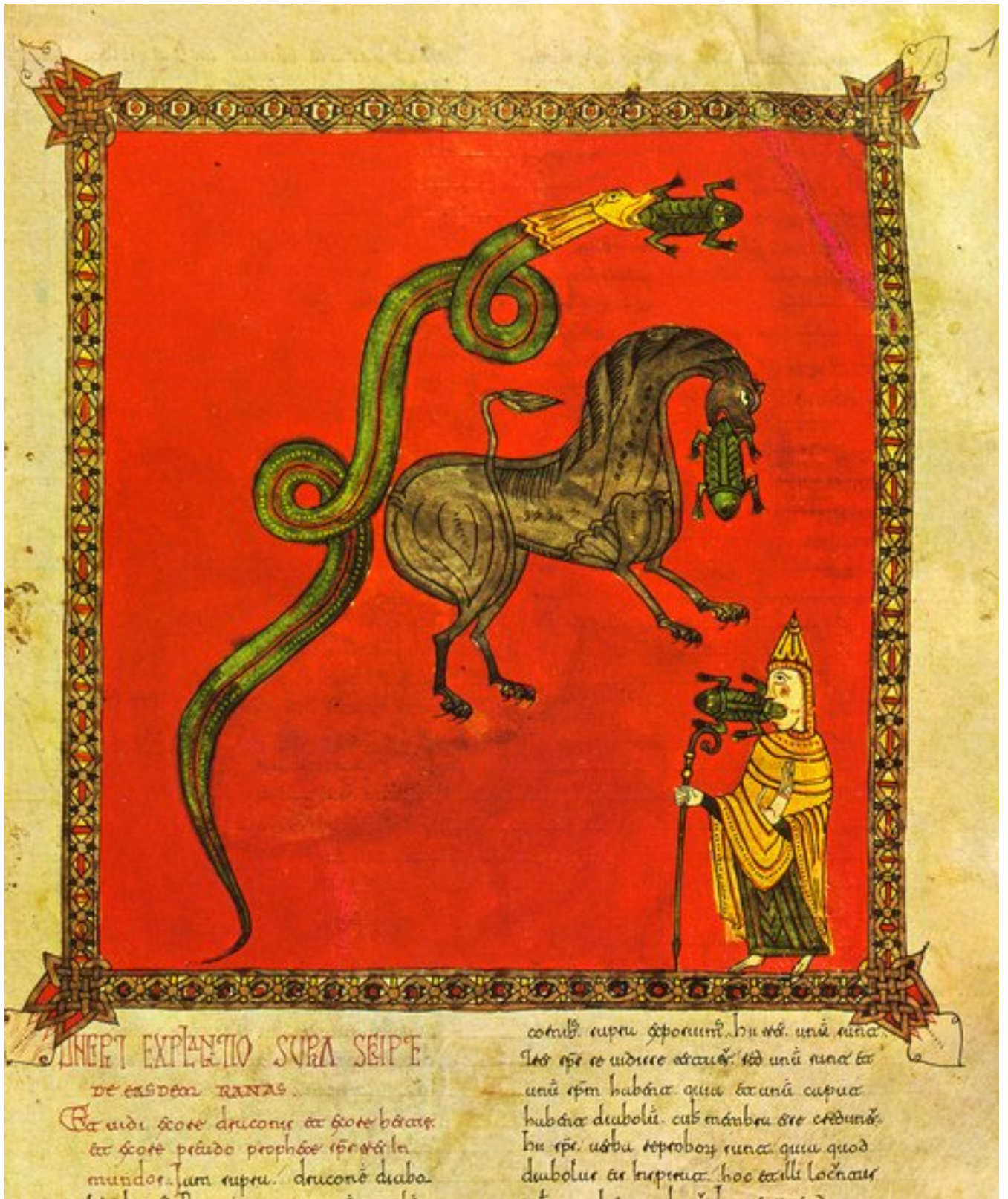
Fig. 5 : El Burgo de Osma, trésor de la cathédrale, Beatus de Osma, f° 139.