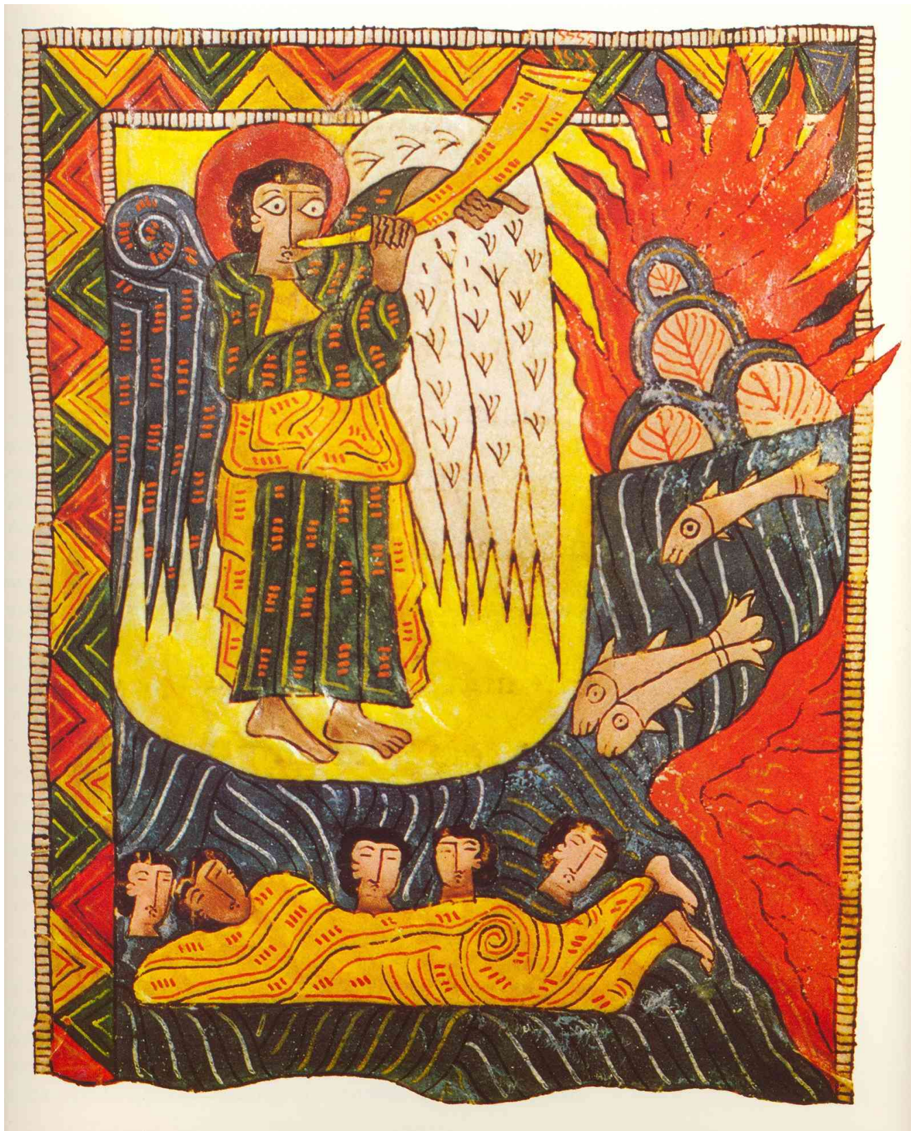
Fig. 2 : Madrid, Bibliothèque de l'Escorial, Beatus de San Millan, f° 93v.