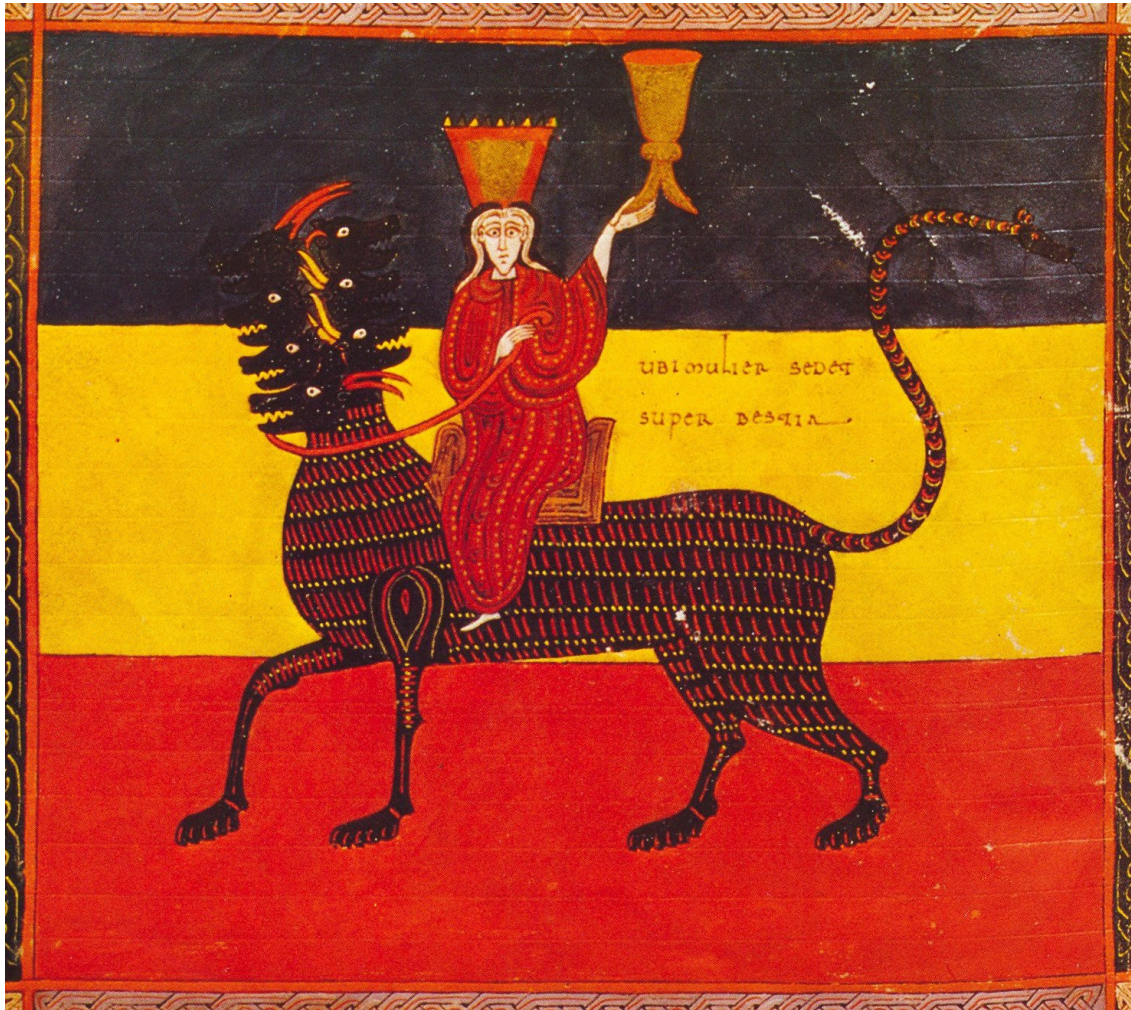
Fig. 3 : Madrid, Bibliothèque Nationale, Beatus de Facundus, f° 225v.