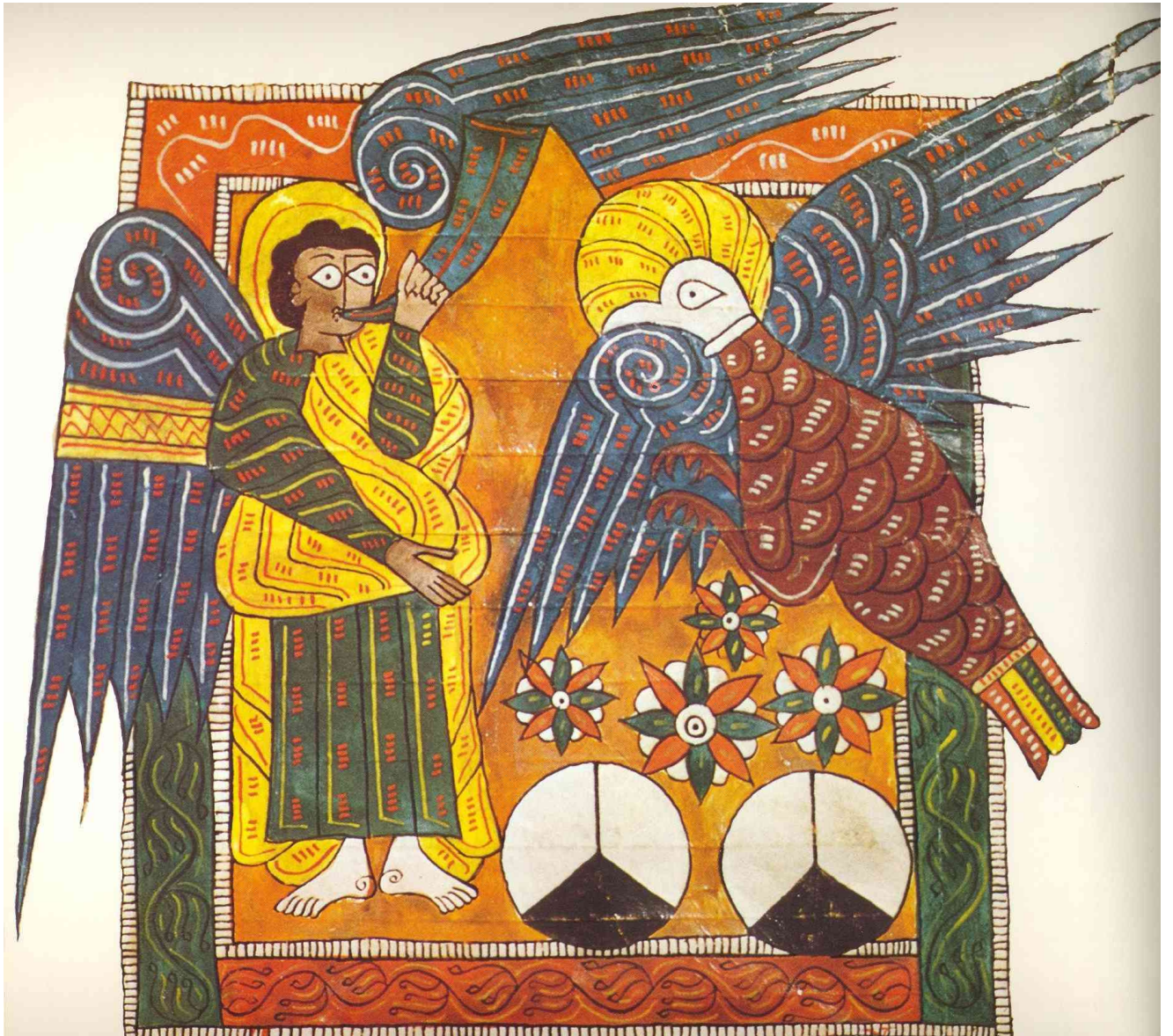
Fig. 1 : Madrid, Bibliothèque de l'Escurial, Beatus de San Millan, f° 94v.