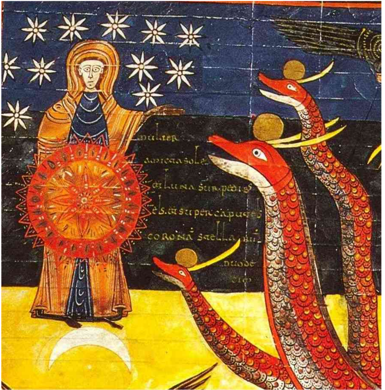
Fig. 4 : Madrid, Bibliothèque Nationale, Beatus de Facundus, f° 186v.