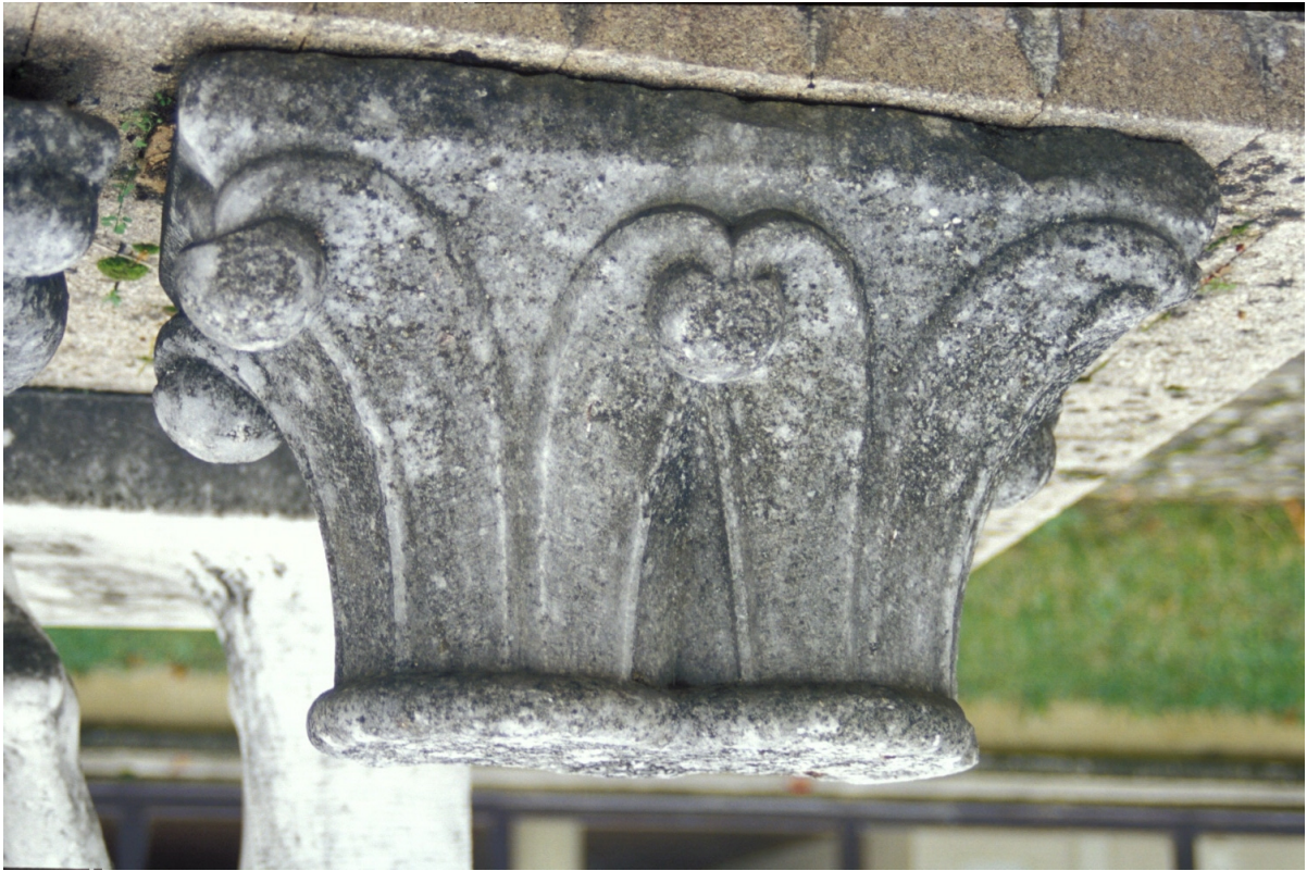
Fig. 21 : Mirande, musée des Beaux-Arts, un des chapiteaux romans.