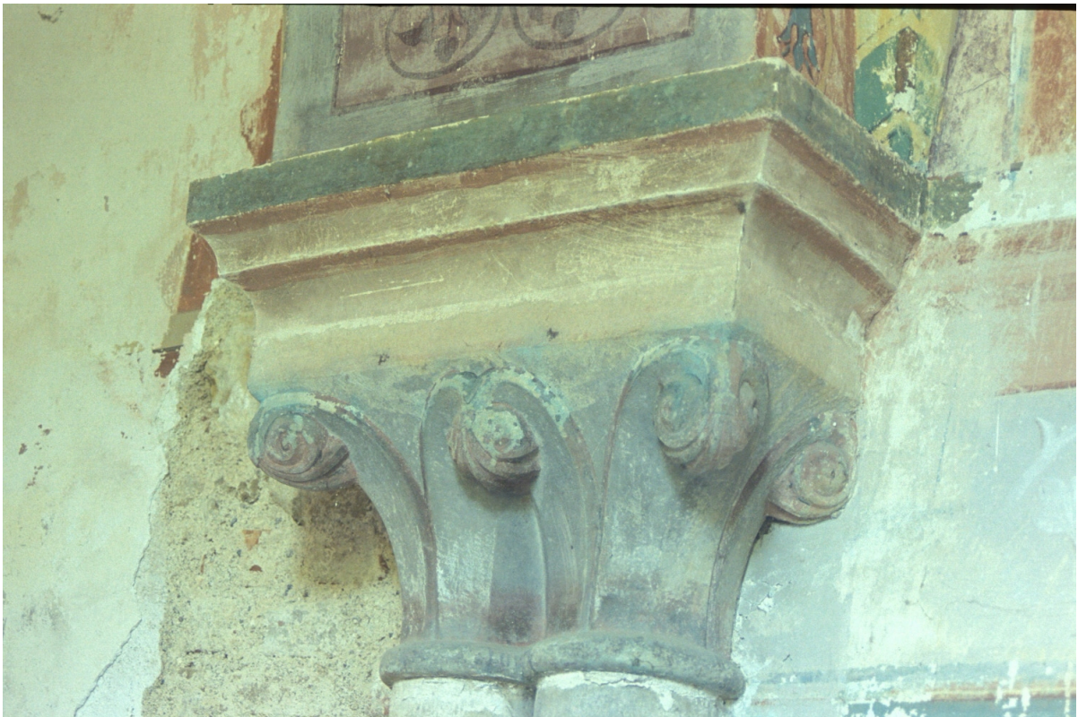
Fig. 24 : Berdoues, ancienne chapelle, le chapiteau du support 1N.