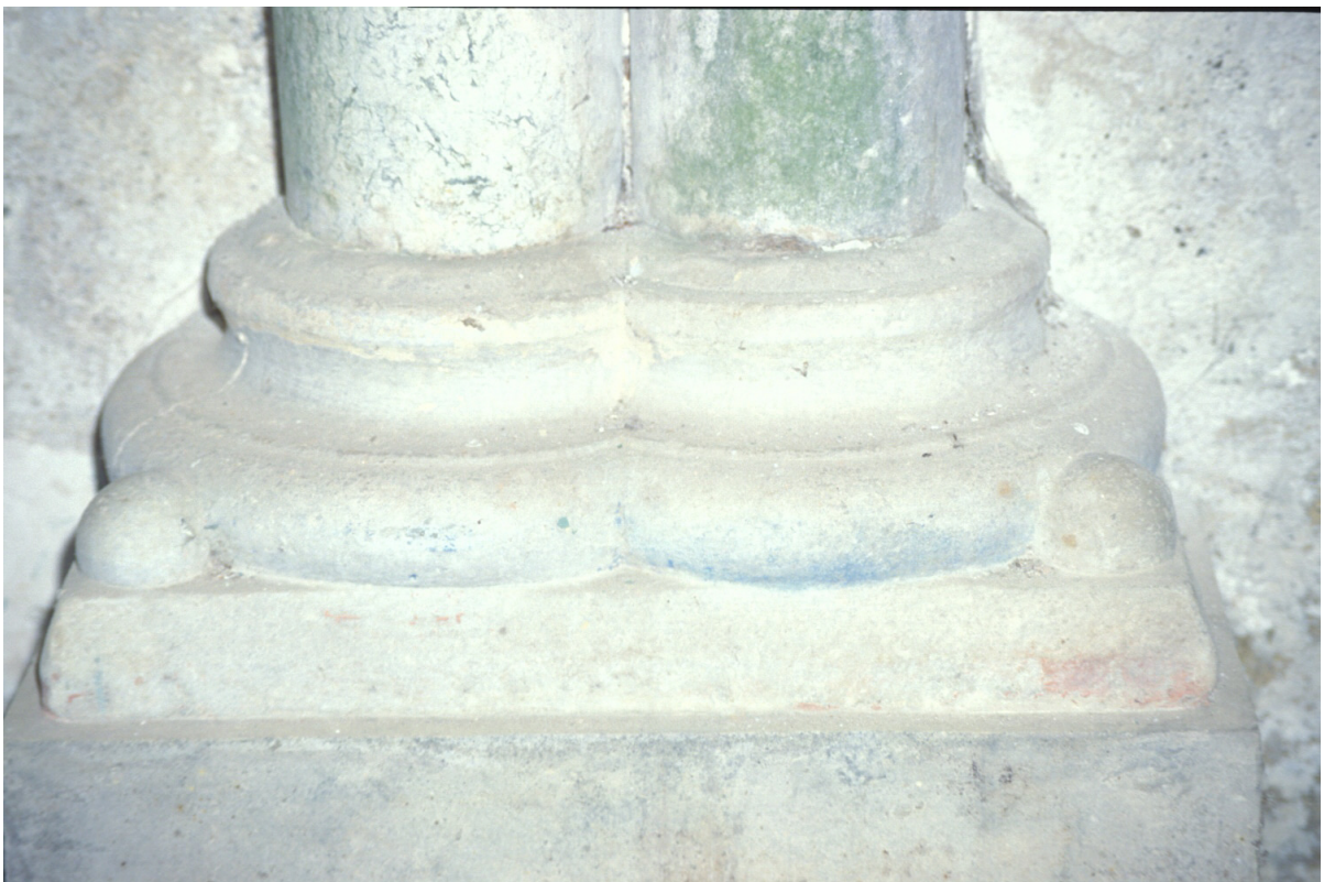
Fig. 8 : Berdoues, ancienne chapelle, la base du support 1S.