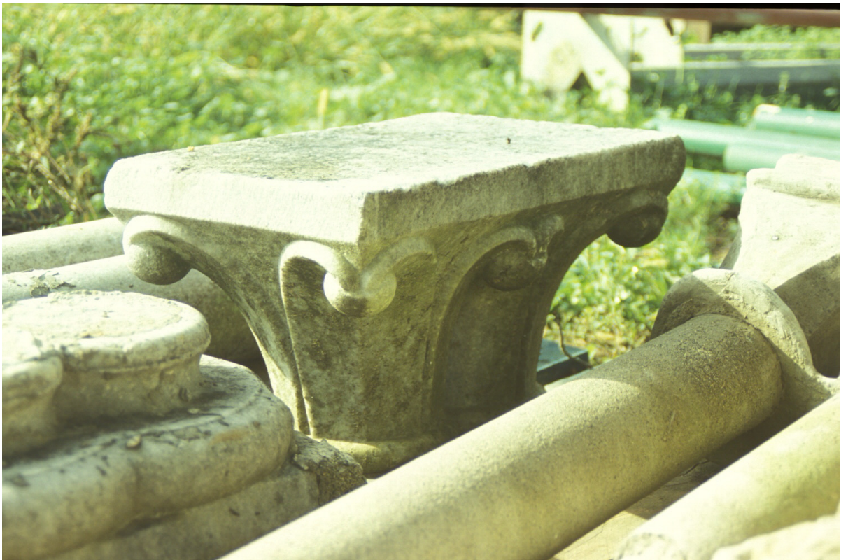
Fig. 22 : Marciac, vestiges d'une arcature démontée, le chapiteau double.