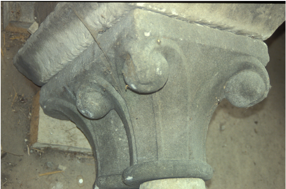
Fig. 20 : Le chapiteau n° 12.