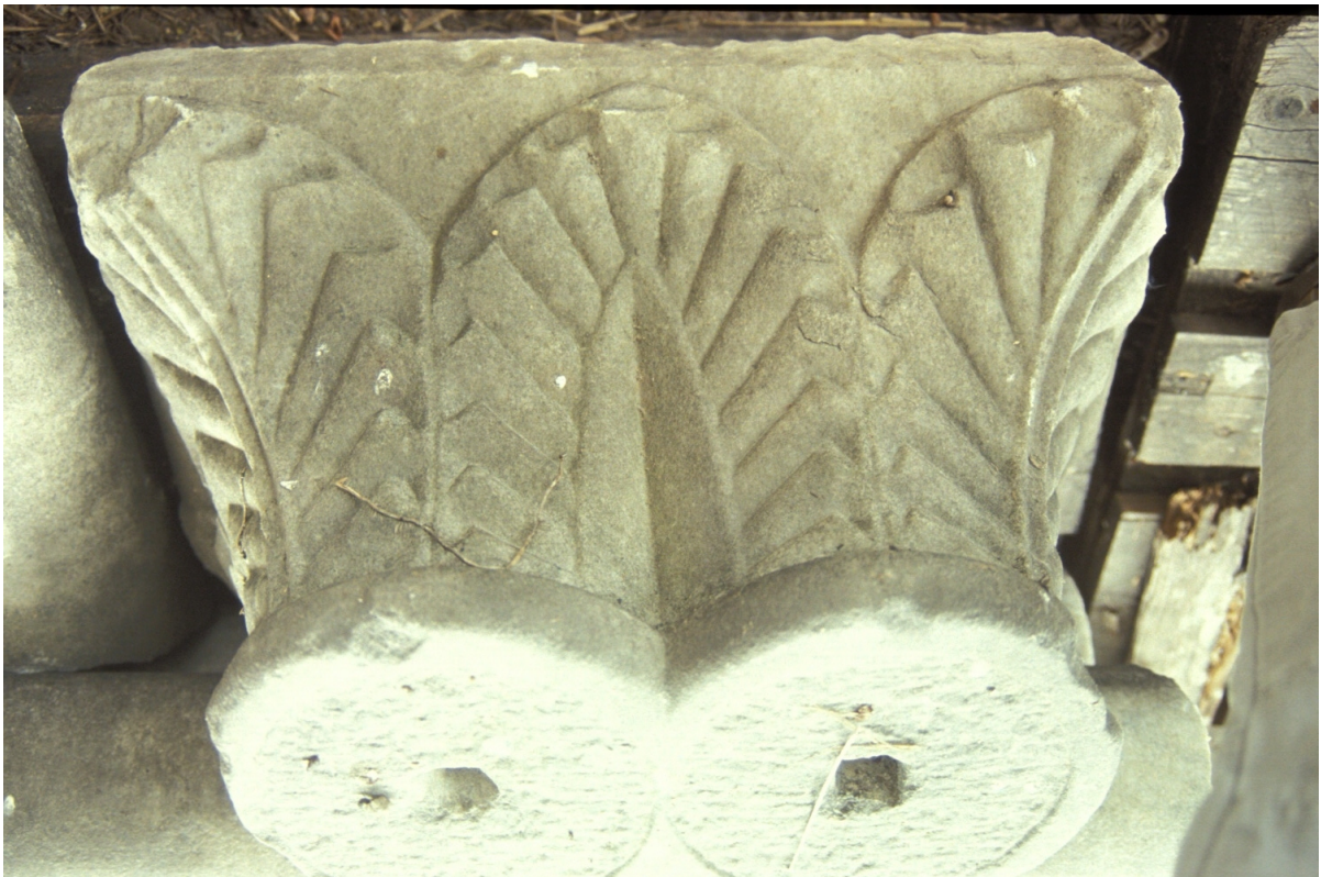
Fig. 16 : Le chapiteau n° 6.