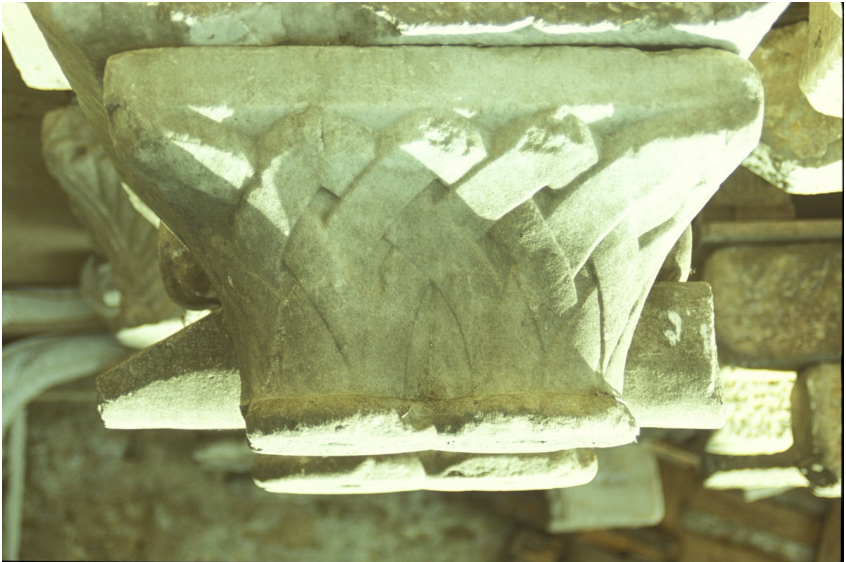
Fig. 13 : Le chapiteau n° 1.