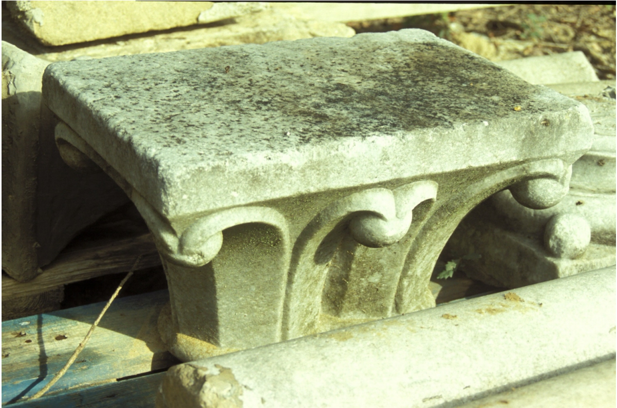
Fig. 12 : Marciac, vestiges d'une arcature démontée, le chapiteau double.