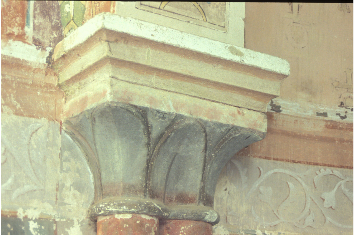
Fig. 19 : Berdoues, ancienne chapelle, le chapiteau du support 2N.