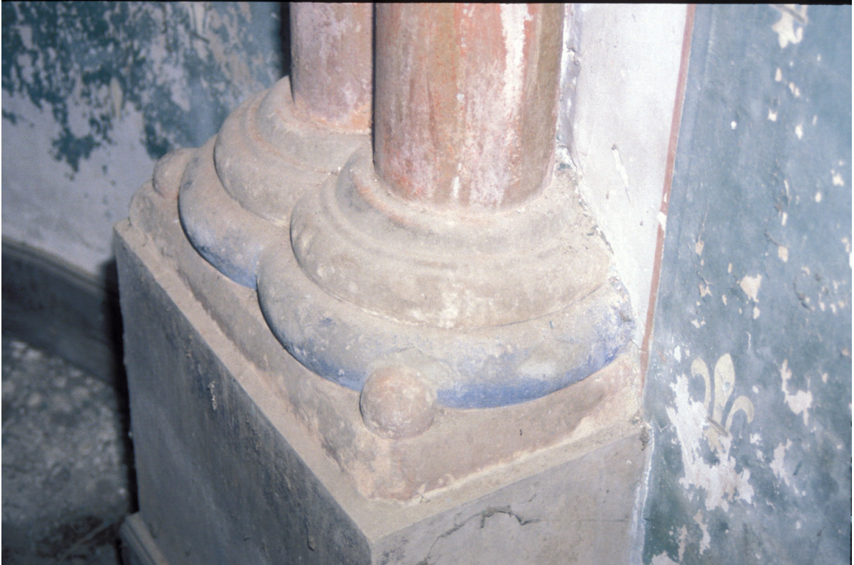
Fig. 9 : Berdoues, ancienne chapelle, la base du support 2S.