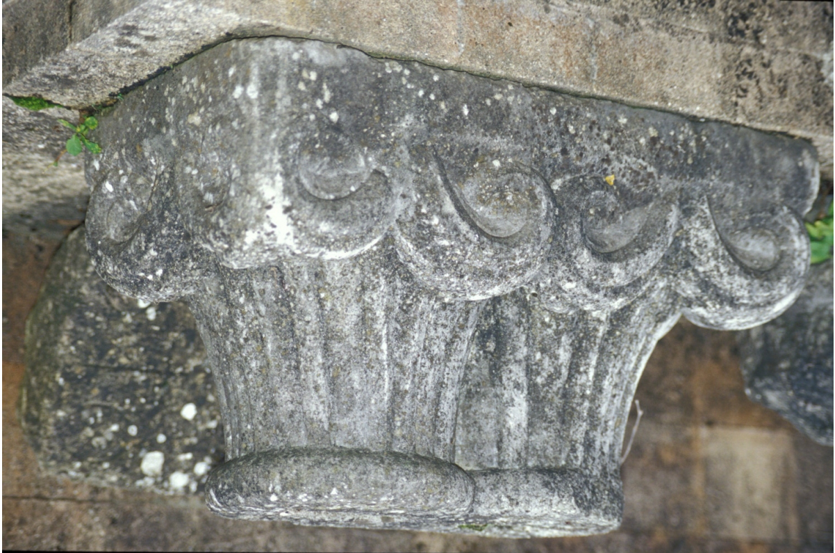
Fig. 15 : Mirande, musée des Beaux-Arts, un des chapiteaux romans.