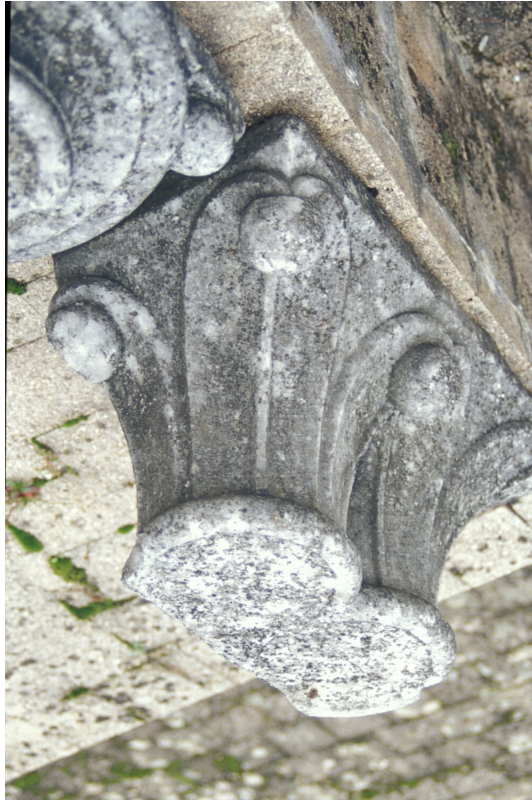
Fig. 11 : Mirande, musée des Beaux-Arts, un des chapiteaux romans.