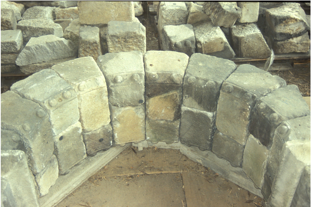
Fig. 1 : Détail de l'arcade remontée.