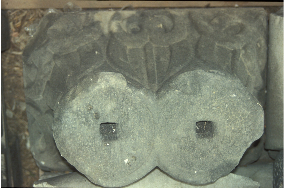
Fig. 25 : Le chapiteau n° 16.