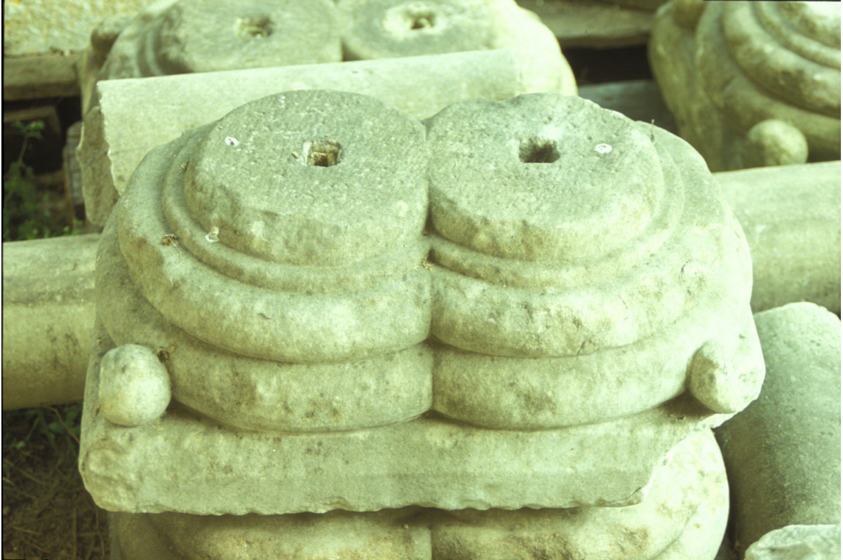
Fig. 5 : Une base double pour colonnes libres.