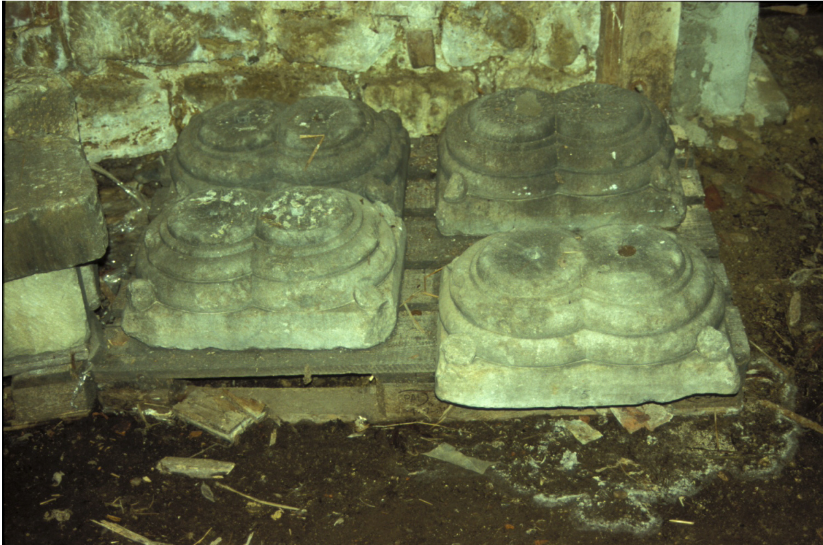
Fig. 4 : Quelques-unes des bases doubles.