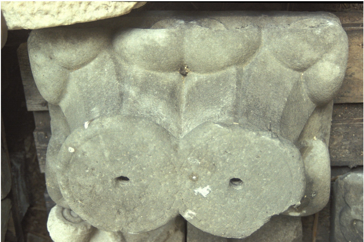
Fig. 14 : Le chapiteau n° 4.