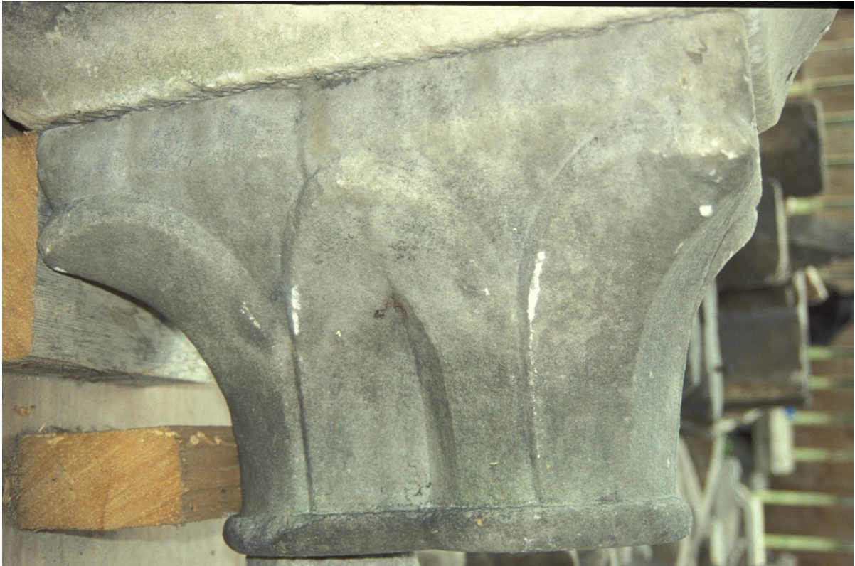
Fig. 17 : Le chapiteau n° 7.