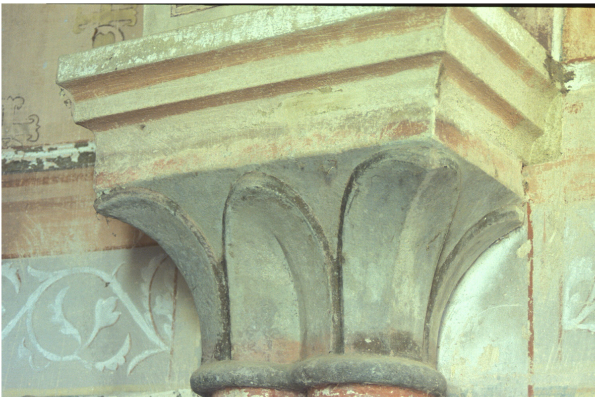
Fig. 18 : Berdoues, ancienne chapelle, le chapiteau du support 2S.