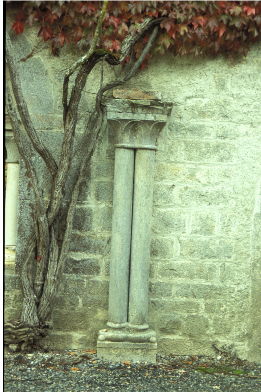
Fig. 3 : L'Escaladieu, ancienne abbaye cistercienne, détail de l'élévation intérieure supposée du cloître.