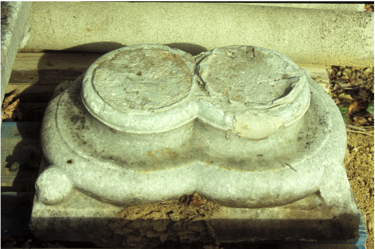
Fig. 6 : Marciac, vestiges d'une arcature démontée, la base double.