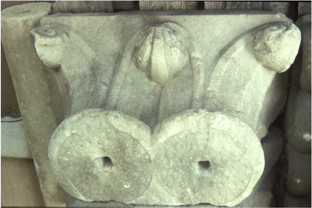
Fig. 23 : Le chapiteau n° 13.