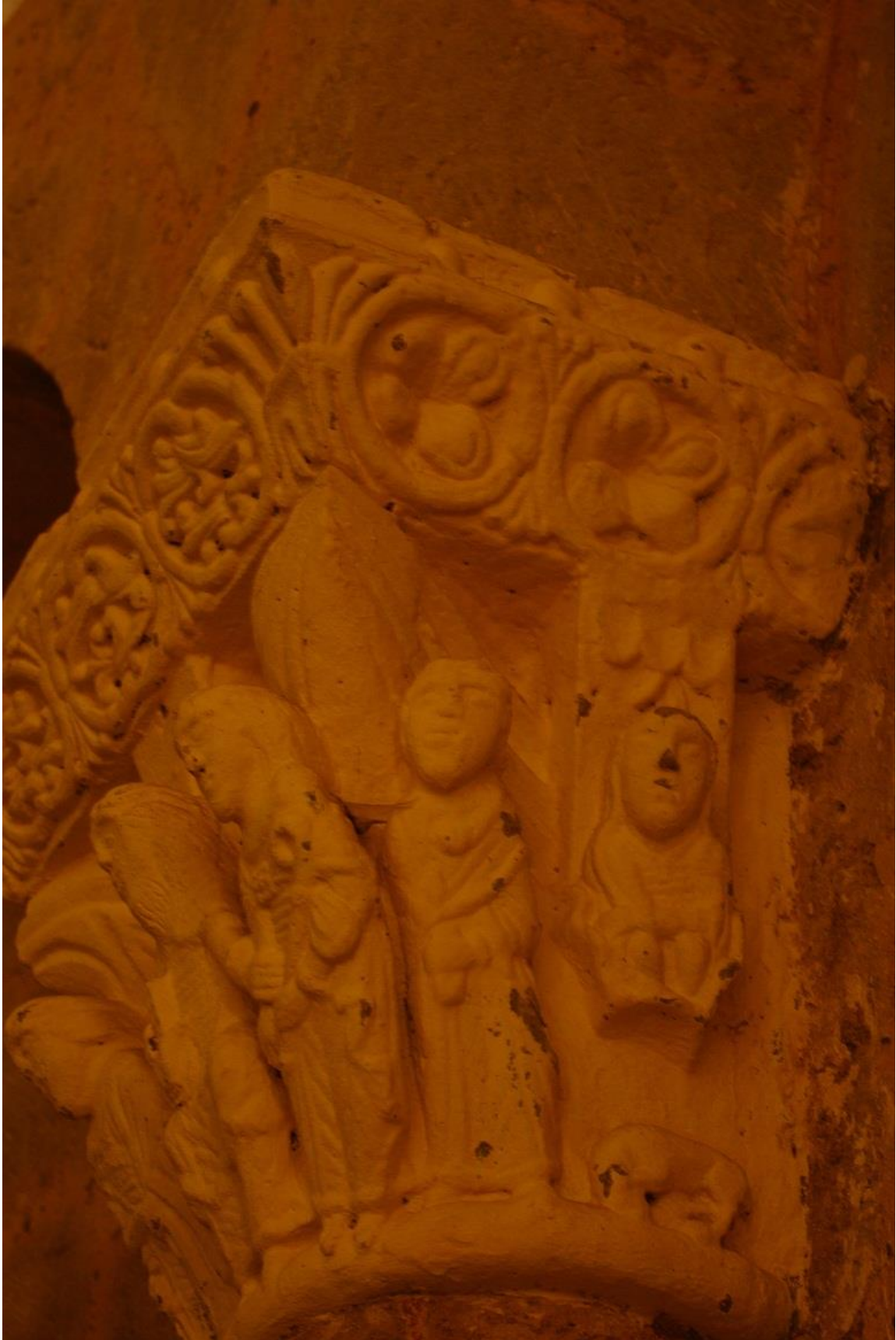
Fig. 8 : AIGNAN, église Saint-Laurent, chapiteau n° 9, détail.