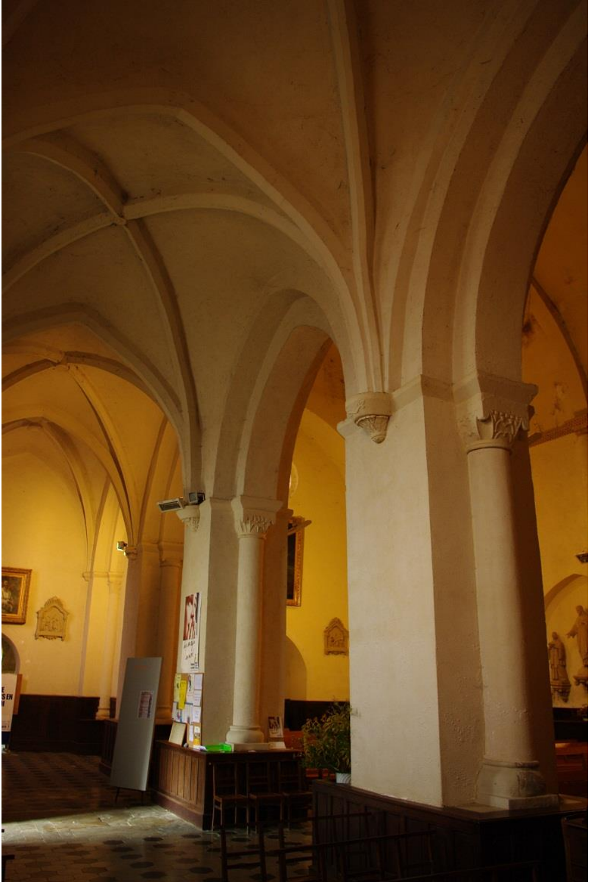
Fig. 10 : AIGNAN, église Saint-Laurent, vue intérieure.