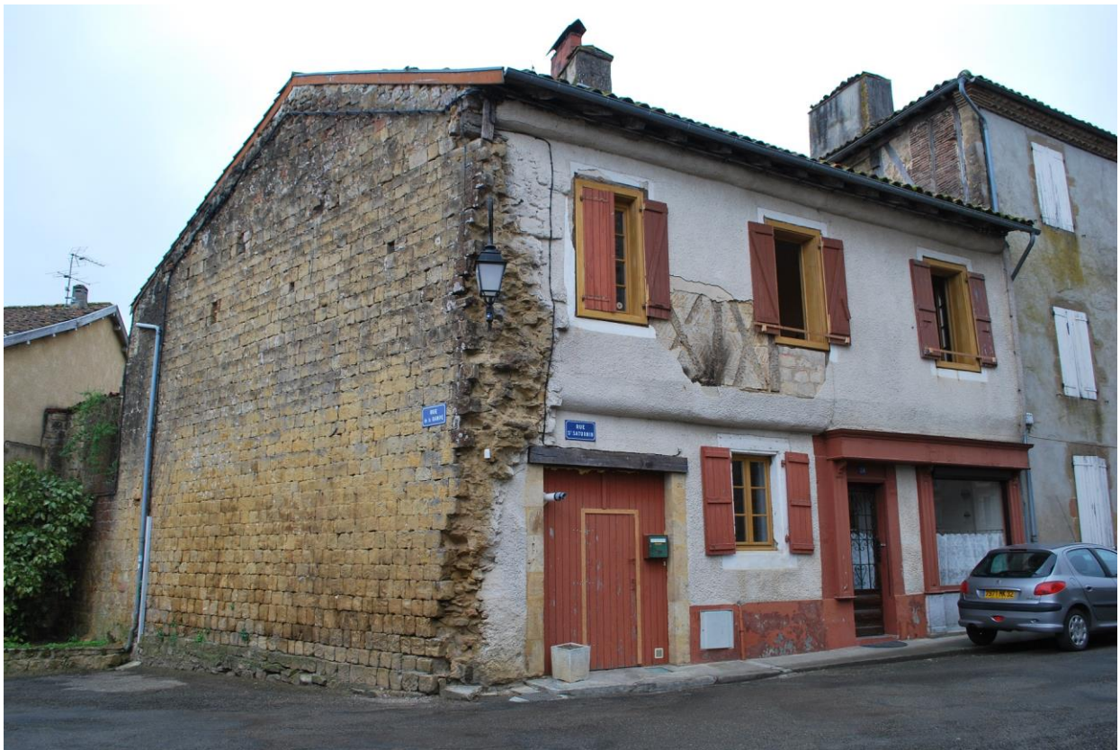
Fig. 2 : AIGNAN, vestiges d'un mur du XIV e siècle au n° 24 de la rue Saint-Saturnin.