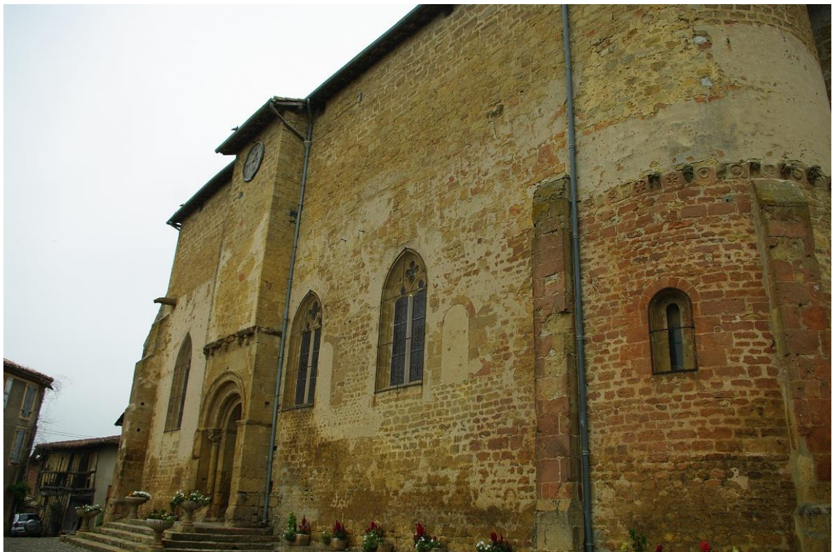
Fig. 4 : AIGNAN, église Saint-Laurent, vue de l'église depuis l'angle sud-est. .