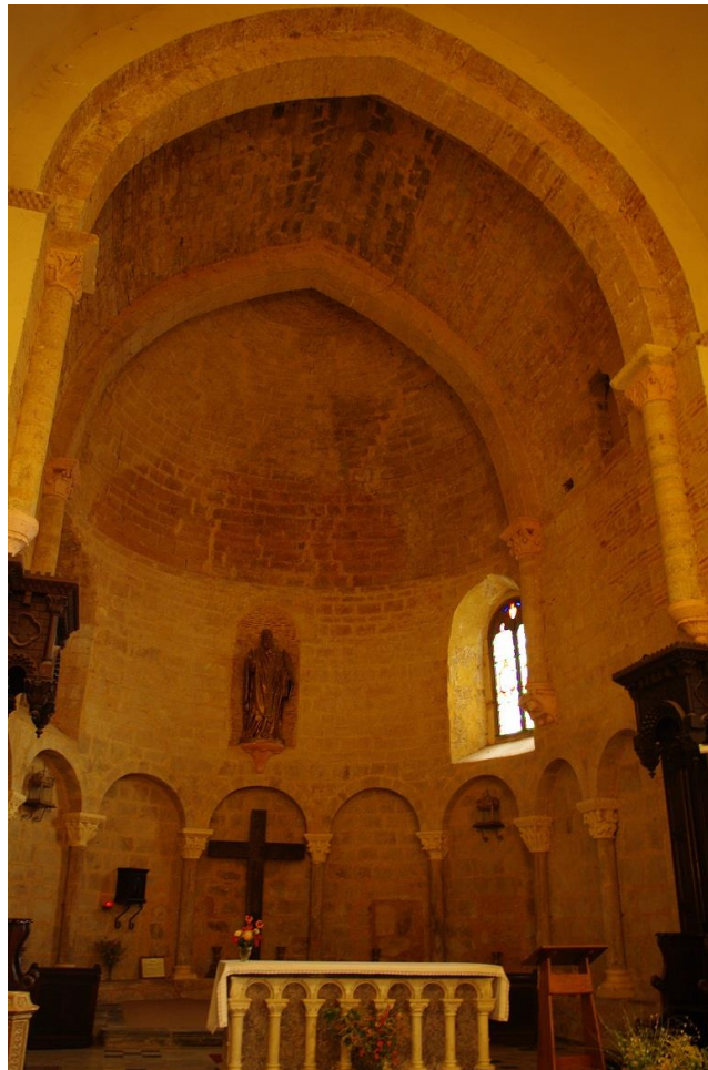
Fig. 6 : AIGNAN, église Saint-Laurent, vue intérieure de l'abside d'axe.