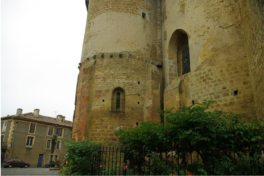
Fig. 5 : AIGNAN, église Saint-Laurent, détail du chevet.