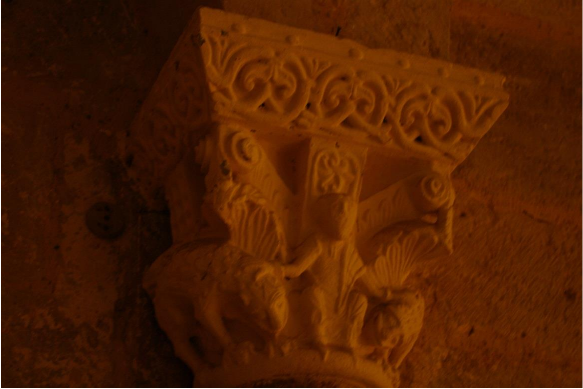
Fig. 7 : AIGNAN, église Saint-Laurent, chapiteau n° 10.