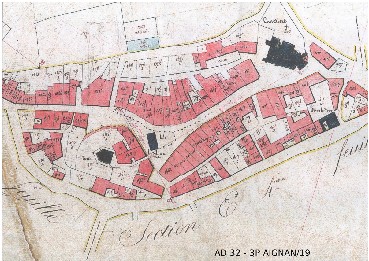
Fig. 1 : A.D.GERS, plan d'Aignan, cote 3P Aignan/19, début du XIX e siècle ?