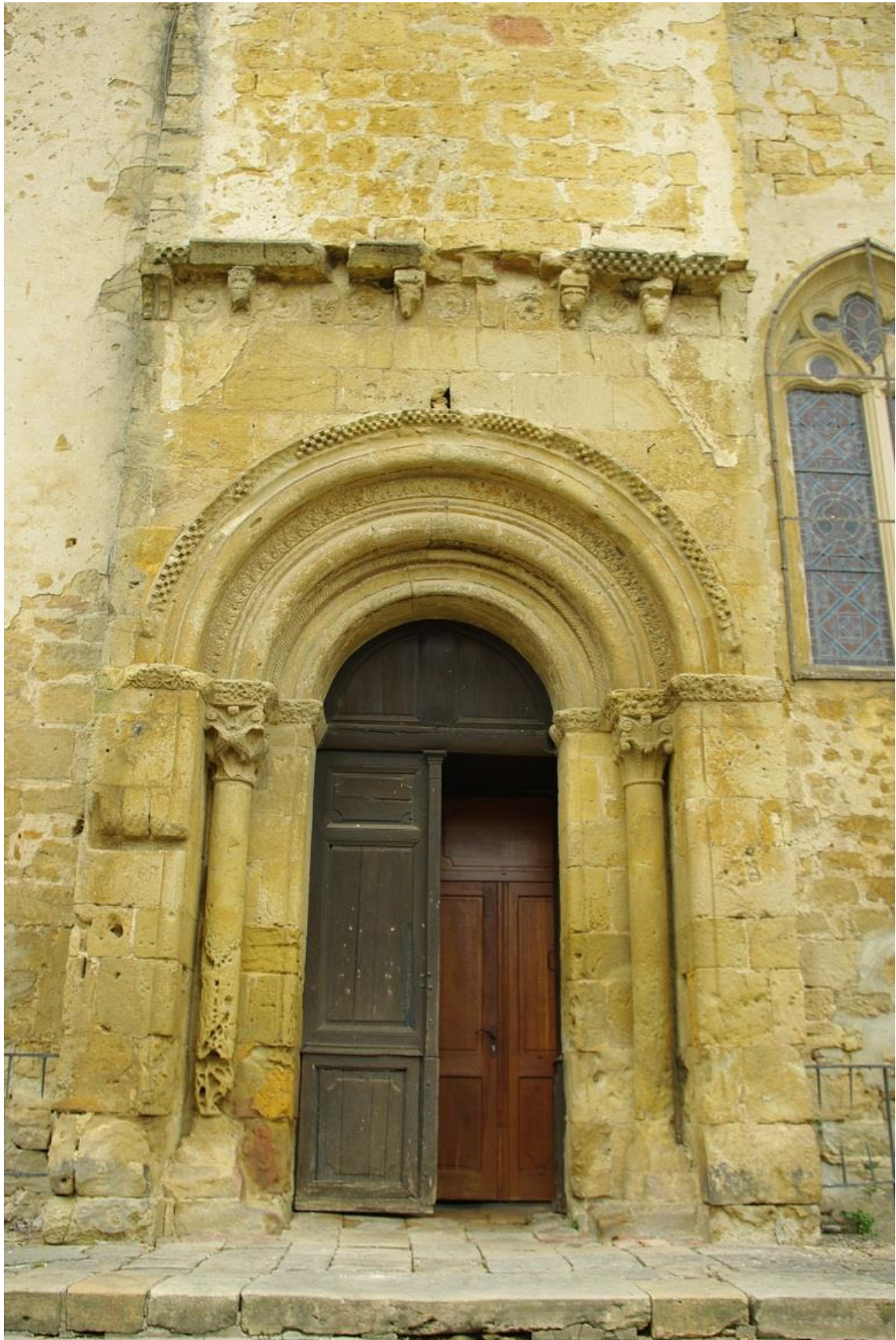
Fig. 9 : AIGNAN, église Saint-Laurent, le portail sud.