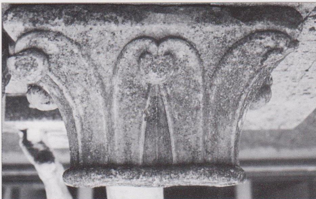
FIG. 3. MIRANDE, MUSÉE DES BEAUX-ARTS, chapiteau roman. Coll. Musée des Beaux-Arts de Mirande. Cliché C. Balagna.