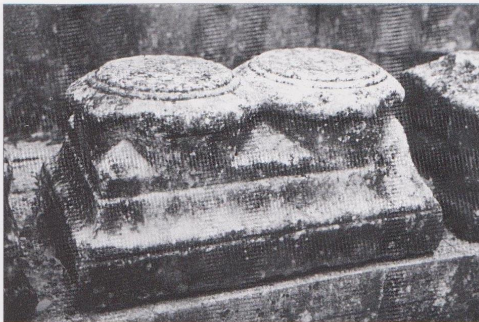
FIG. 4. MIRANDE, MUSÉE DES DEAUX-ARTS, une des bases gothiques. Coll. Musée des Beaux-Arts de Mirande.