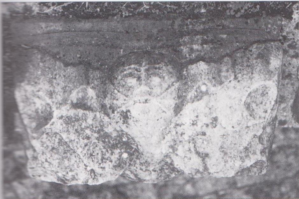
FIG. 8. MIRANDE, MUSÉE DES BEAUX-ARTS, détail de l'un des chapiteaux. Coll. Musée des Beaux-Arts de Mirande. Cliché C. Balagna.