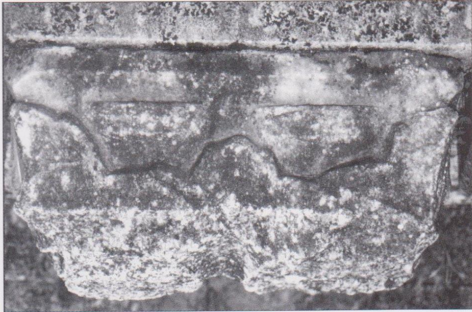
FIG. 6. MIRANDE, MUSÉE DES BEAUX-ARTS, un des chapiteaux gothiques. Coll. Musée des Beaux-Arts de Mirande. Cliché C. Balagna.