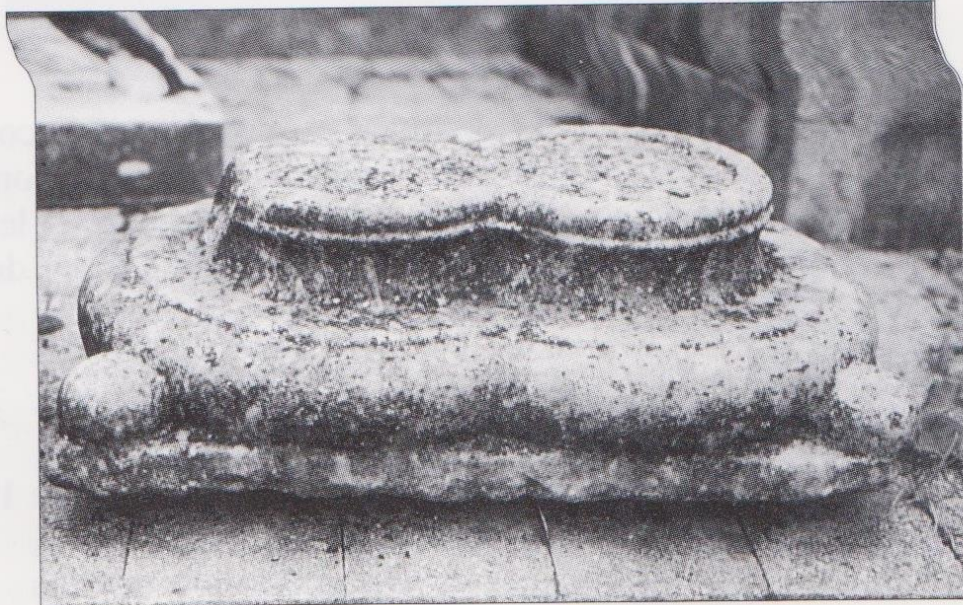
FIG. 2. MIRANDE, MUSÉE DES BEAUX-ARTS, la base romane. Coll. Musée des Beaux-Arts de Mirande.