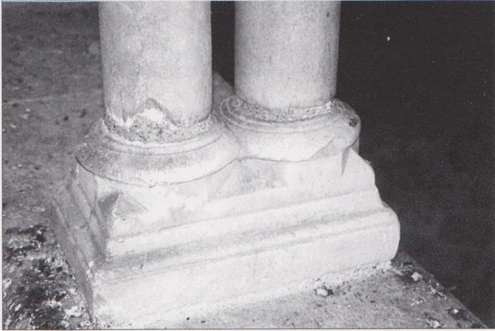
FIG. 5. AUCH, ANCIEN COUVEN DES CORDELIERS, GALERIE MÉRIDIONALE DU CLOÎTRE, détail d'une base.