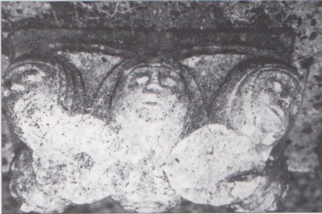
FIG. 9. MIRANDE, MUSÉE DES BEAUX-ARTS, détail de l'un des chapiteaux. Coll. Musée des Beaux-Arts de Mirande. Cliché C. Balagna.