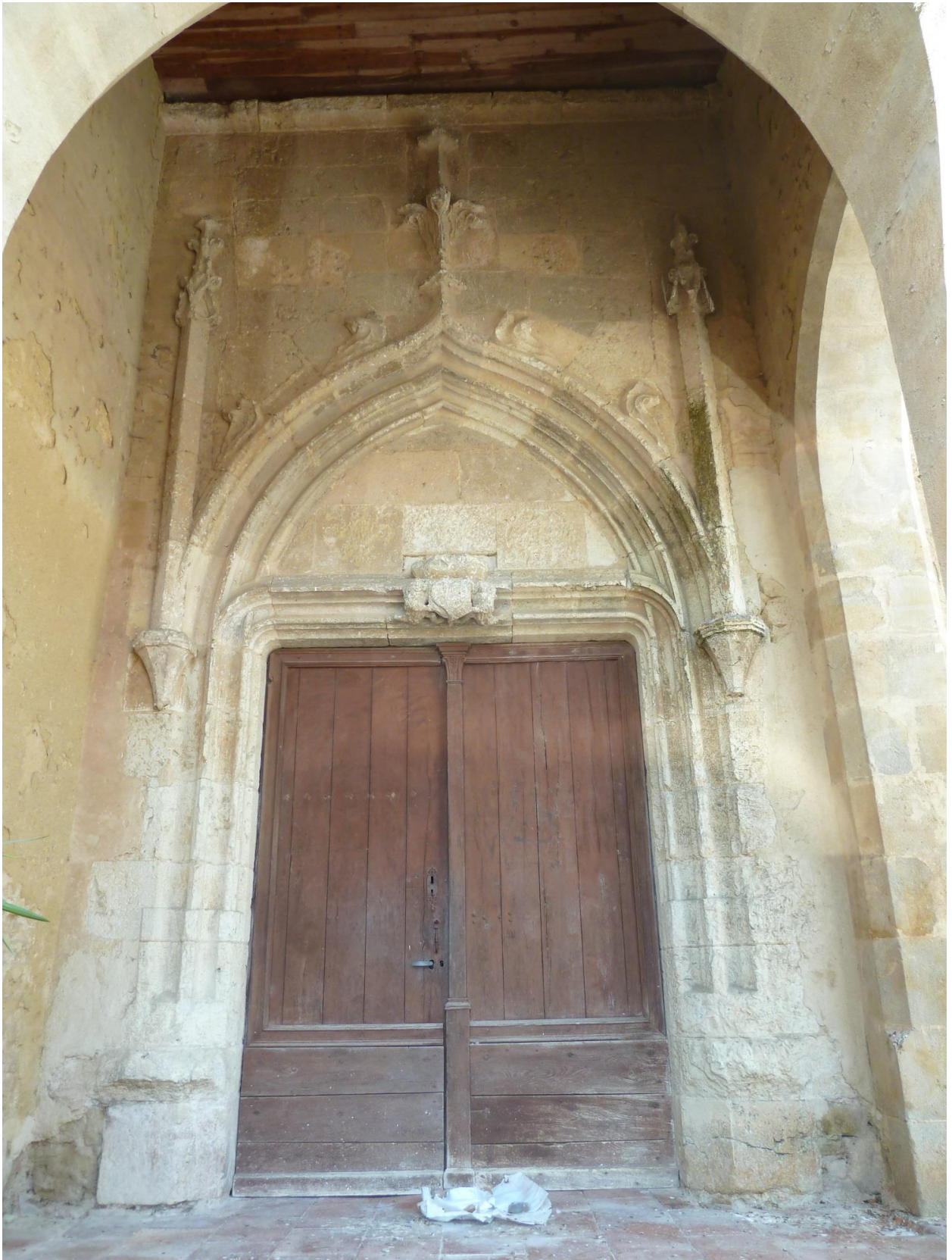
Fig. 4 : Saramon, église paroissiale, le portail de la fin du Moyen Âge.