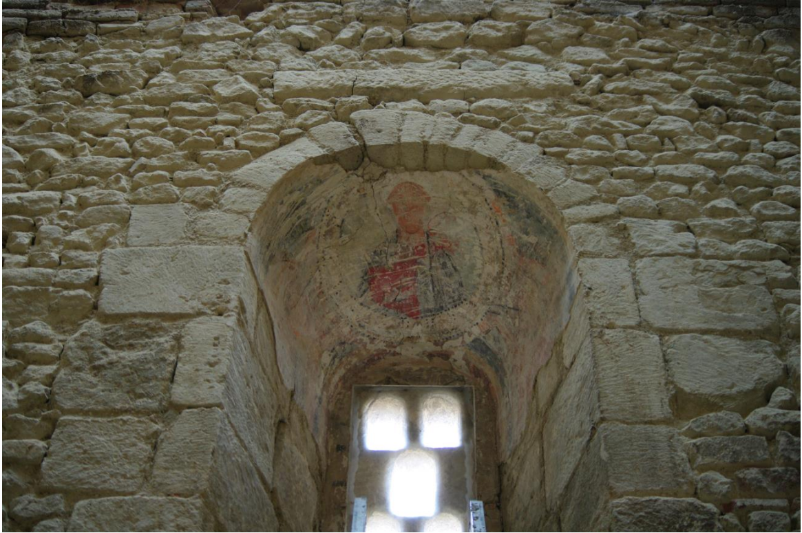
Fig. 44 : Saramon, église paroissiale, décor peint de l'intérieur de la fenêtre orientale, en mars 2016.