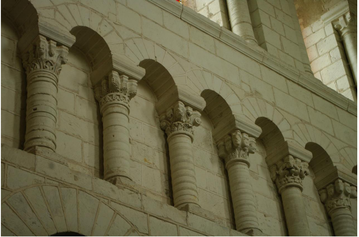
Fig. 63 : Saint-Genou, ancienne abbatale, détail de l'arcature aveugle du chœur liturgique, côté nord.