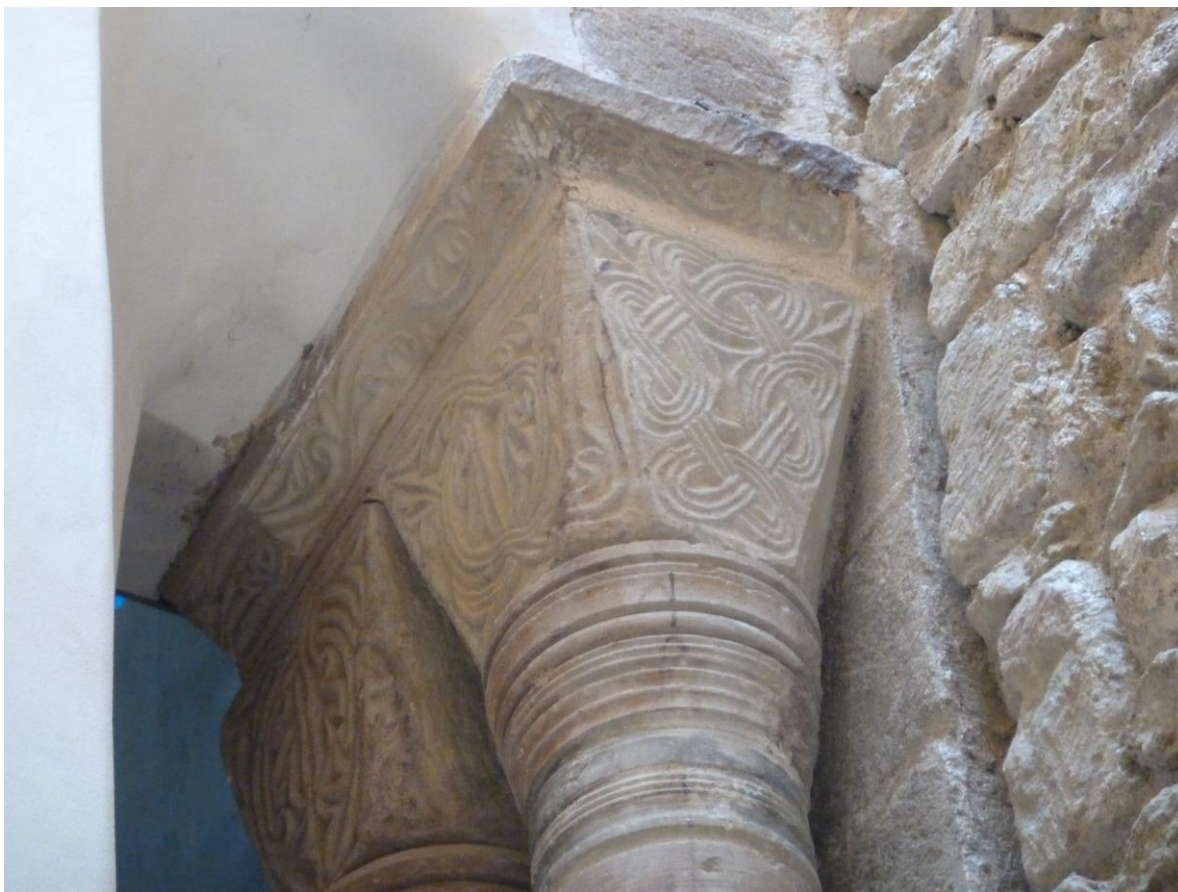
Fig. 51 : Saramon, église paroissiale, tour Saint-Victor, les chapiteaux nord.