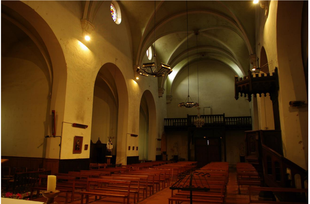
Fig. 2 : Saramon, église paroissiale, vue intérieure de la nef vers l'ouest.