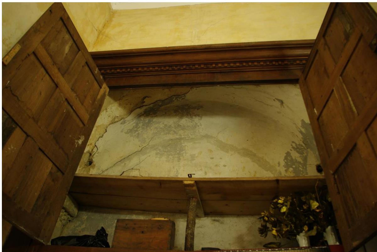
Fig. 9 : Saramon, église paroissiale, la sacristie sud, les vestiges de l'arc triomphal.