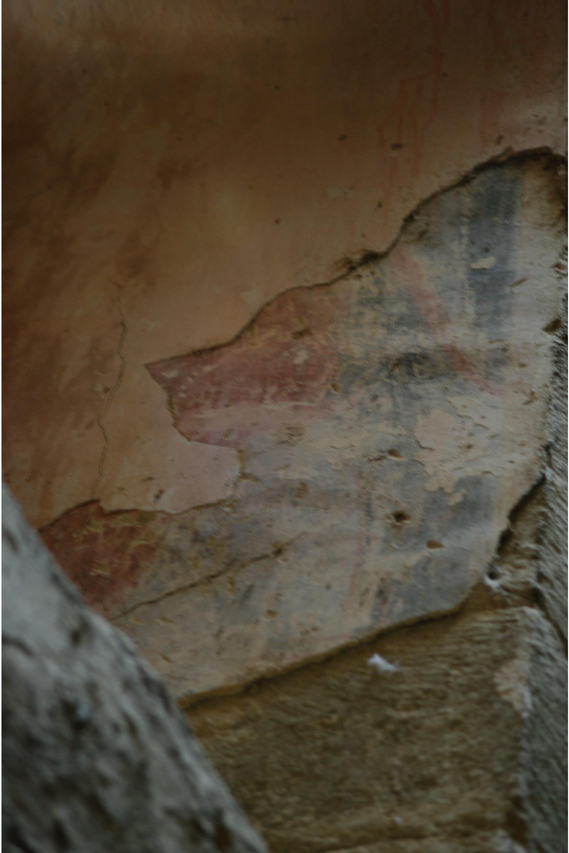
Fig. 38 : Saramon, église paroissiale, la tour Saint-Victor, détail de l'intérieur de la fenêtre orientale en octobre 2014.