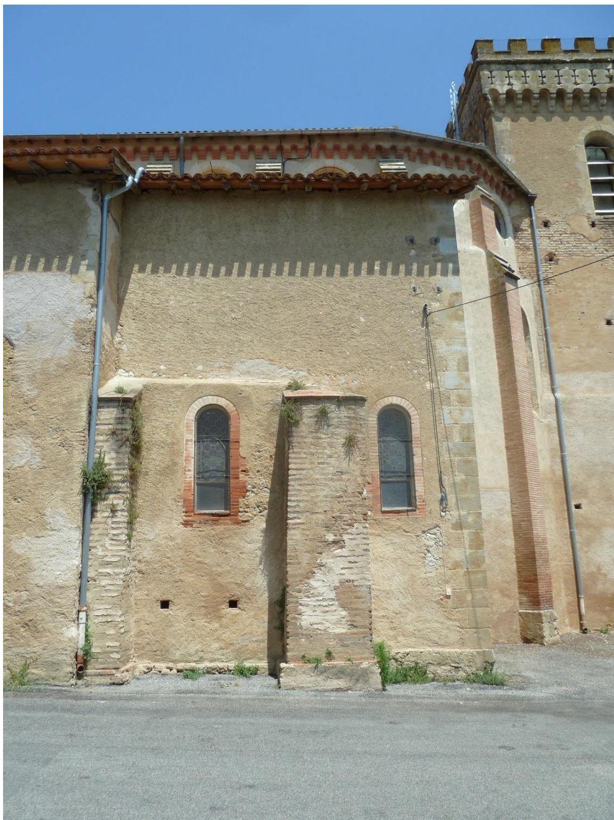
Fig. 8 : Saramon, église paroissiale, la sacristie sud.