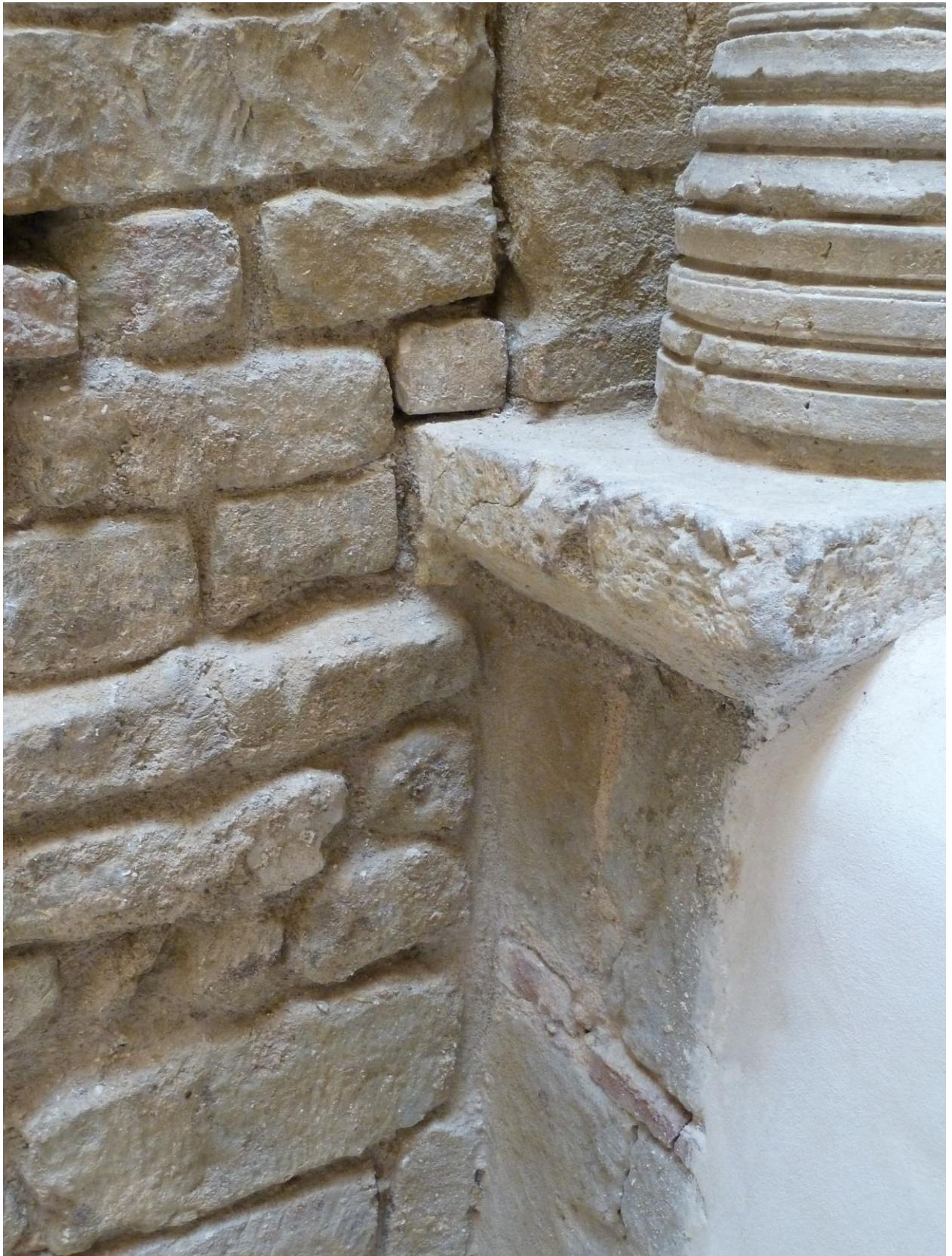
Fig. 50 : Saramon, église paroissiale, tour Saint-Victor, détail de l'élévation de l'arc d'entrée, côté sud.