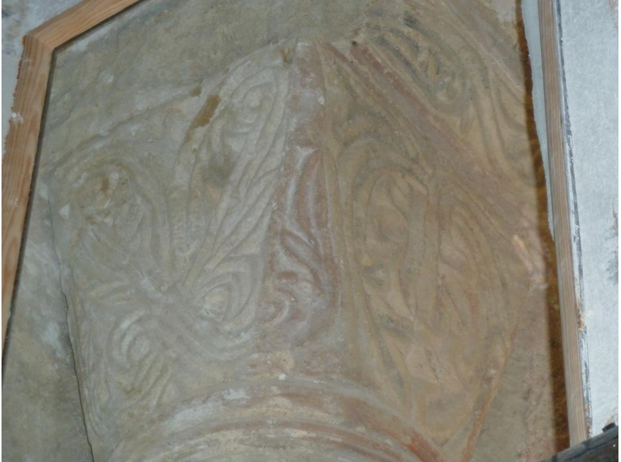
Fig. 54 : Saramon, église paroissiale, tour Saint-Victor, le chapiteau nord, situé côté abside.