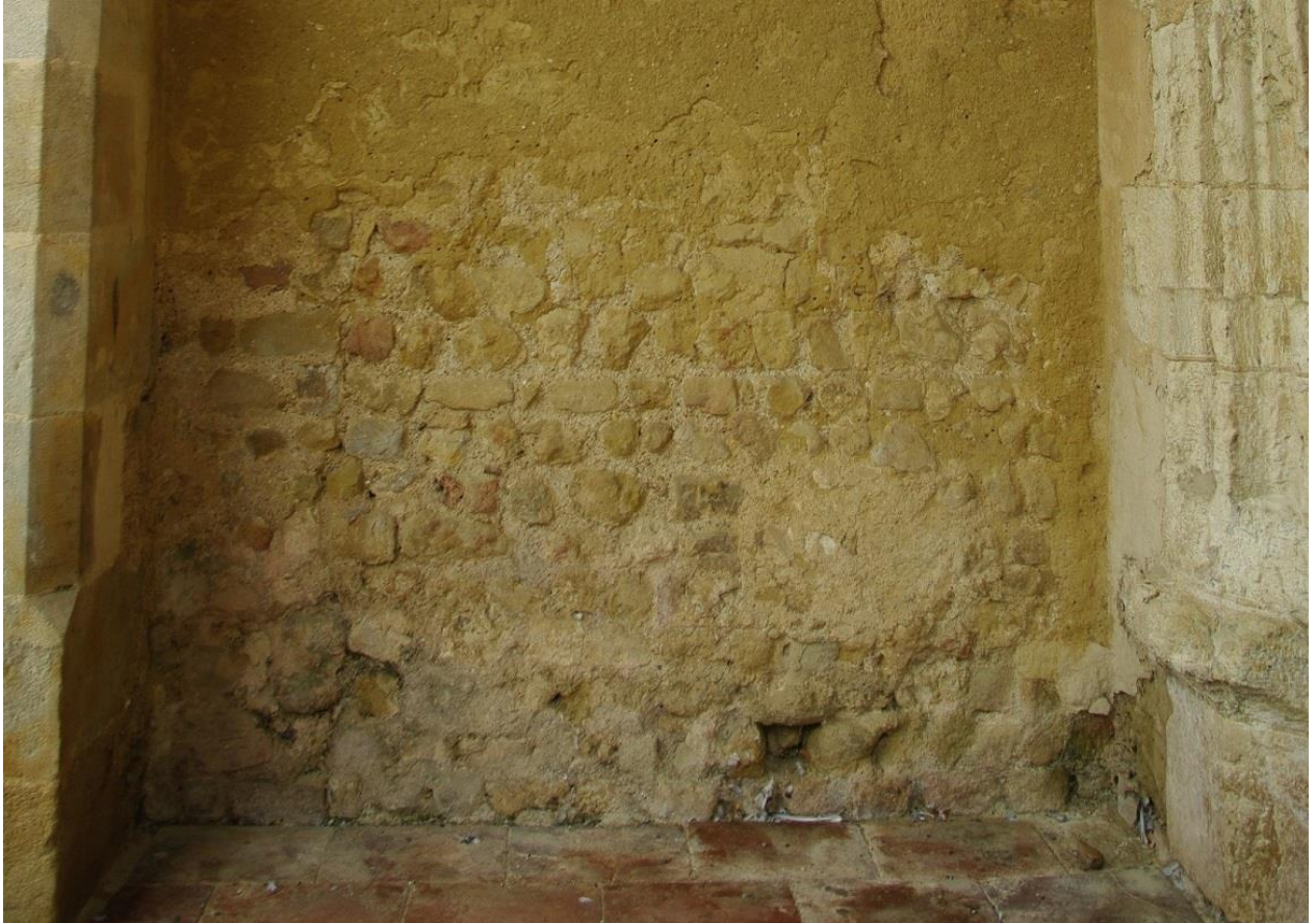
Fig. 23 : Saramon, église paroissiale, détail du mur de l'abside sous le porche est.