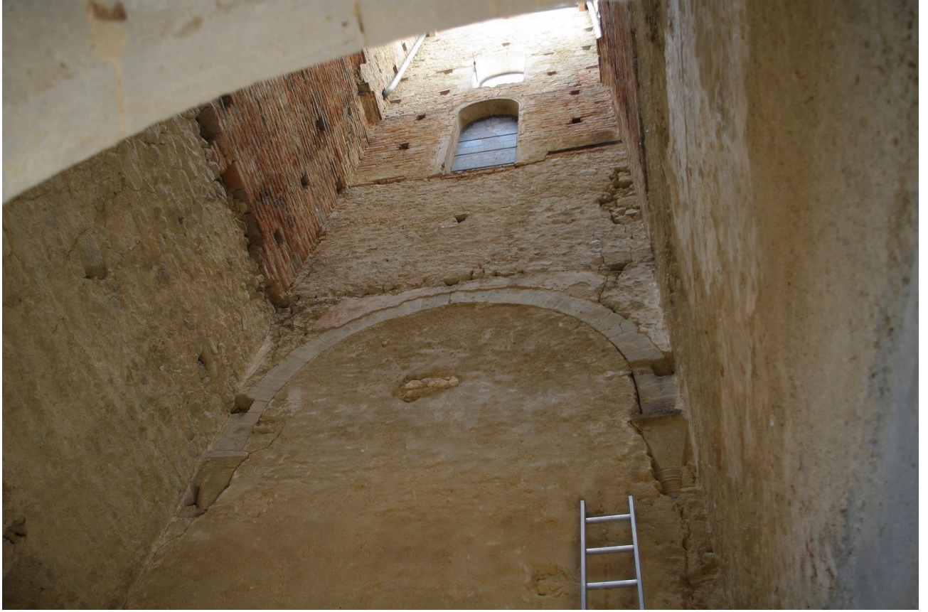
Fig. 33 : Saramon, église paroissiale, la tour Saint-Victor, le revers du mur occidental, en octobre 2014.