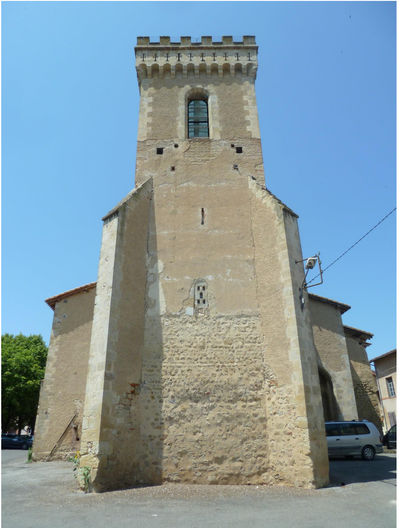
Fig. 25 : Saramon, église paroissiale, la tour Saint-Victor, depuis l'est.