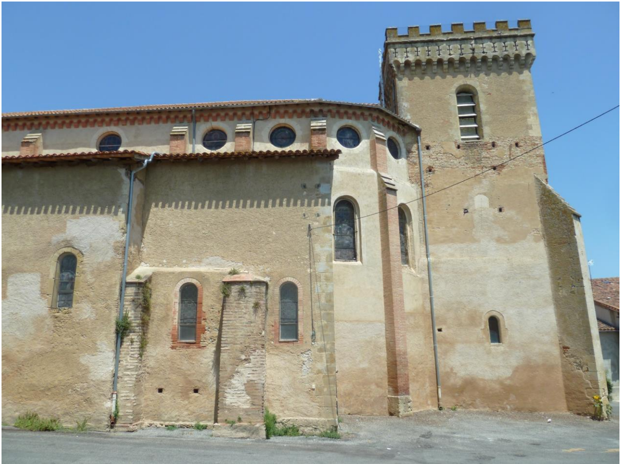
Fig. 3 : Saramon, église paroissiale, la partie orientale avec la tour Saint-Victor.