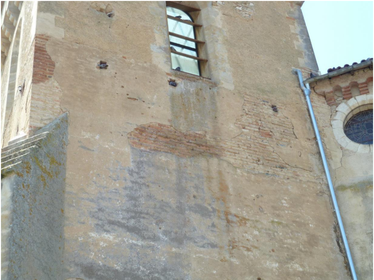
Fig. 27 : Saramon, église paroissiale, la tour Saint-Victor, détail.