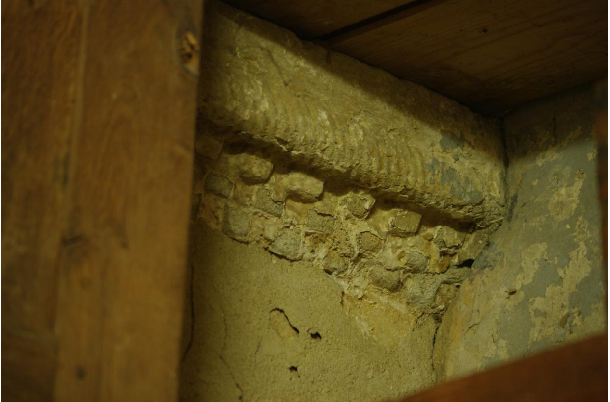
Fig. 10 : Saramon, église paroissiale, la sacristie sud, l'imposte de gauche, détail.