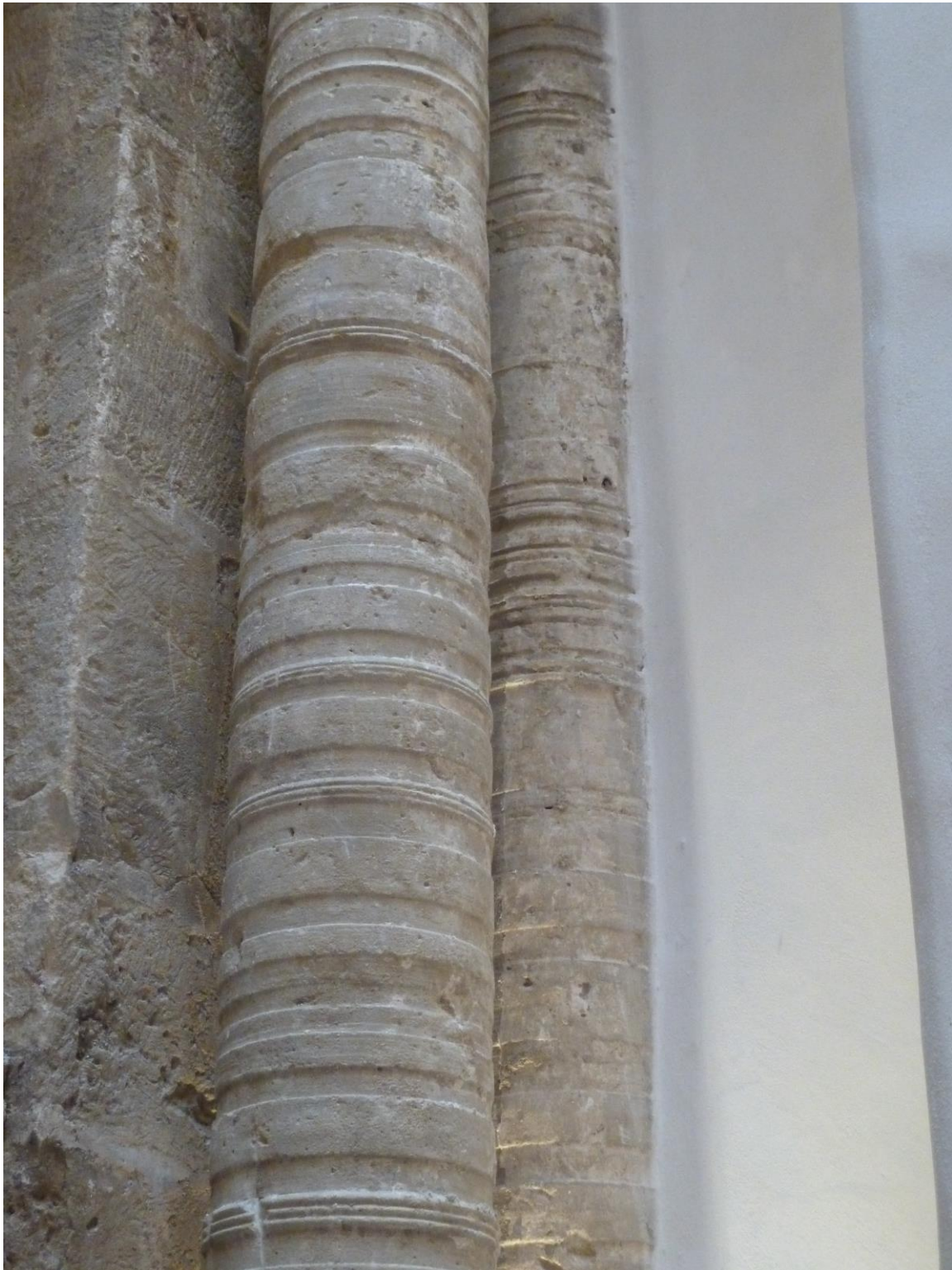
Fig. 57 : Saramon, église paroissiale, tour Saint-Victor, détail des colonnes situées côté sud.