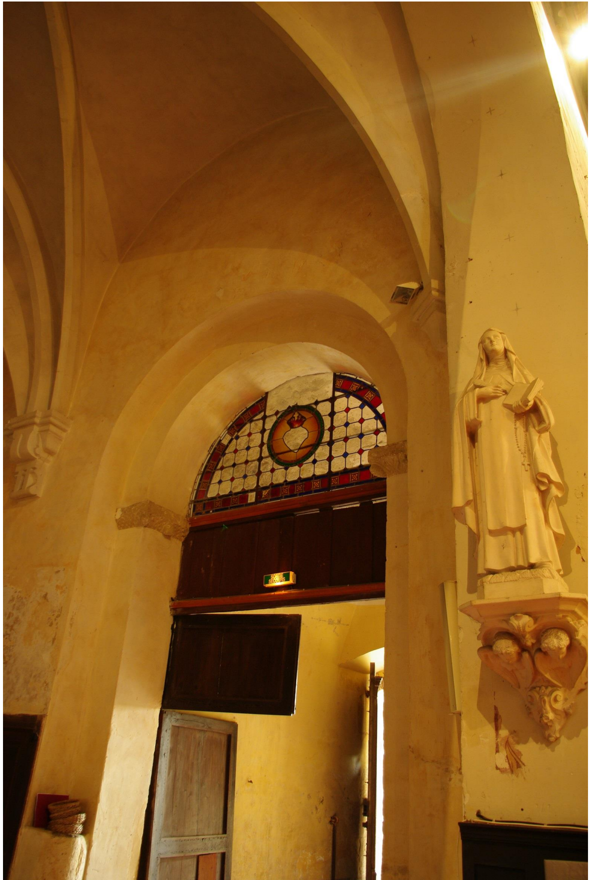
Fig. 18 : Saramon, église paroissiale, la chapelle intérieure nord, vue d'ensemble depuis l'intérieur.