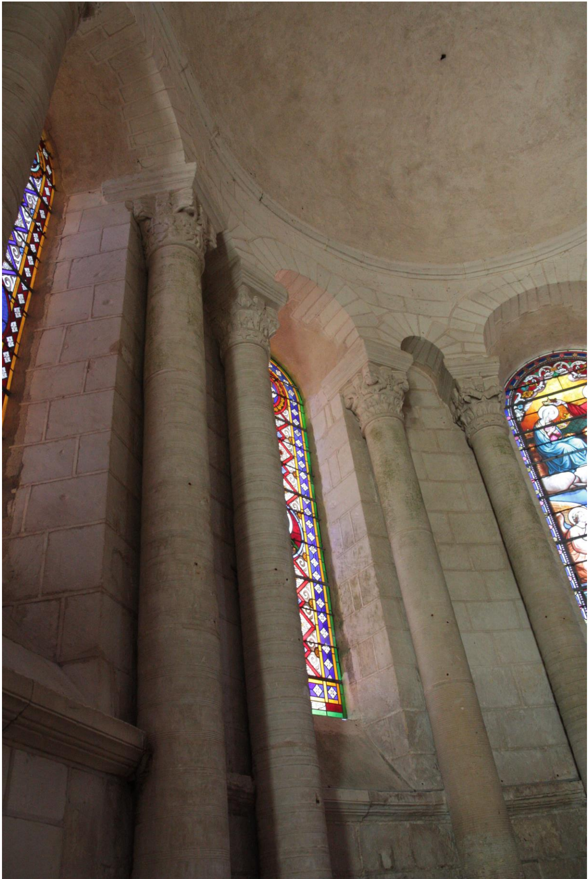
Fig. 62 : Saint-Genou, ancienne abbatale, détail de l'élevation de l'abside, côté nord.