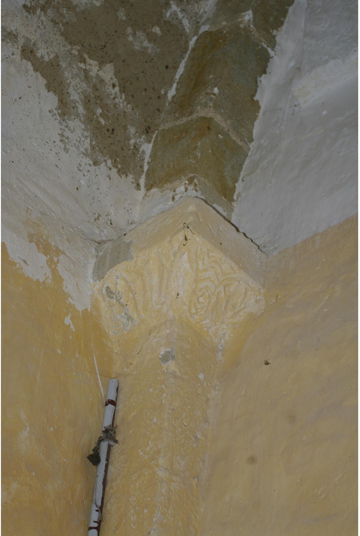
Fig. 16 : Saramon, église paroissiale, la chapelle extérieure nord, l'imposte de gauche, détail.