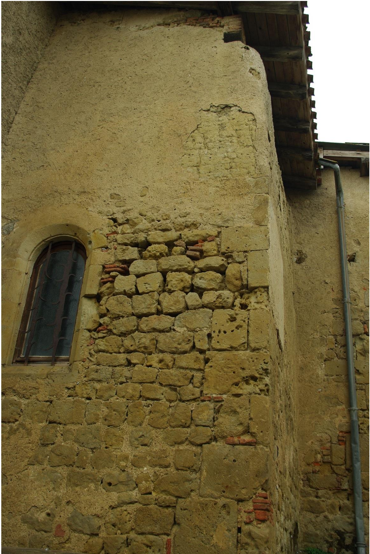
Fig. 15 : Saramon, église paroissiale, le mur est de la chapelle extérieure, détail.