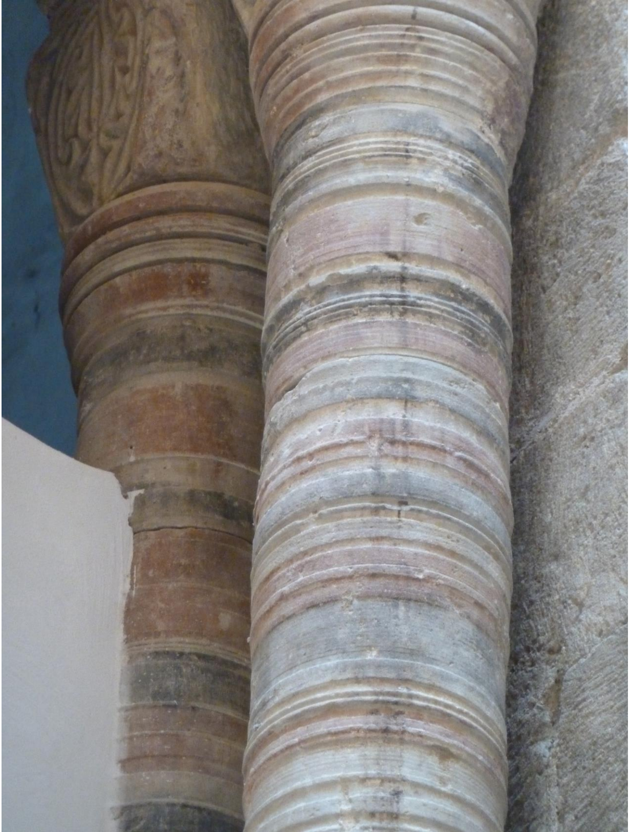
Fig. 60 : Saramon, église paroissiale, tour Saint-Victor, détail des colonnes situées côté nord.