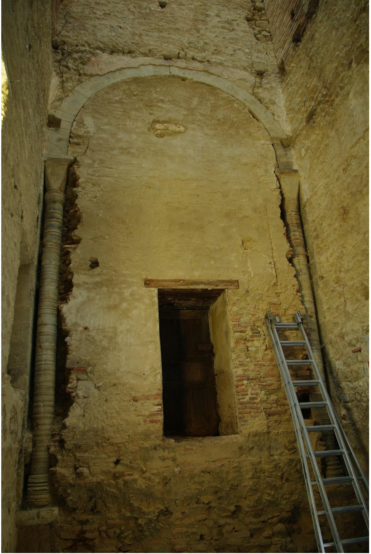
Fig. 41 : Saramon, église paroissiale, la tour Saint-Victor, vue intérieure vers l'ouest, en mars 2015.