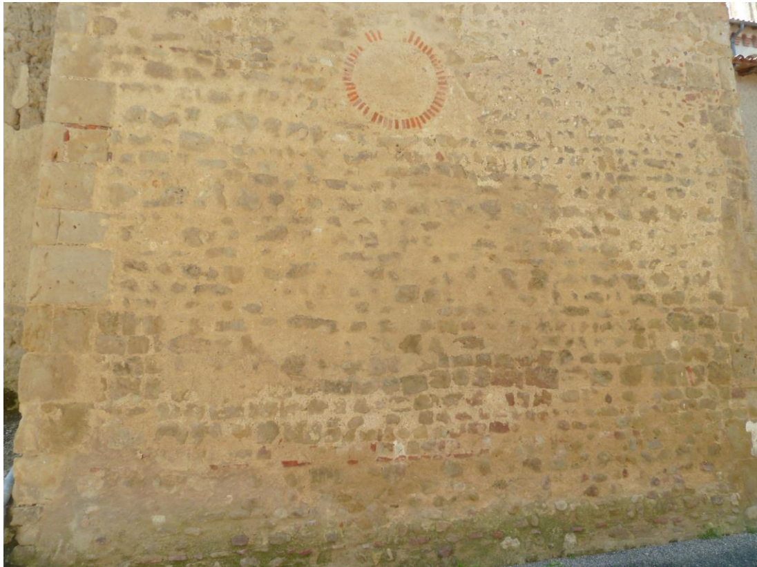
Fig. 12 : Saramon, église paroissiale, détail du mur nord du bras nord du transept.