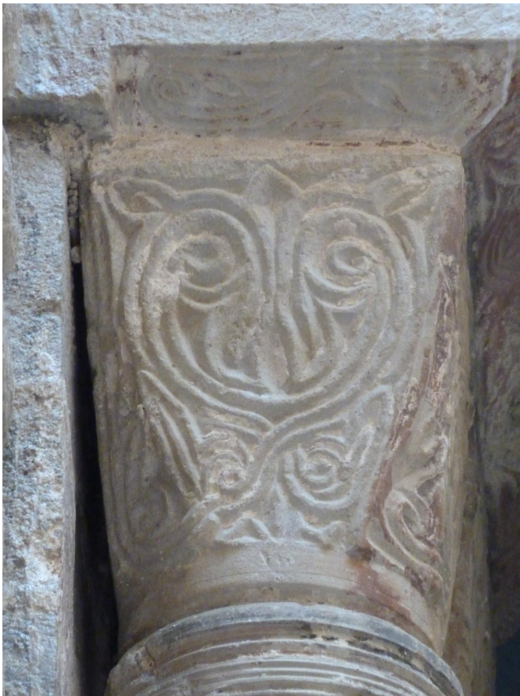
Fig. 53 : Saramon, église paroissiale, tour Saint-Victor, le chapiteau sud, situé côté tour.