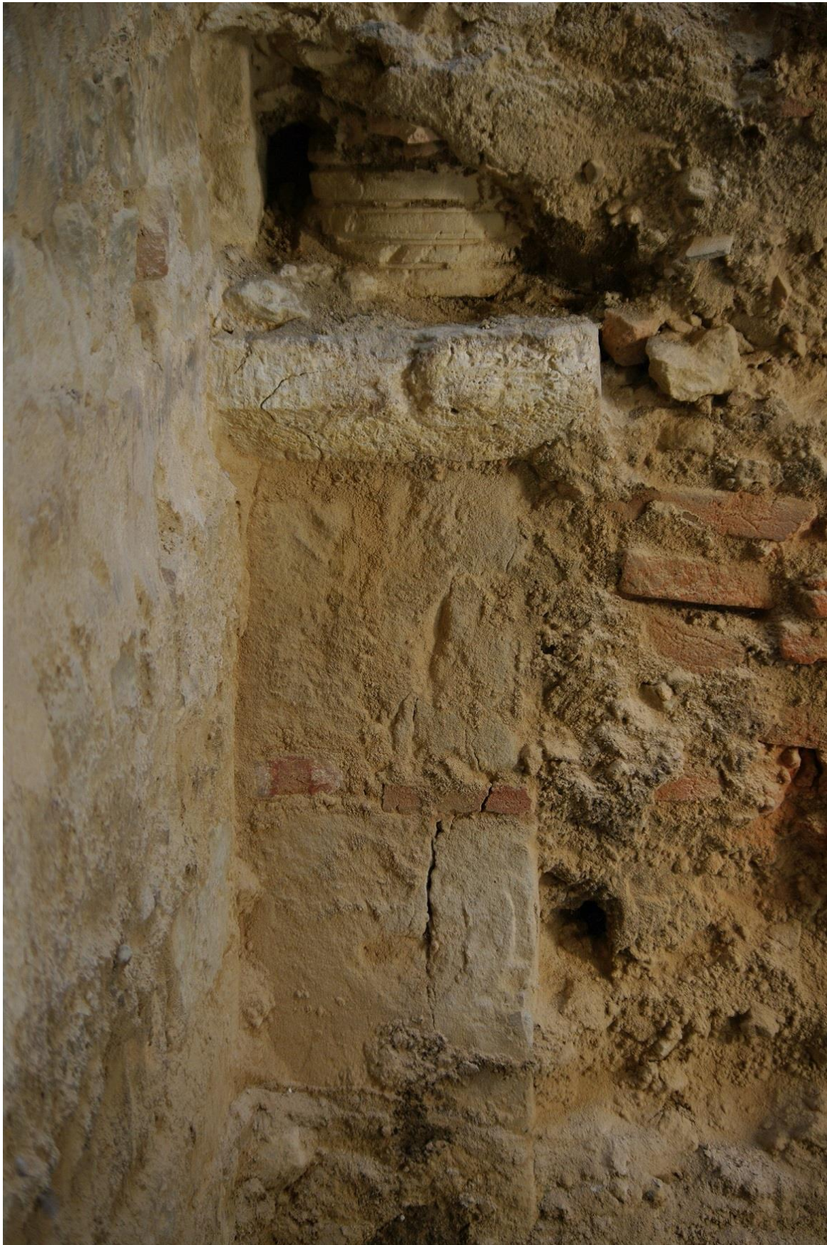
Fig. 37 : Saramon, église paroissiale, la tour Saint-Victor, détail, en partie basse, de l'élevation sud de l'arc triomphal en octobre 2014.