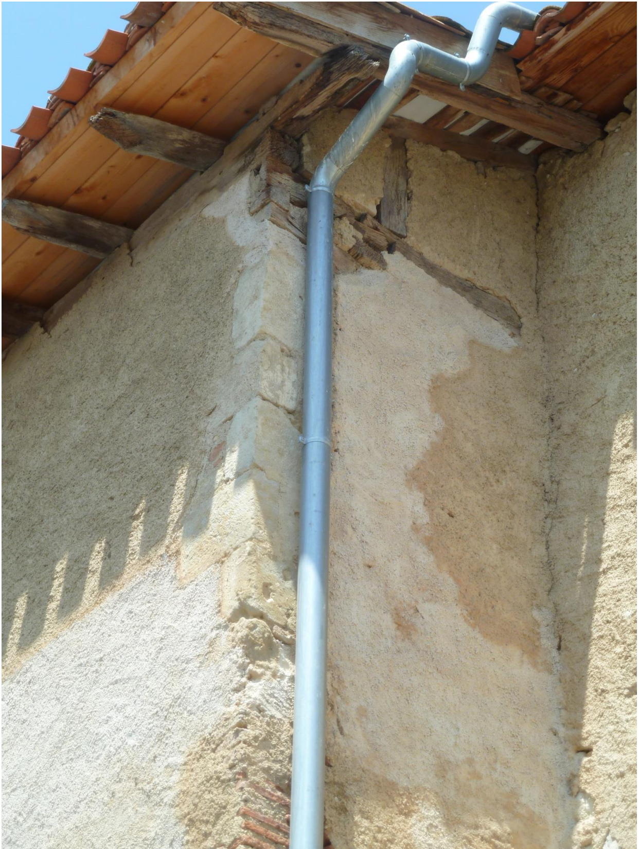
Fig. 13 : Saramon, église paroissiale, détail de l'angle oriental du bras sud du transept.