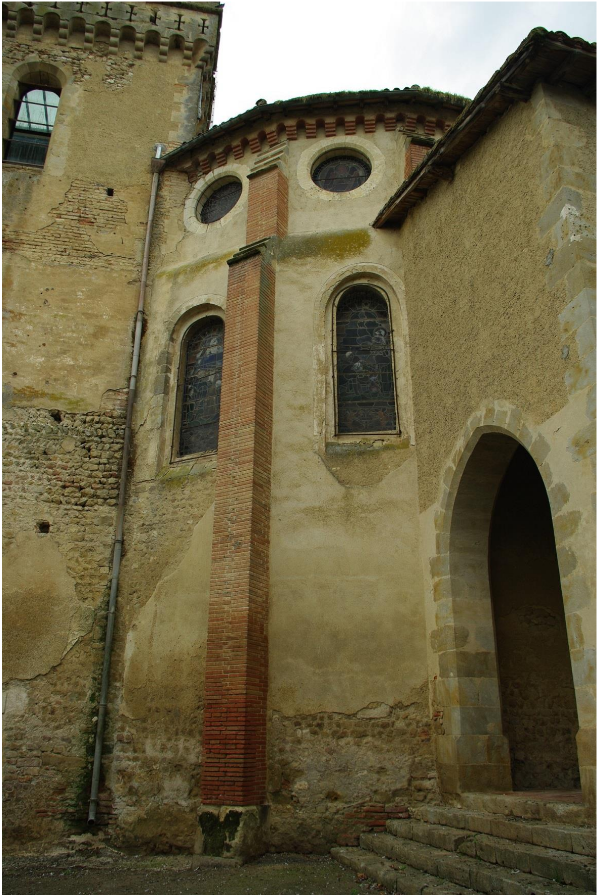
Fig. 22 : Saramon, église paroissiale, l'abside depuis l'angle nord-est.