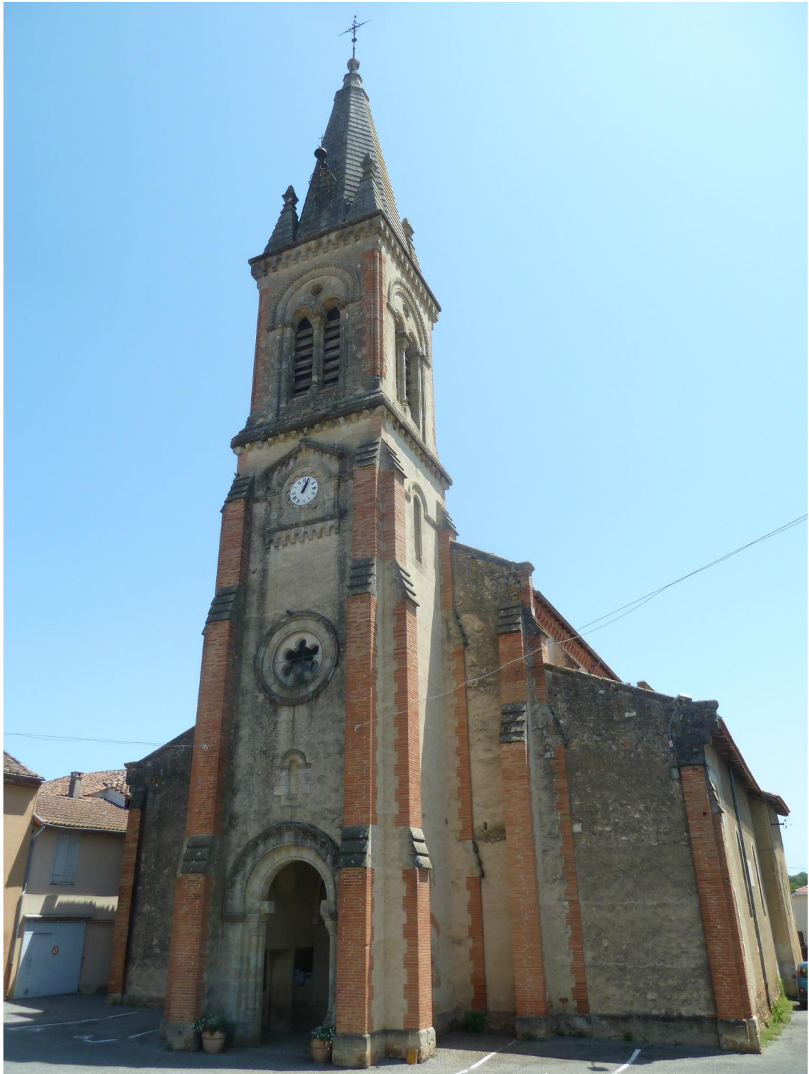
Fig. 1 : Saramon, église paroissiale, la façade occidentale.