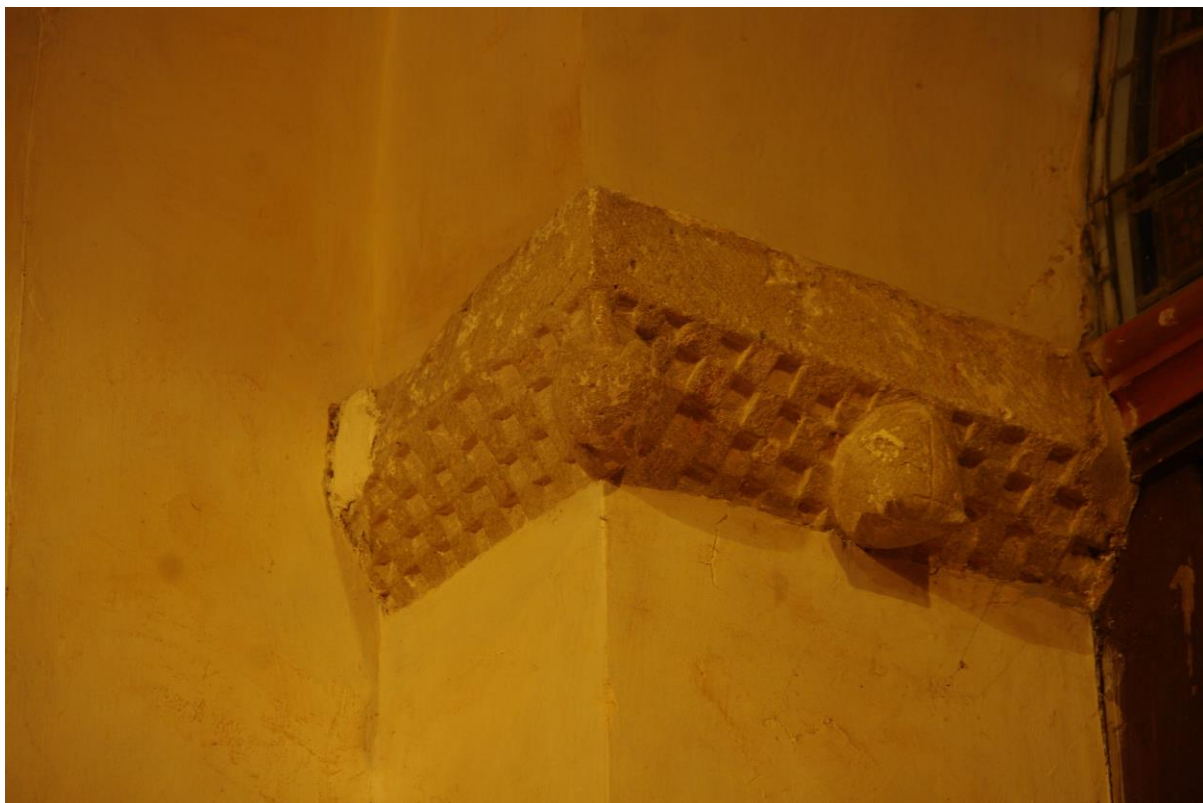
Fig. 19 : Saramon, église paroissiale, la chapelle intérieure nord, l'imposte de gauche, détail.