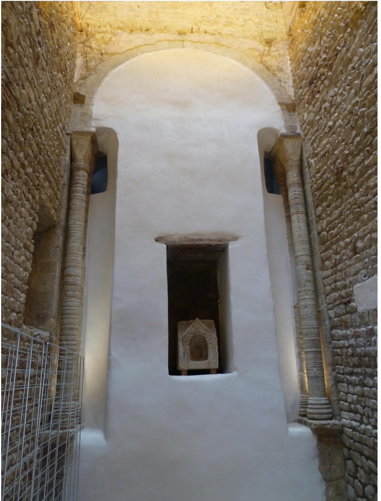
Fig. 45 : Saramon, église paroissiale, vue intérieure de la tour en direction de l'abside, en juillet 2016.