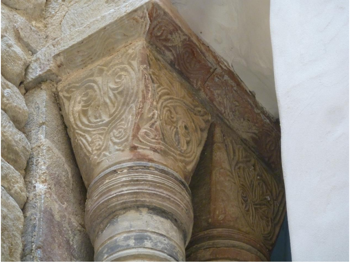
Fig. 46 : Saramon, église paroissiale, tour Saint-Victor, détail de l'élevation de l'arc d'entrée, côté sud.