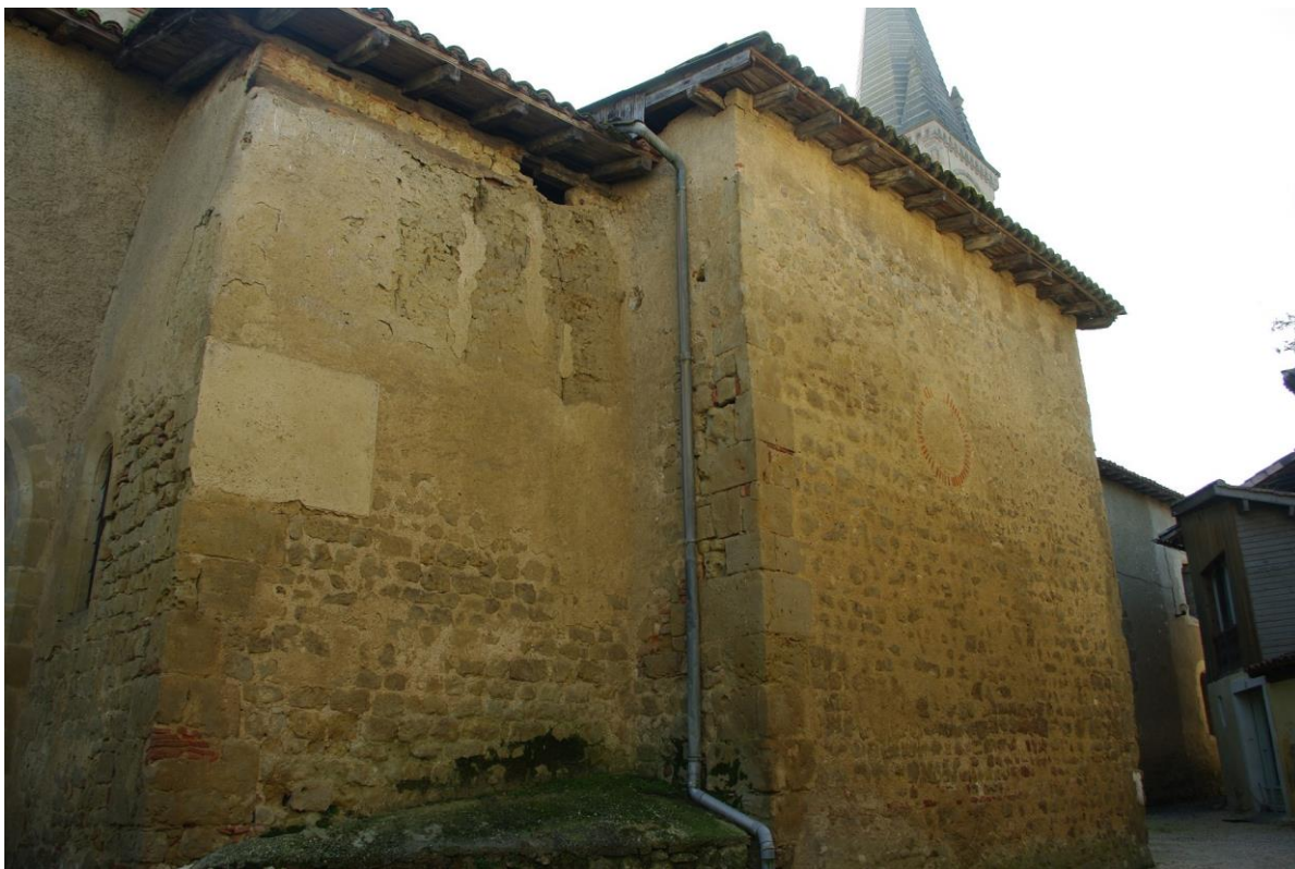
Fig. 14 : Saramon, église paroissiale, le bras nord du transept et la chapelle extérieure.