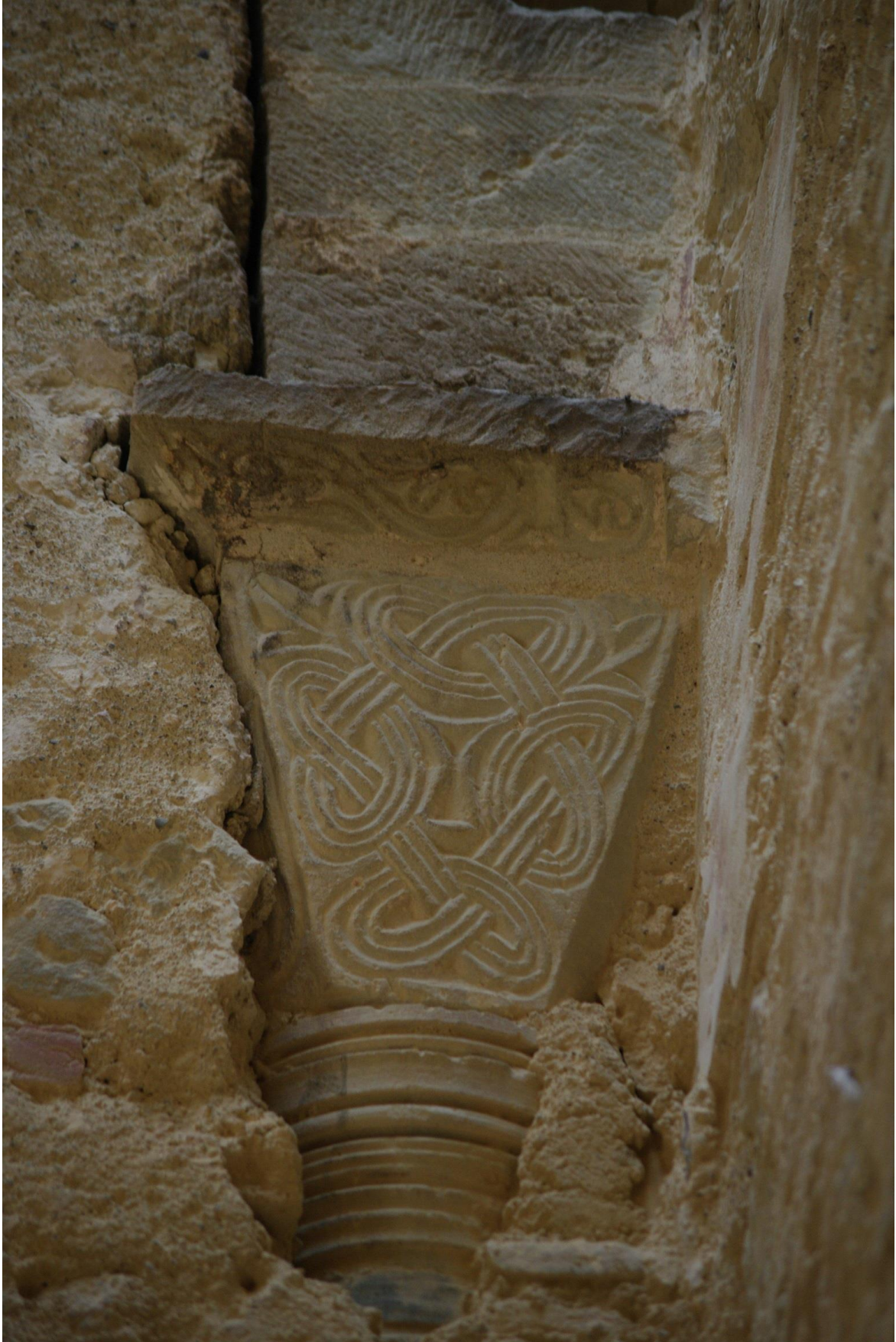
Fig. 36 : Saramon, église paroissiale, la tour Saint-Victor, détail de l'élevation nord de l'arc triomphal en octobre 2014.