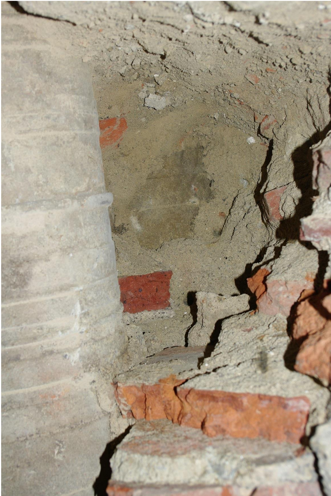
Fig. 40 : Saramon, église paroissiale, la tour Saint-Victor, dégagement partiel de la 2 e colonne à l'arrière de la 1 ère .