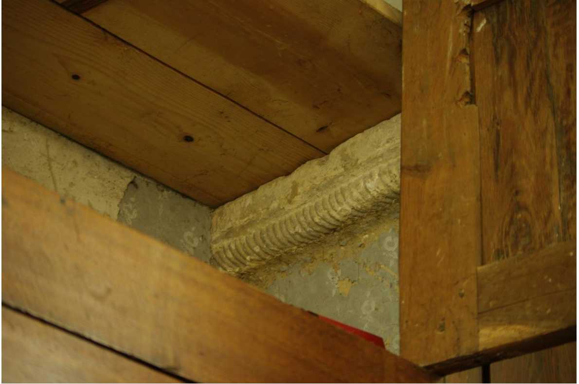
Fig. 11 : Saramon, église paroissiale, la sacristie sud, l'imposte de droite, détail.