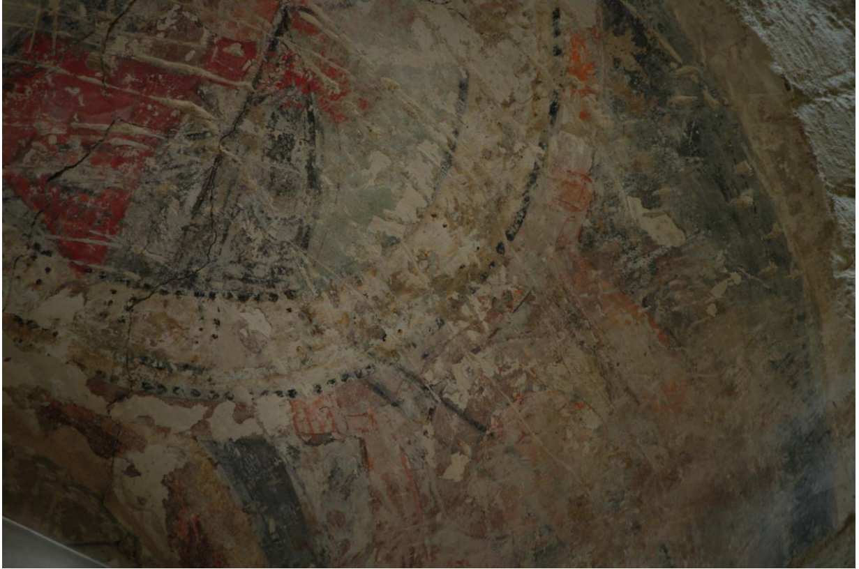
Fig. 67 : Saramon, église paroissiale, tour Saint-Victor, la fenêtre orientale, détail.