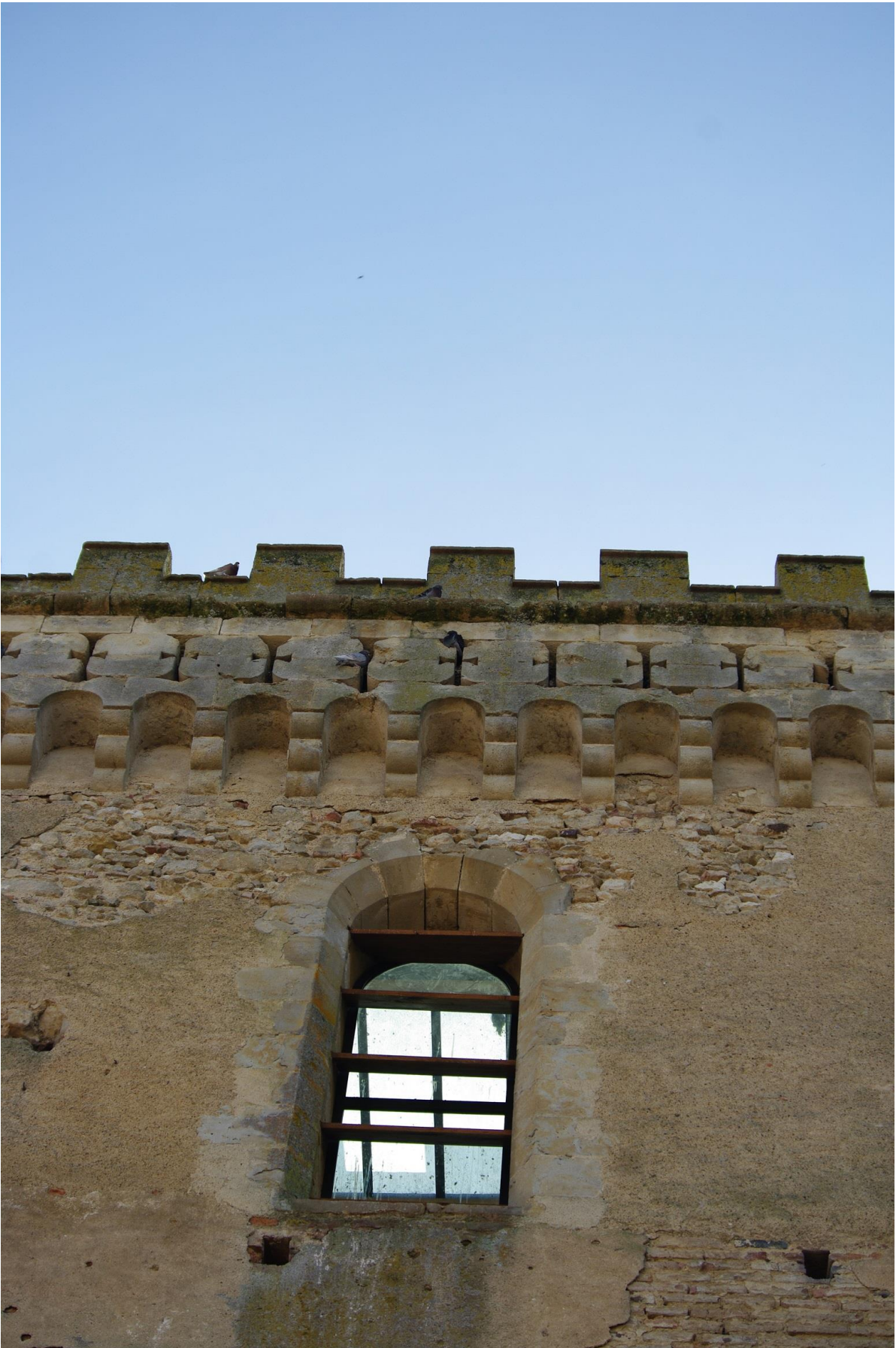
Fig. 26 : Saramon, église paroissiale, la tour Saint-Victor, détail.