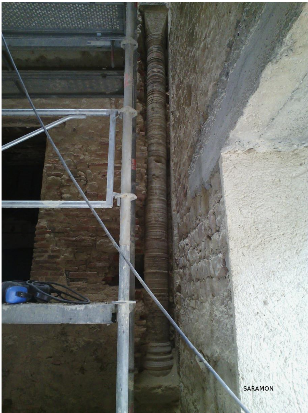
Fig. 39 : Saramon, église paroissiale, la tour Saint-Victor, dégagement de la colonne, côté nord, en novembre 2014.