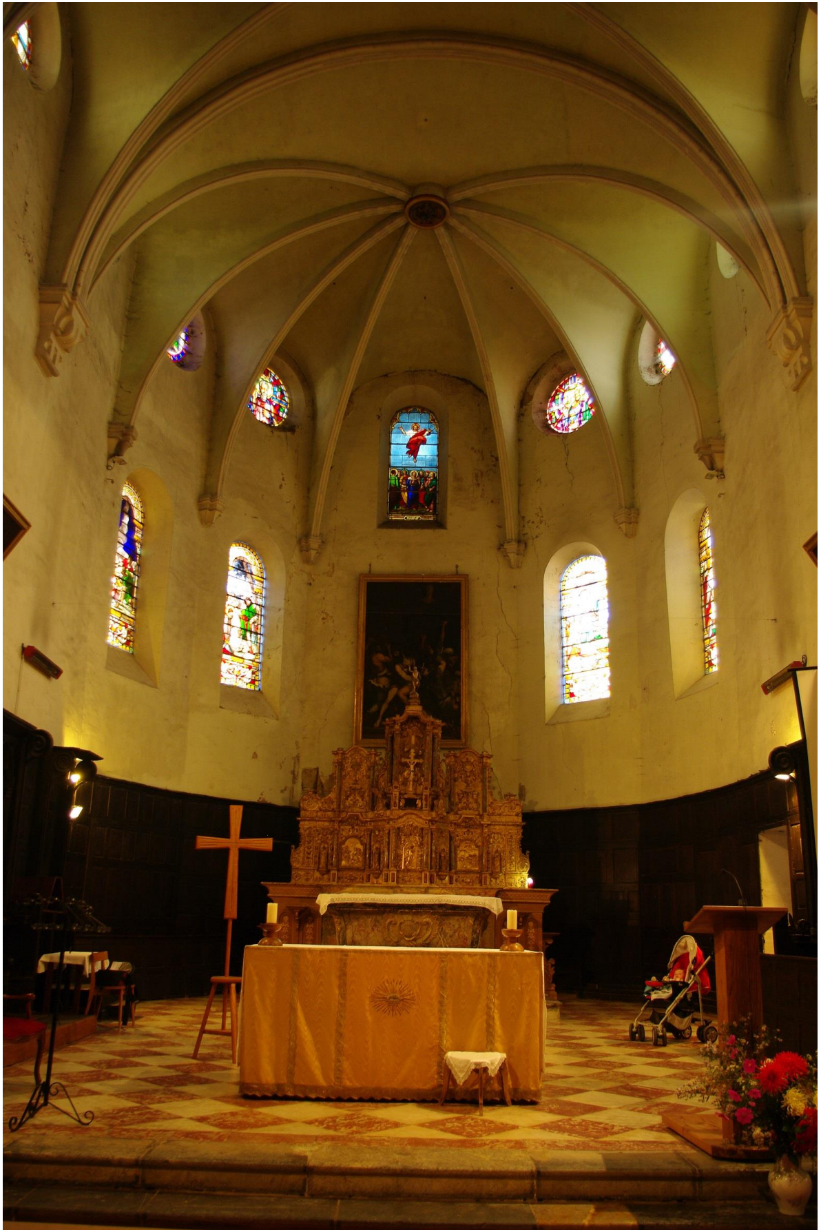
Fig. 21 : Saramon, église paroissiale, l'abside, vue d'ensemble.