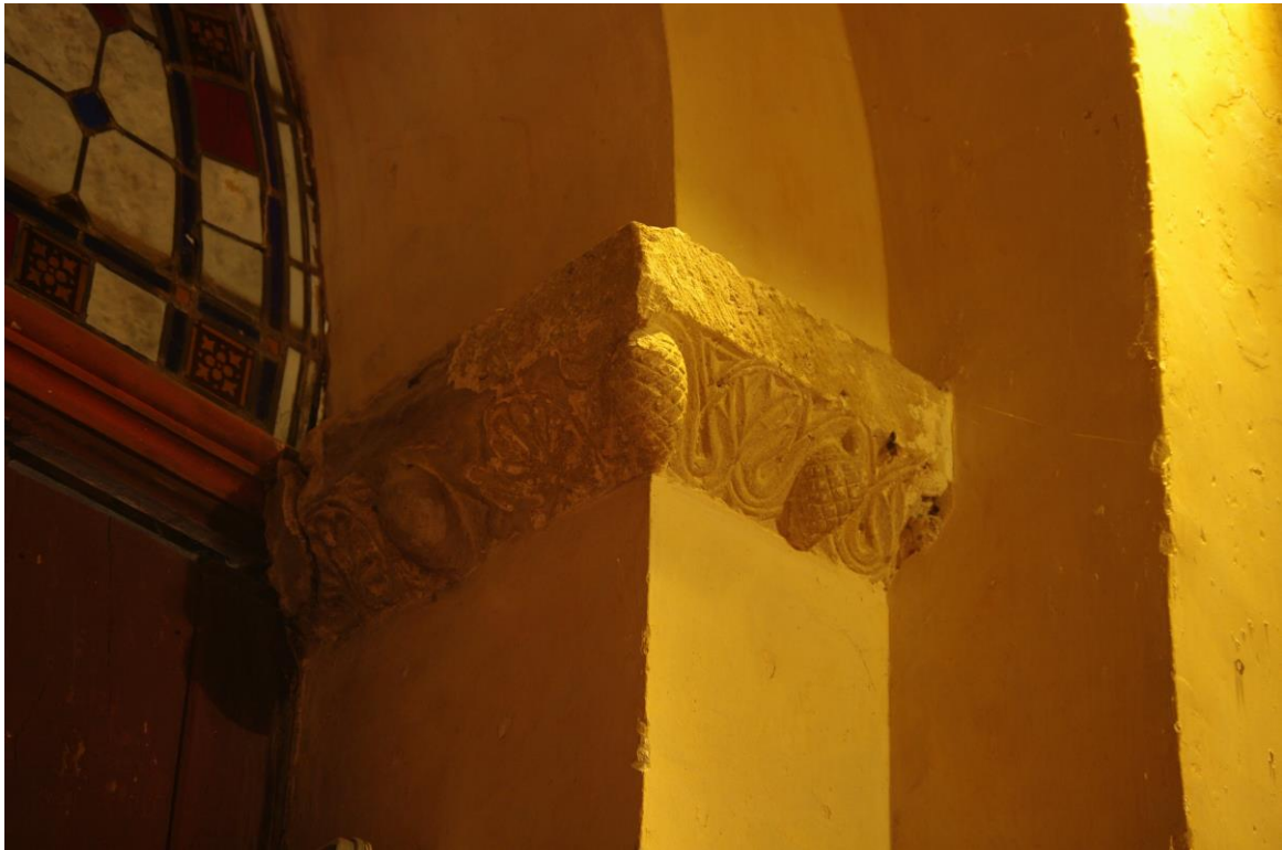
Fig. 20 : Saramon, église paroissiale, la chapelle intérieure nord, l'imposte de droite, détail.