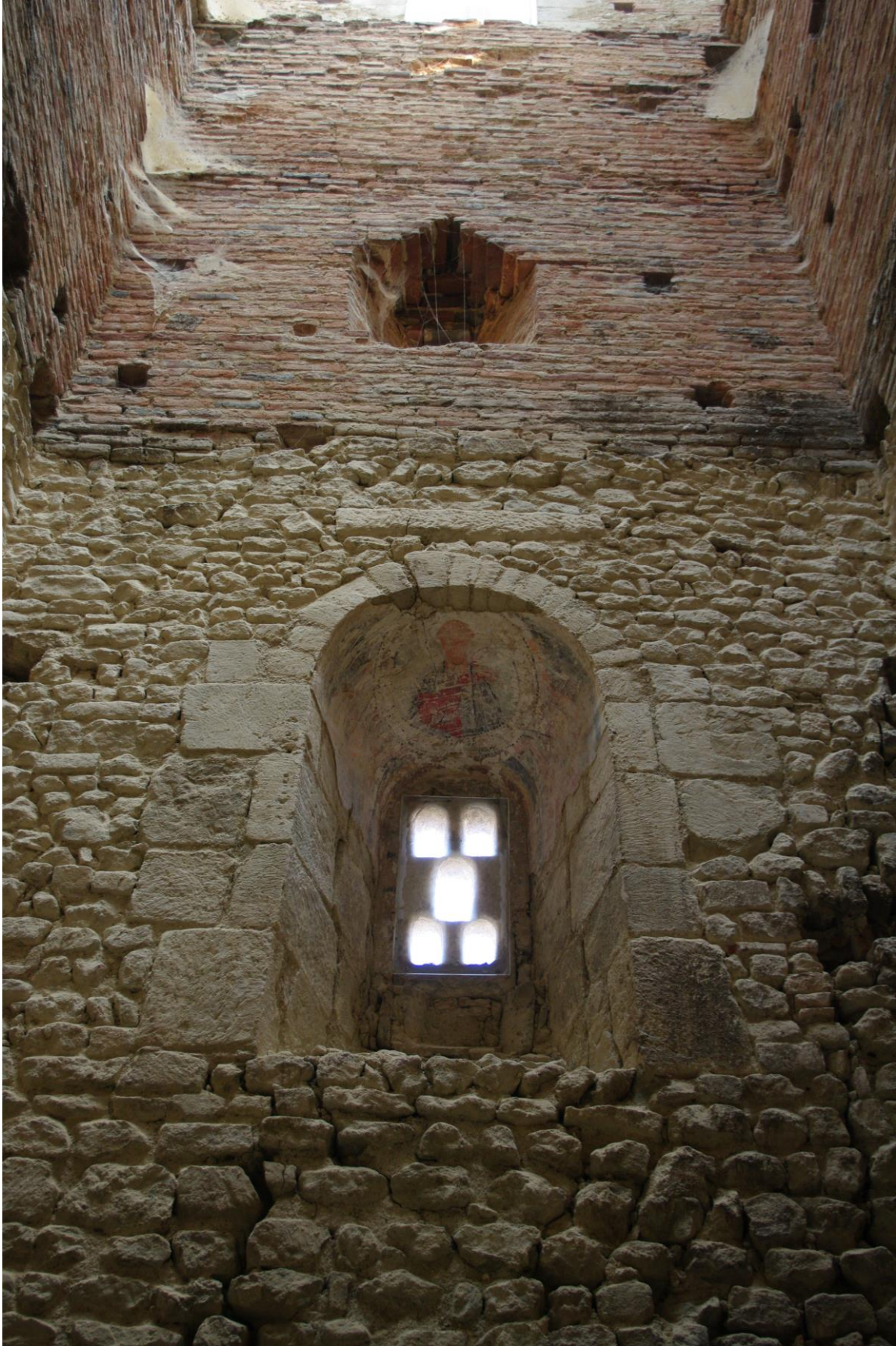
Fig. 65 : Saramon, église paroissiale, tour Saint-Victor, la fenêtre orientale, depuis l'intérieur de la tour.