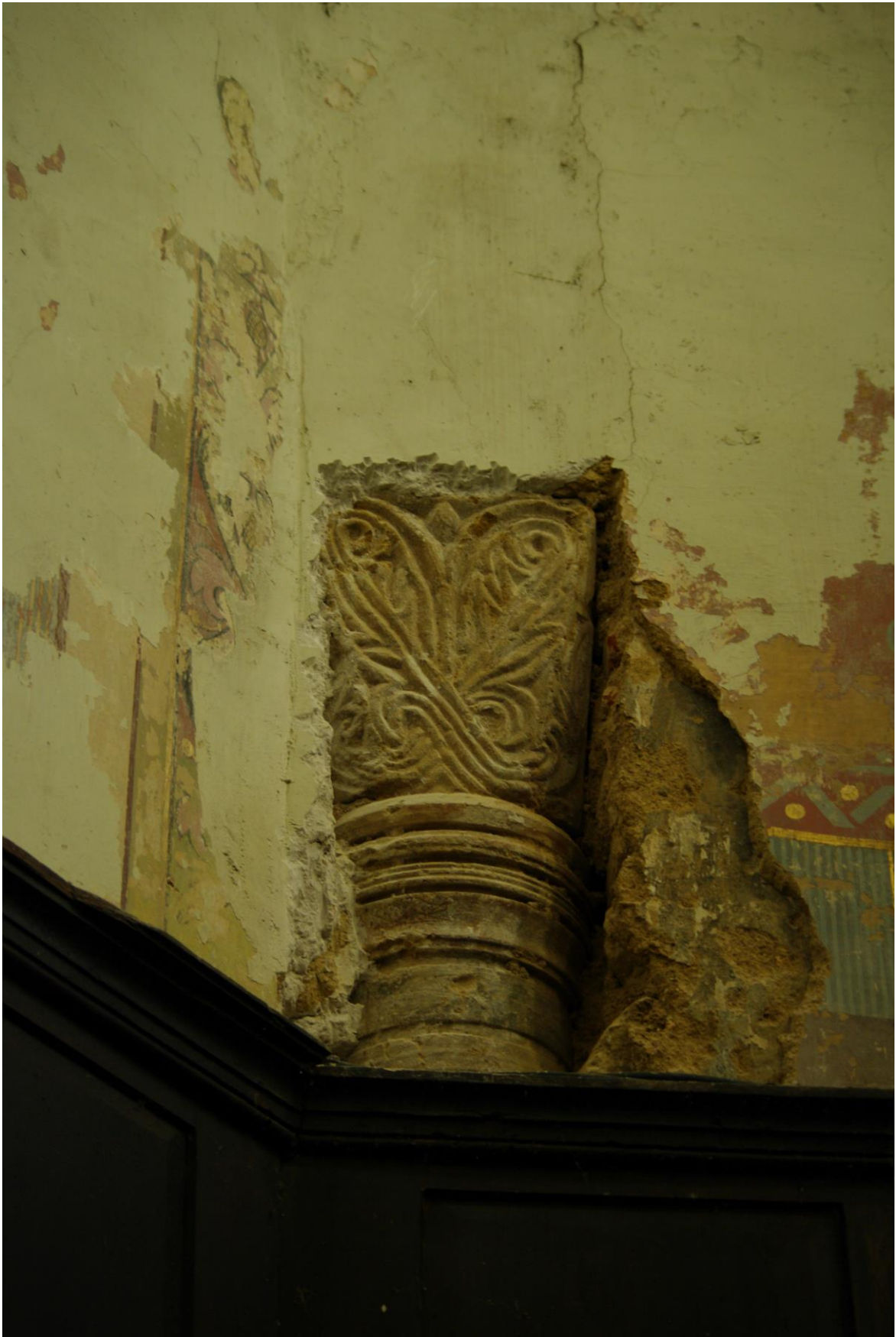
Fig. 42 : Saramon, église paroissiale, dégagement du chapiteau de gauche de l'arc triomphal, côté abside, en mars 2015.