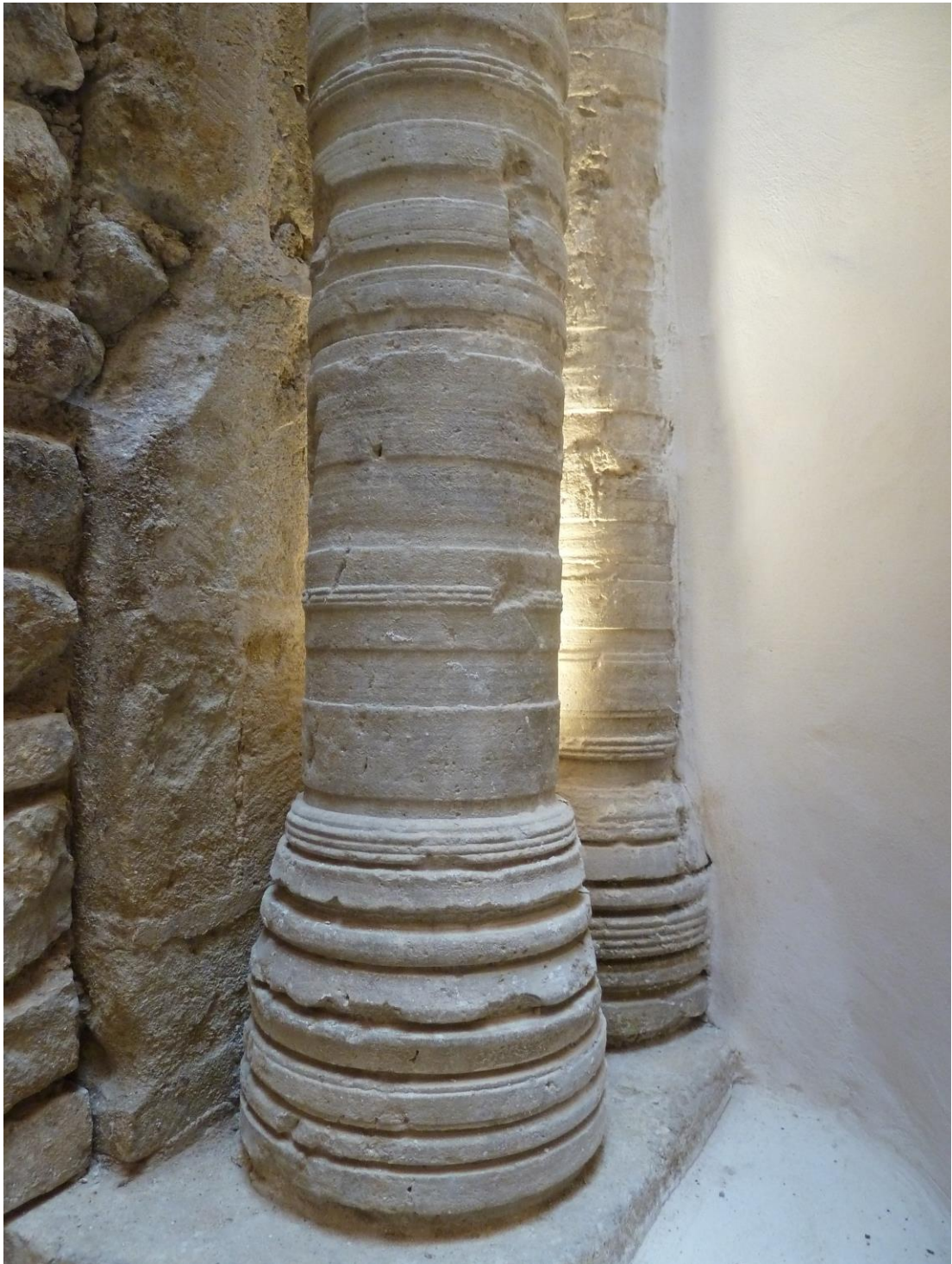
Fig. 58 : Saramon, église paroissiale, tour Saint-Victor, les bases des colonnes, côté sud.