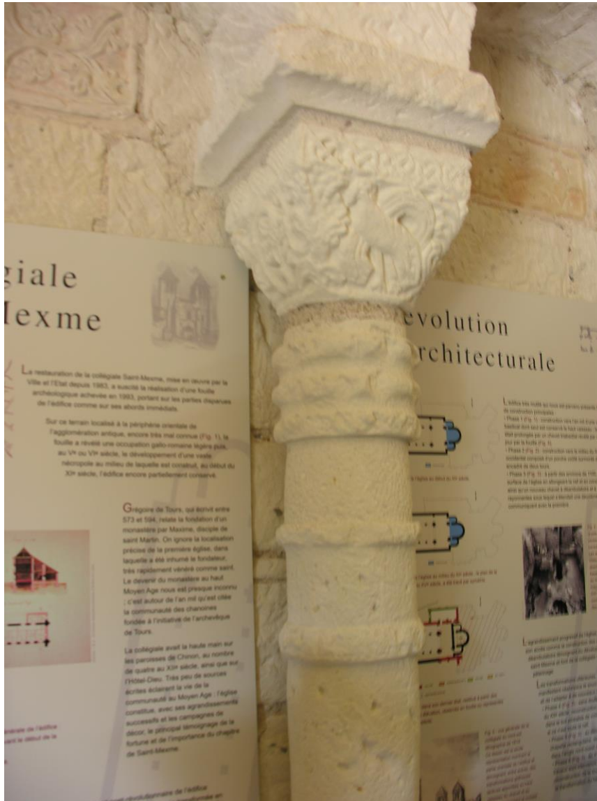
Fig. 61 : Chinon, ancienne collégiale Saint-Mexme, détail de l'élevation du narthex, côté nord.