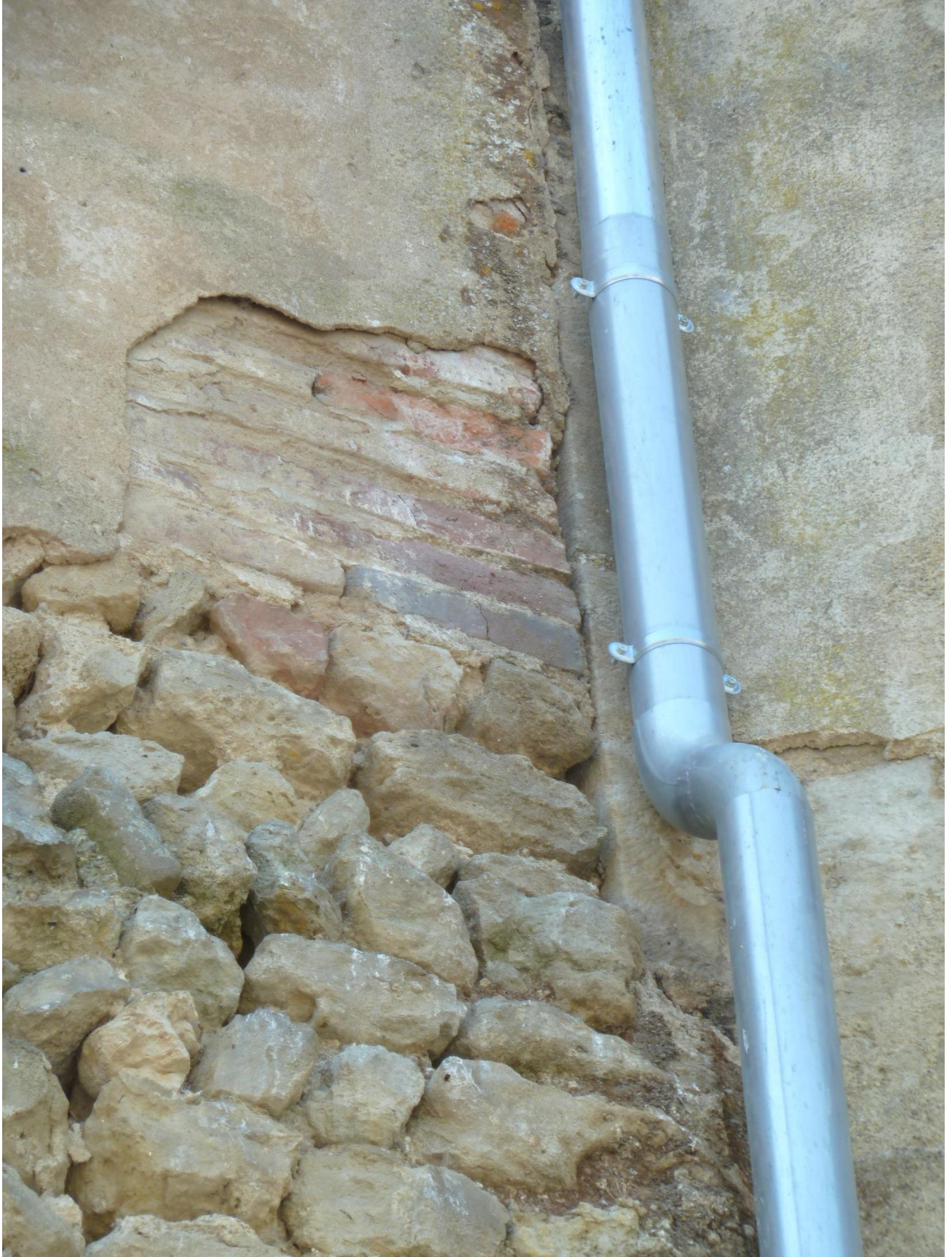
Fig. 32 : Saramon, église paroissiale, la tour Saint-Victor, élévation extérieure nord, détail.