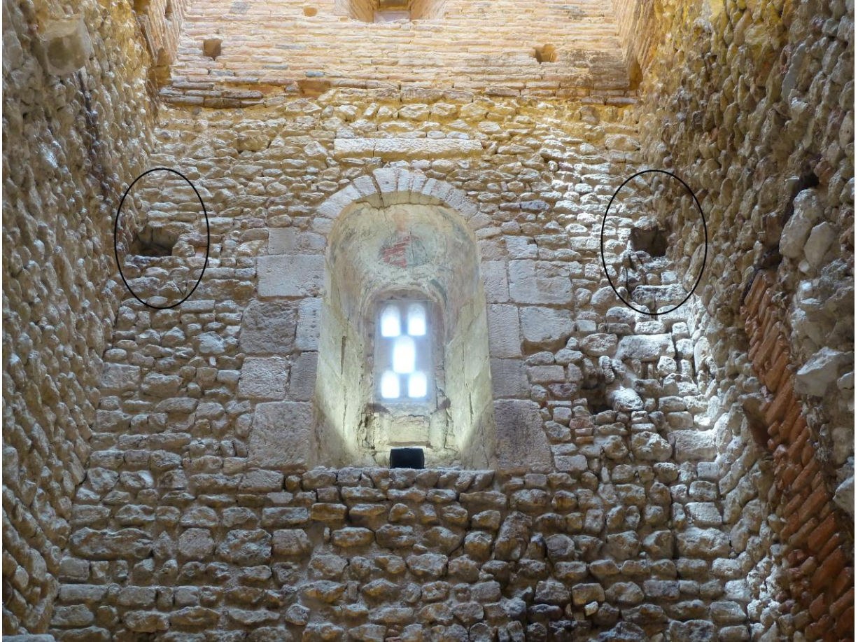
Fig. 70 : Saramon, église paroissiale, tour Saint-Victor, le mur oriental, les deux orifices sont entourés en noir.