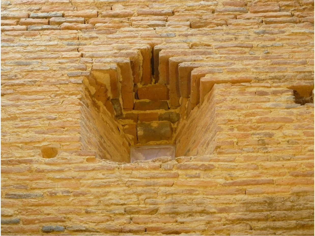
Fig. 28 : Saramon, église paroissiale, la tour Saint-Victor, vue intérieure de la meurtrière orientale.