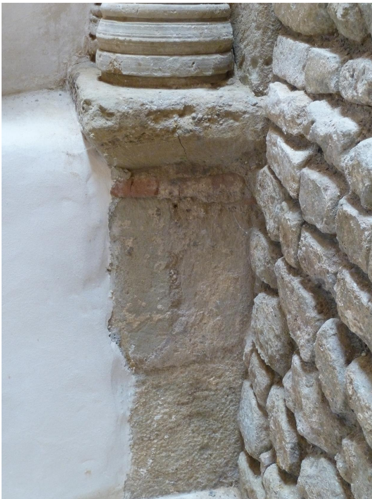
Fig. 49 : Saramon, église paroissiale, tour Saint-Victor, détail de l'élévation de l'arc d'entrée, côté nord.