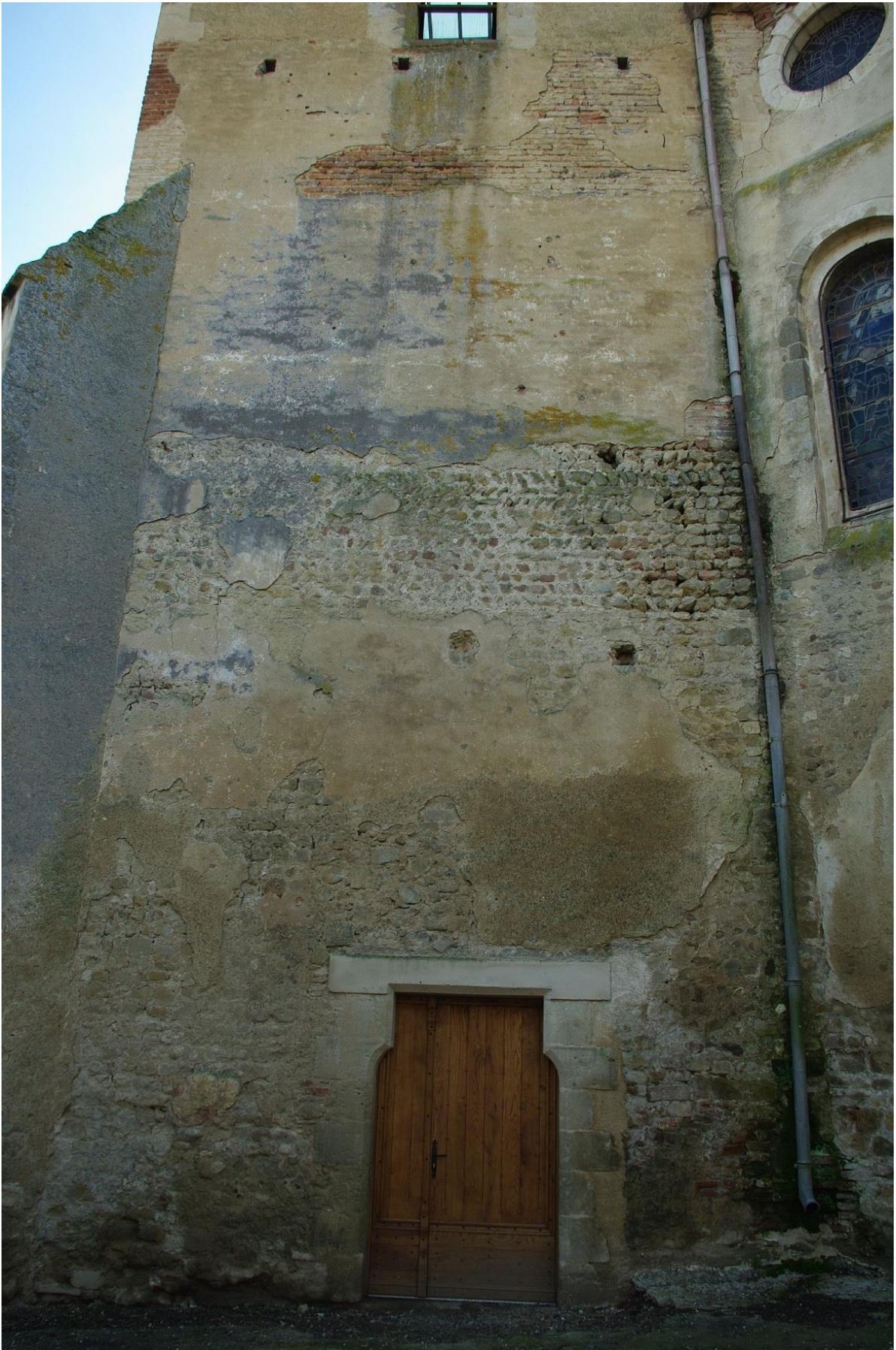
Fig. 29 : Saramon, église paroissiale, la tour Saint-Victor, détail de l'élévation extérieure nord.