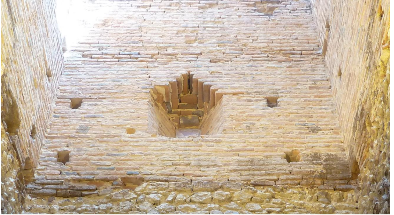
Fig. 35 : Saramon, église paroissiale, la tour Saint-Victor, vue intérieure du mur est en juillet 2016, détail.