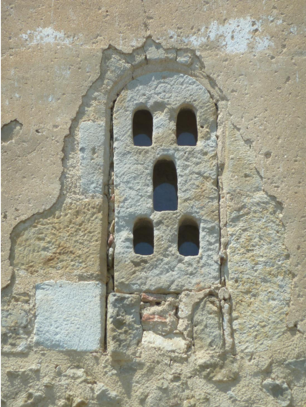
Fig. 64 : Saramon, église paroissiale, tour Saint-Victor, la transepte orientale.