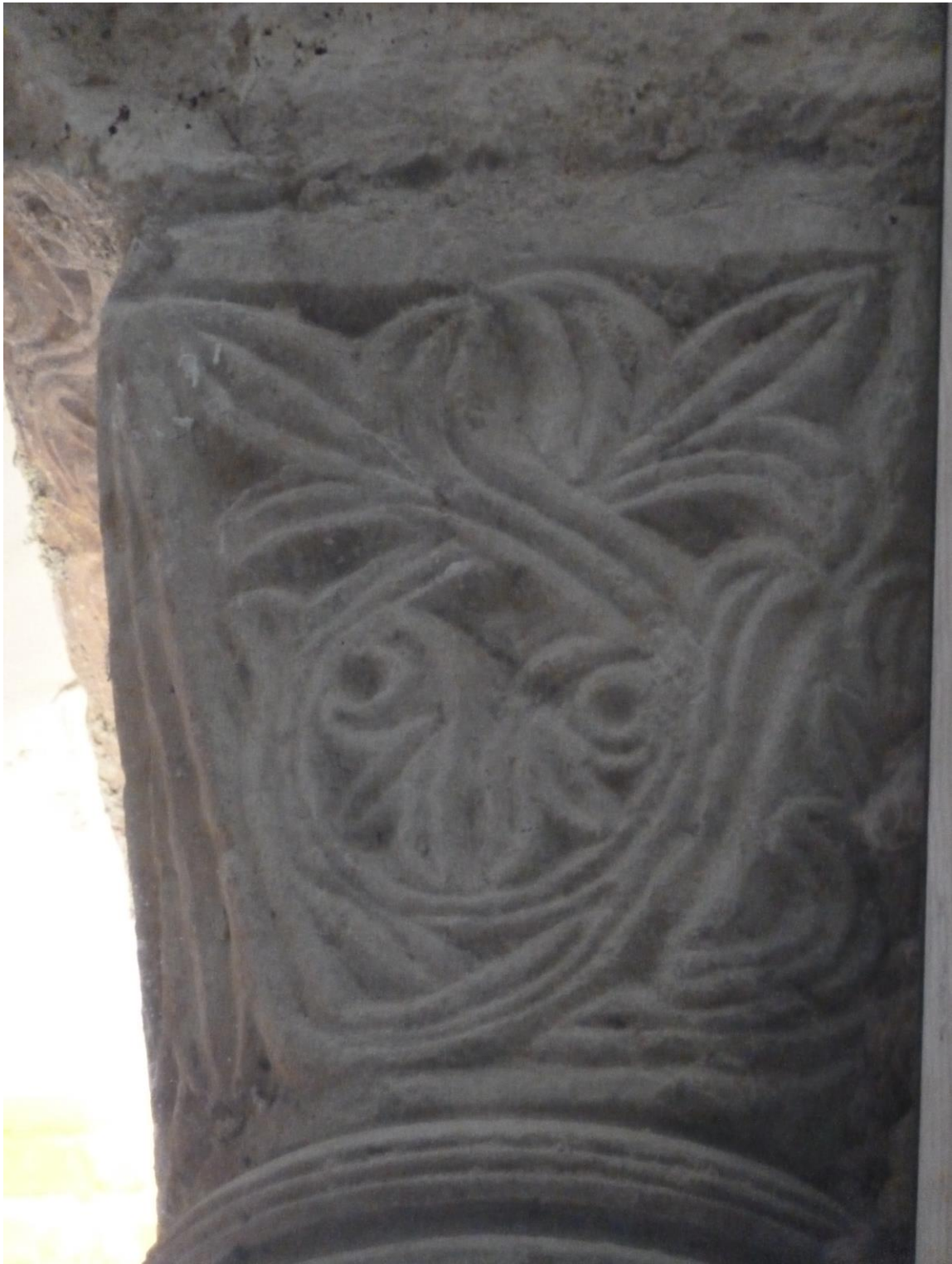
Fig. 55 : Saramon, église paroissiale, tour Saint-Victor, le chapiteau sud, situé côté abside.