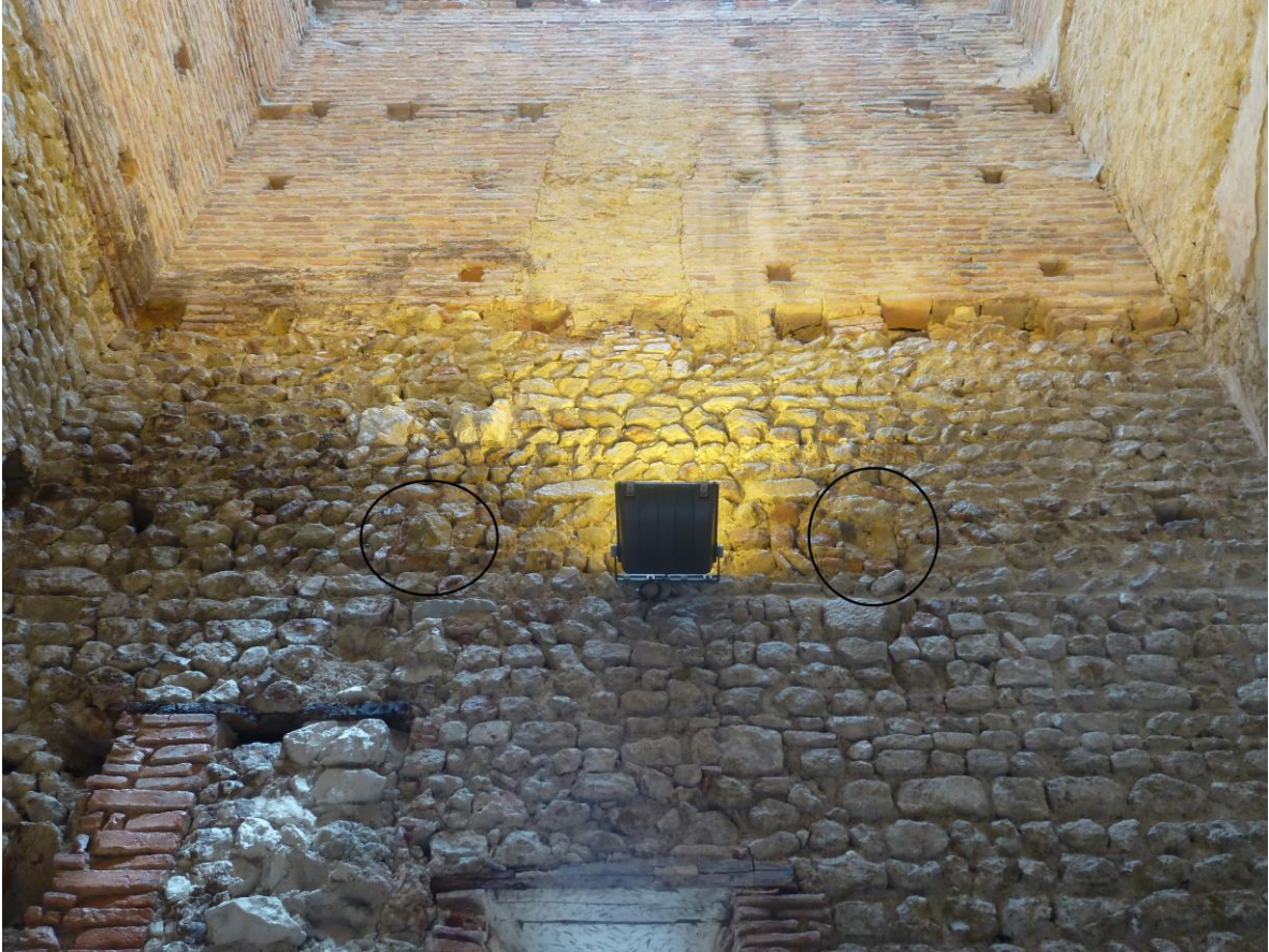
Fig. 69 : Saramon, église paroissiale, tour Saint-Victor, le mur sud, les deux corbeaux sont entourés en noir.