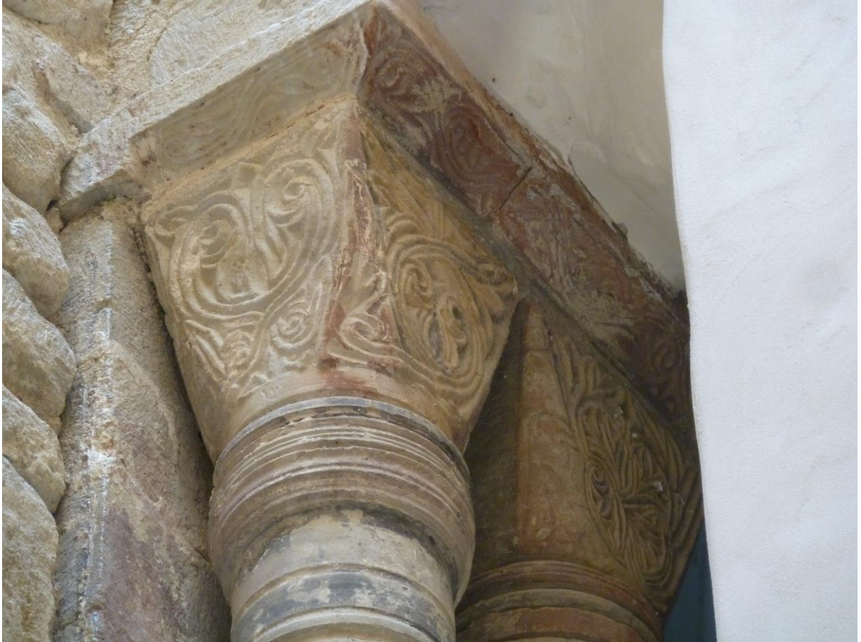
Fig. 59 : Saramon, église paroissiale, tour Saint-Victor, l'extrémité supérieure des colonnes, côté sud.