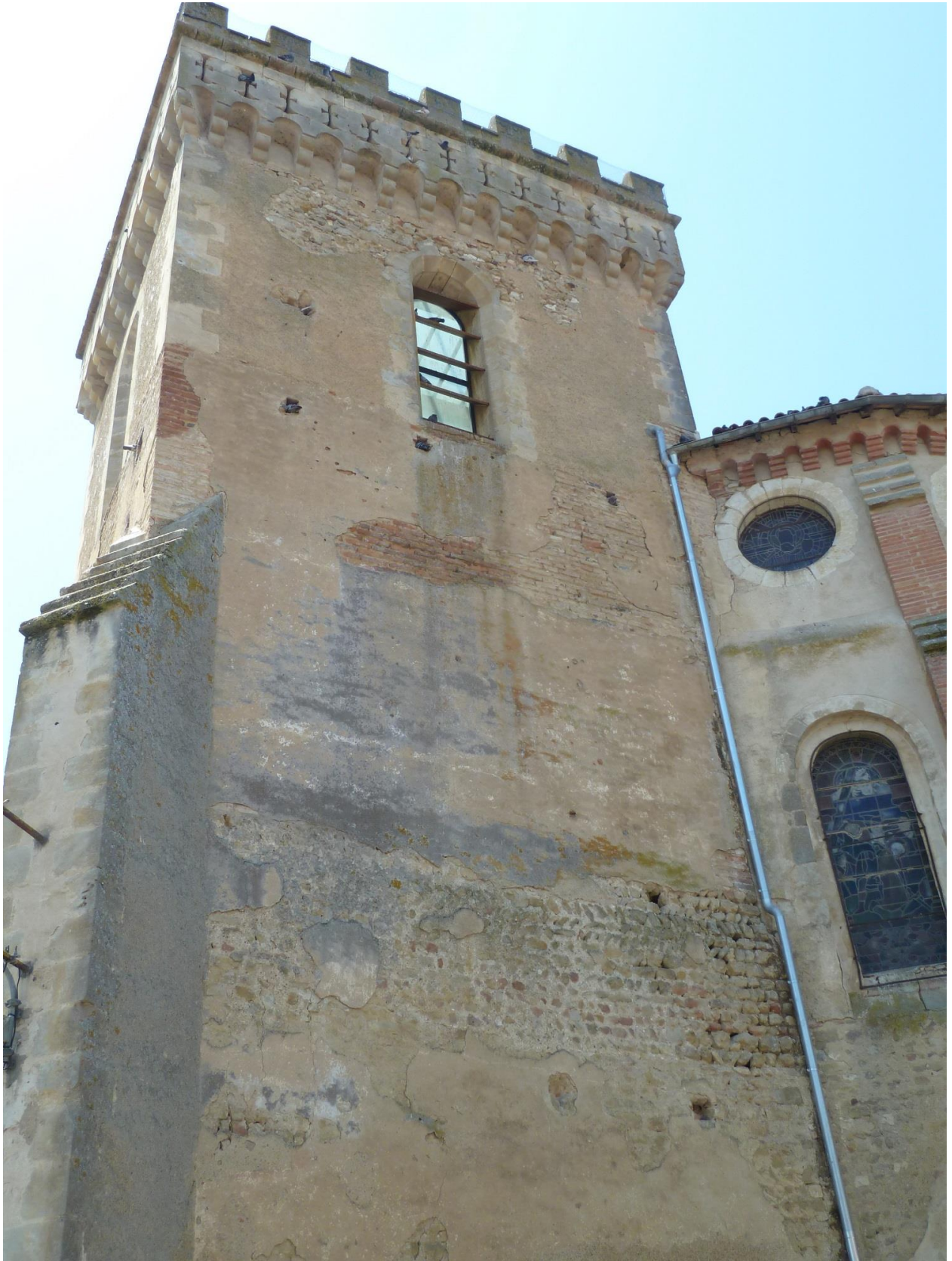
Fig. 30 : Saramon, église paroissiale, la tour Saint-Victor, vue d'ensemble de l'élévation extérieure nord.