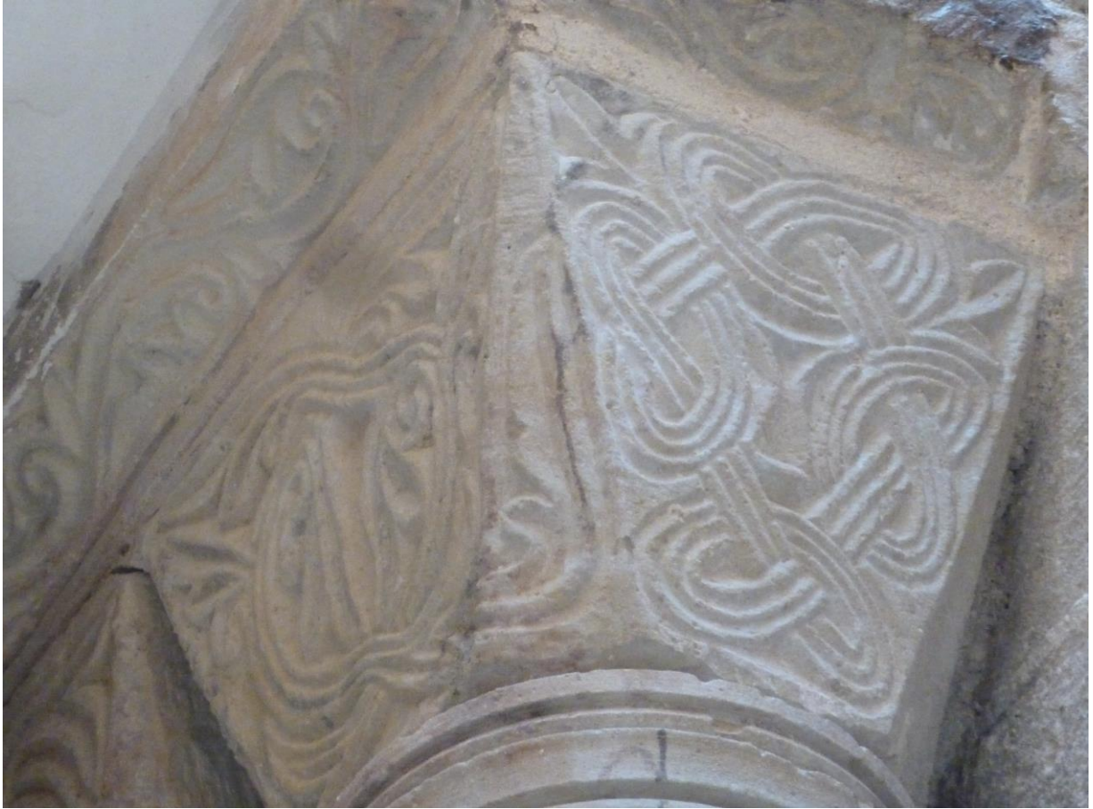
Fig. 52 : Saramon, église paroissiale, tour Saint-Victor, le chapiteau nord, situé côté tour.