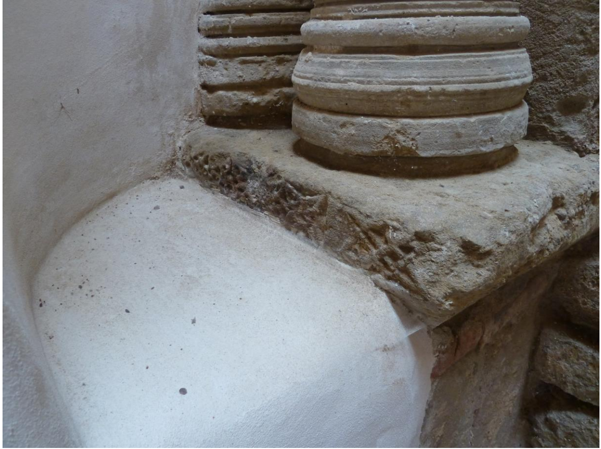
Fig. 56 : Saramon, église paroissiale, tour Saint-Victor, le socle situé sous les colonnes nord.