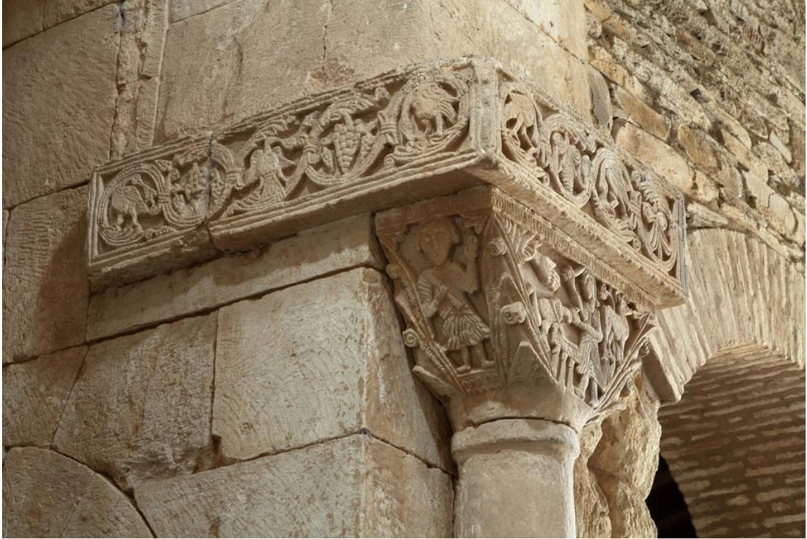
Fig. 48 : San Pedro de la Nave, vue intérieure, détail.