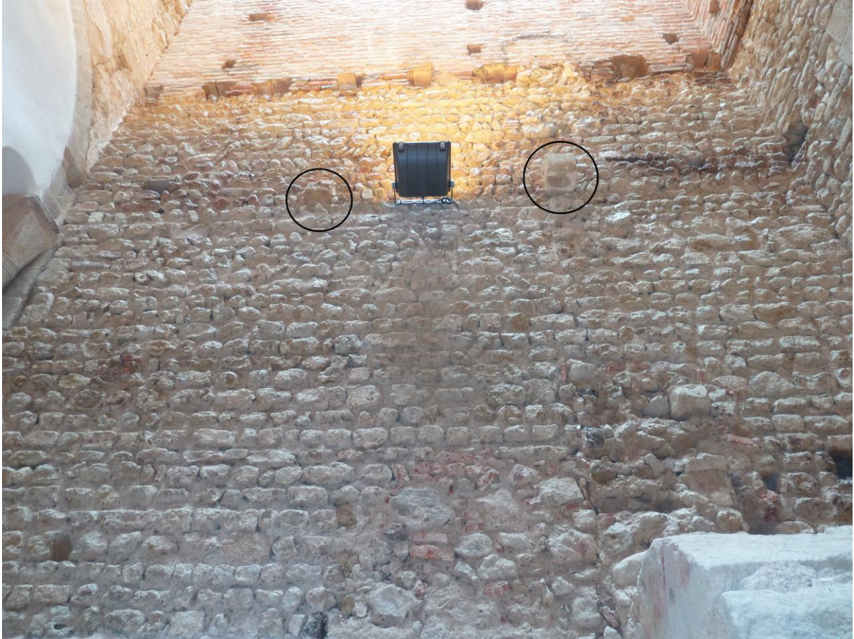
Fig. 68 : Saramon, église paroissiale, tour Saint-Victor, le mur nord, les deux corbeaux sont entourés en noir.