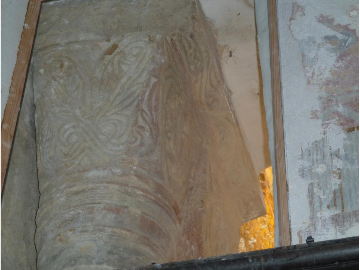
Fig. 43 : Saramon, église paroissiale, les chapiteaux de gauche de l'arc triomphal, côté abside, en juillet 2016.