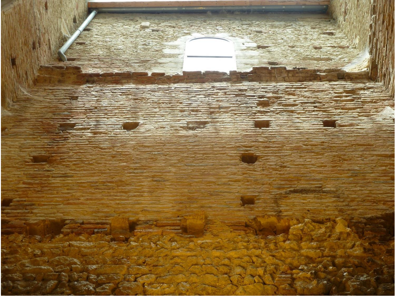
Fig. 34 : Saramon, église paroissiale, la tour Saint-Victor, vue intérieure du mur nord en juillet 2016.