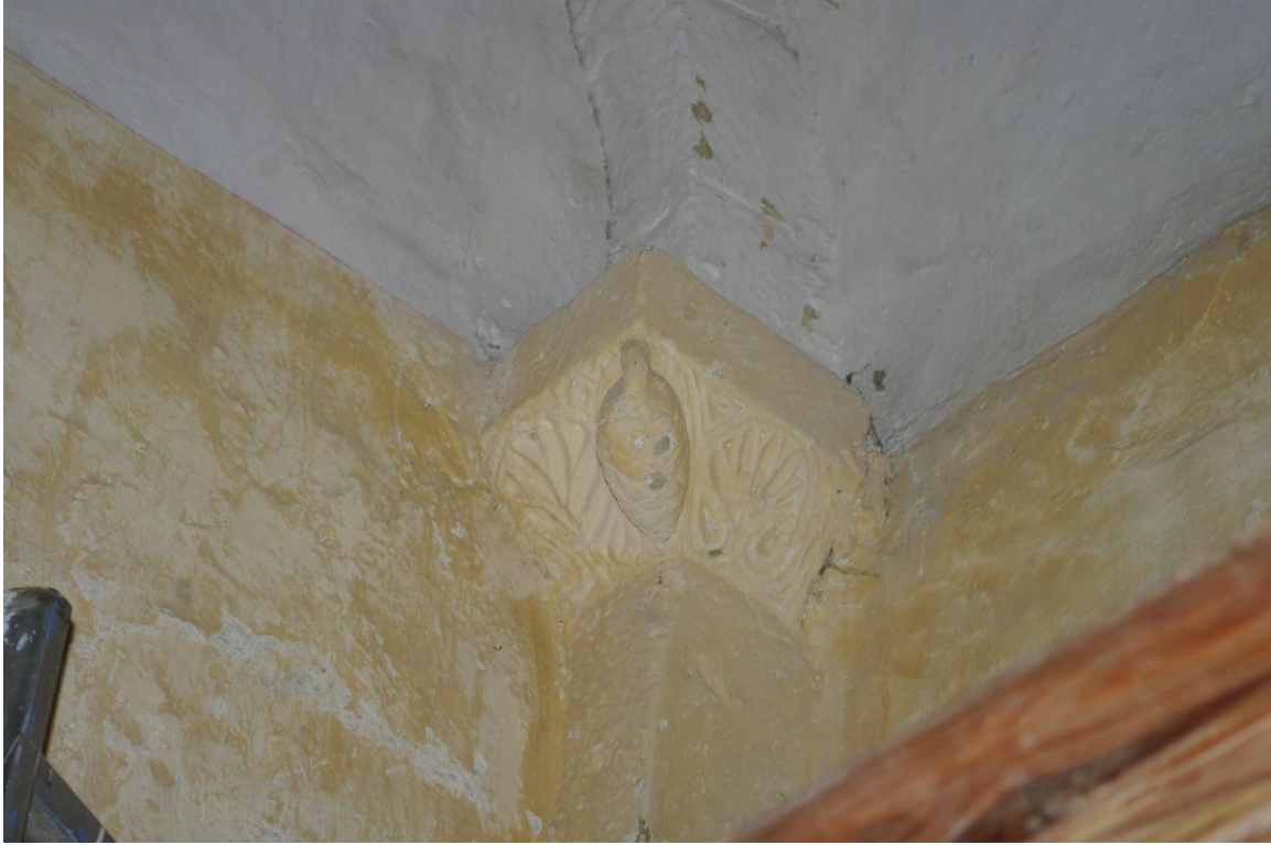
Fig. 17 : Saramon, église paroissiale, la chapelle extérieure nord, l'imposte de droite, détail.