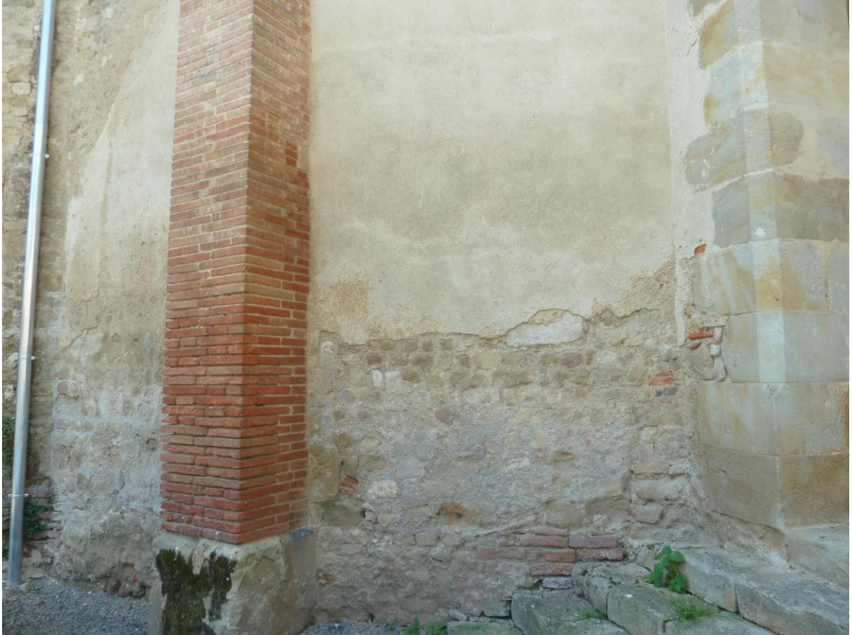
Fig. 24 : Saramon, église paroissiale, détail du mur de l'abside, côté nord-est.