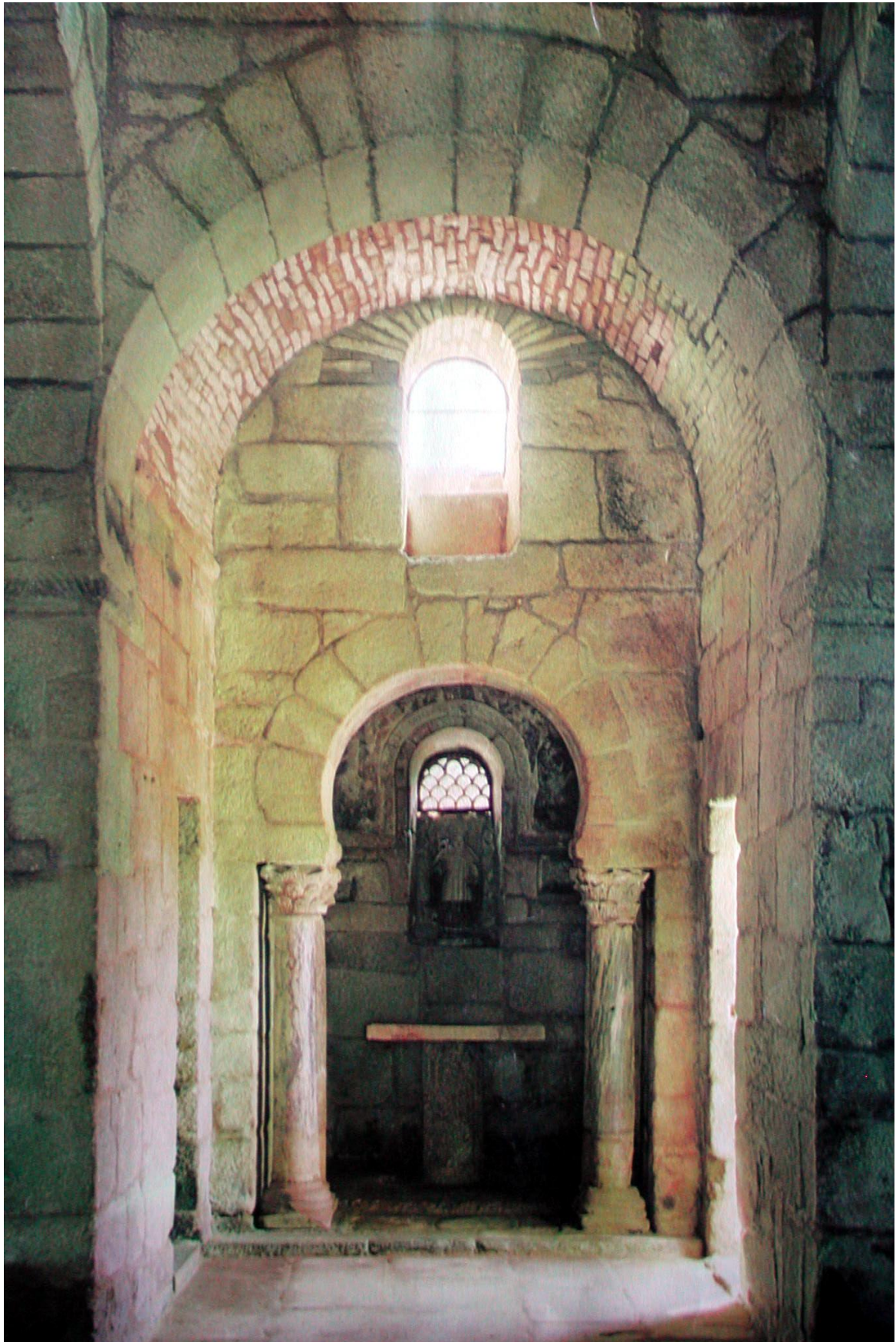
Fig. 47 : Santa Comba de Bande, vue intérieure vers l'est.