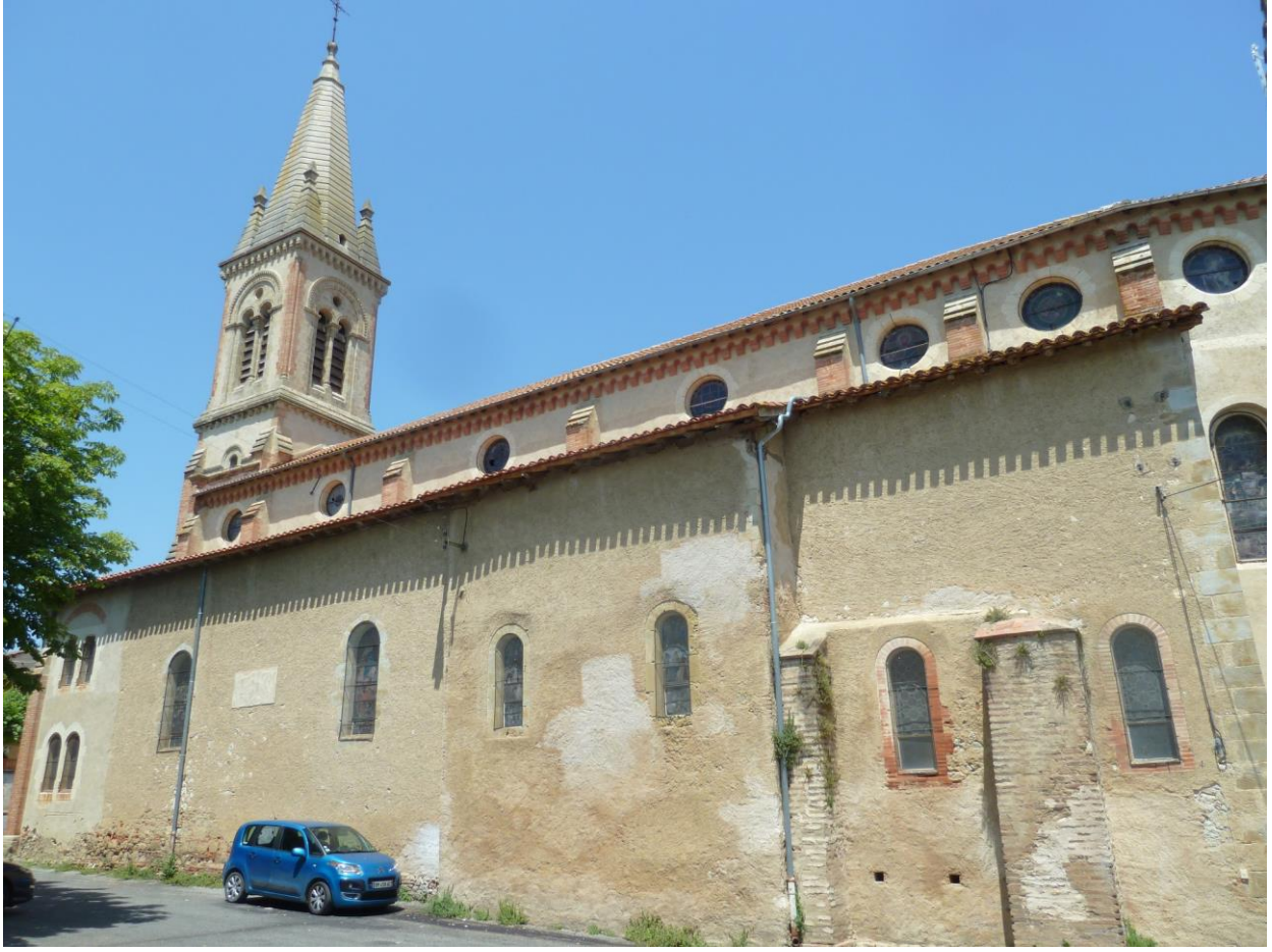
Fig. 7 : Saramon, église paroissiale, élévation sud.