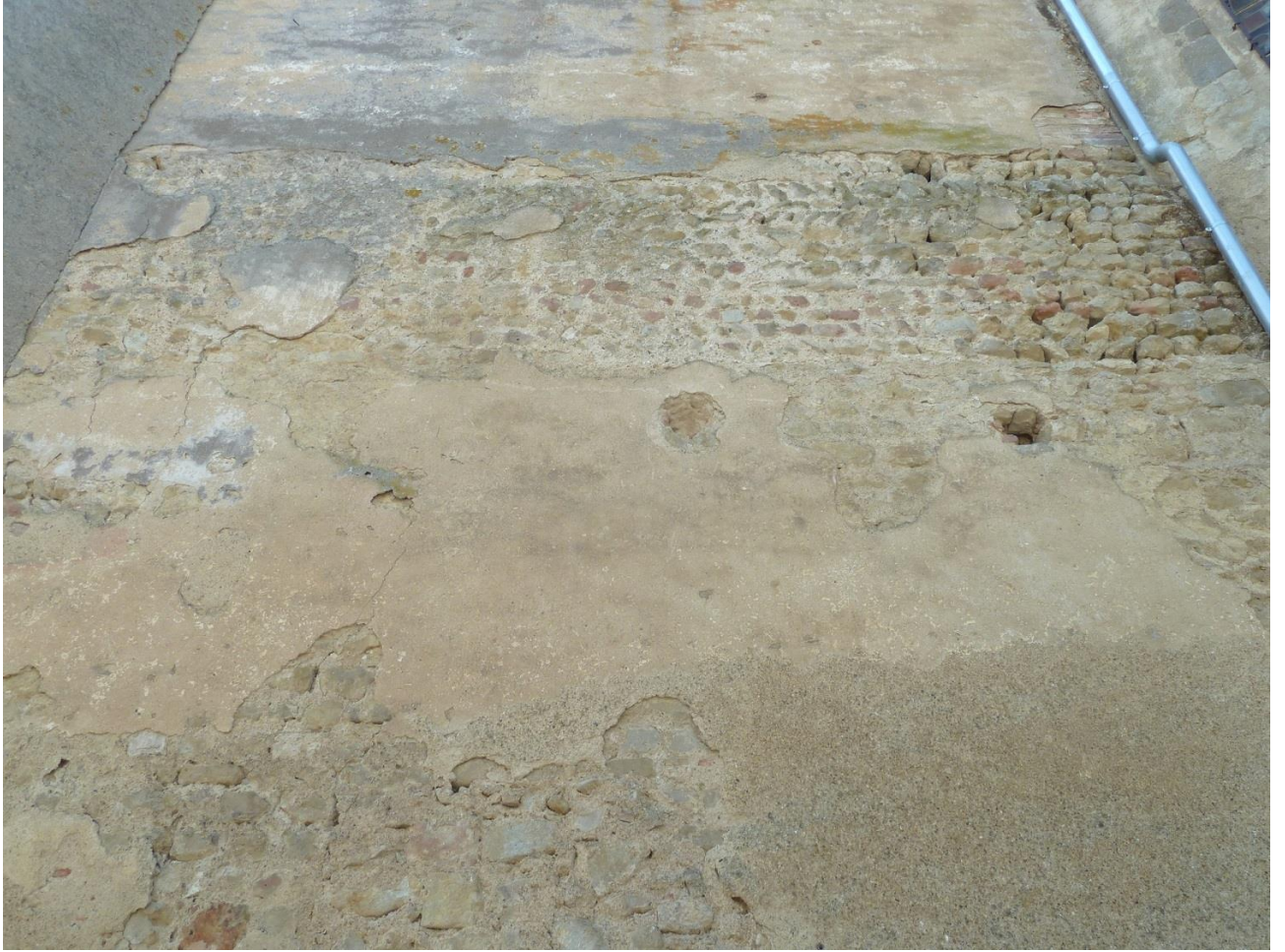
Fig. 31 : Saramon, église paroissiale, la tour Saint-Victor, élévation extérieure nord, détail.