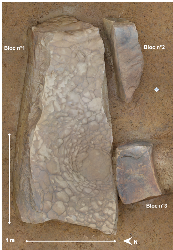
Fig. 2 – Projection orthogonale du modèle photogrammétrique du dépôt de trois blocs (la principale face décorée de la stèle anthropomorphe est contre terre, seule la face 1 est visible) (photogrammétrie : R. Jallot, D. Couturier, C. Seng).

constitué un critère de sélection important pour les néolithiques. Un réseau de cupules naturelles mais volontairement accentuées a rapidement été mis en évidence sur la face visible (face 1) lors de la fouille. Mais sa position, la principale face gravée contre terre, a d'abord empêché son identification comme stèle anthropomorphe. Ce n'est en effet qu'en février 2019 que l'un d'entre nous (JMM, sollicité par RJ) remarqua des gravures piquetées sur l'une des faces d'affleurement (3, non visible pendant la fouille) (fig. 3). Au terme d'un examen sous lumière rasante artificielle, plusieurs nouveaux éléments de décor ont ainsi pu être décrits. D'abord, le quart inférieur de la face ici concernée présente une météorisation superficielle différentielle très nette par rapport au deux autres tiers supérieur de la hauteur, et semble attester d'une limite d'enfouissement ayant d'avantage préservé la surface basale de ladite face. Toute cette zone, d'environ 50 cm de haut, est également marquée par une multitude de stries et de « griffures » subverticales. À un peu moins d'un mètre de la base, une ligne piquetée irrégulière parcourt la face sur toute sa largeur ou presque. Juste au-dessus, deux autres lignes de même facture suivent un tracé identique. L'ensemble forme deux bandes juxtaposées et légèrement sinueuses, longues de 88 cm et larges de 3 cm chacune – du moins dans la moitié droite, qui est la plus régulière. Les cupules sont peu profondes et assez altérées. Il est