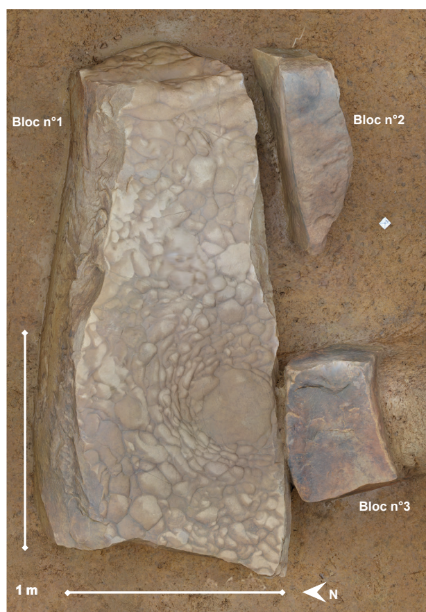
Fig. 2 – Projection orthogonale du modèle photogrammétrique du dépôt de trois blocs (la principale face décorée de la stèle anthropomorphe est contre terre, seule la face 1 est visible).

constitué un critère de sélection important pour les néolithiques. Un réseau de cupules naturelles mais volontairement accentuées a rapidement été mis en évidence sur la face visible (face 1) lors de la fouille. Mais sa position, la principale face gravée contre terre, a d'abord empêché son identification comme stèle anthropomorphe. Ce n'est en effet qu'en février 2019 que l'un d'entre nous (JMM, sollicité par RJ) remarqua des gravures piquetées sur l'une des faces d'affleurement (3, non visible pendant la fouille) (fig. 3). Au terme d'un examen sous lumière rasante artificielle, plusieurs nouveaux éléments de décor ont ainsi pu être décrits. D'abord, le quart inférieur de la face ici concernée présente une météorisation superficielle différentielle très nette par rapport au deux autres tiers supérieur de la hauteur, et semble attester d'une limite d'enfouissement ayant d'avantage préservé la surface basale de ladite face. Toute cette zone, d'environ 50 cm de haut, est également marquée par une multitude de stries et de « griffures » subverticales. À un peu moins d'un mètre de la base, une ligne piquetée irrégulière parcourt la face sur toute sa largeur ou presque. Juste au-dessus, deux autres lignes de même facture suivent un tracé identique. L'ensemble forme deux bandes juxtaposées et légèrement sinueuses, longues de 88 cm et larges de 3 cm chacune – du moins dans la moitié droite, qui est la plus régulière. Les cupules sont peu profondes et assez altérées. Il est