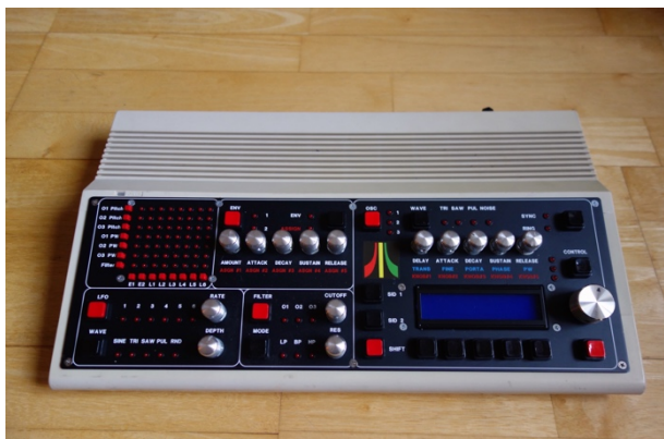
Figure 2 : MIDIbox SID synthesizer (Jahtari, 2014)

Nova 2014 pour plus de détails). À côté de ses activités de production, ce label allemand propose aux musiciens intéressés un synthétiseur spécialement dédié au reggae 8-bit. Il s'agit d'un appareil sommaire, monté à la demande exclusivement pour les amis et les proches et dont ils ont fixé le prix de vente à 1150 euros. Celui-ci est formé de deux blocs de synthèse sonore, munis d'une interface de contrôle (boutons, potentiomètres, indicateurs visuels) insérés dans une coque d'origine de Commodore C64. Chacun des blocs synthétiseurs comprend quant à lui le microprocesseur sonore d'un ancien C64, le "SID" (Sound Interface Device) qui permet de générer les sons si particuliers et identifiables du jeu vidéo des années 1980. Or, ni cet ordinateur, ni ce composant ne sont encore fabriqués actuellement – malgré l'existence de copies de mauvaise qualité – ce qui implique donc de surveiller les plateformes de vente en ligne d'objets de seconde-main, d'acheter régulièrement des C64 pour en extraire les microprocesseurs sonores, et récupérer les coques en plastique. Lesquels éléments sont réutilisés ensuite, hybridés avec des composants plus récents pour produire la MIDIbox SID synthétiseur.