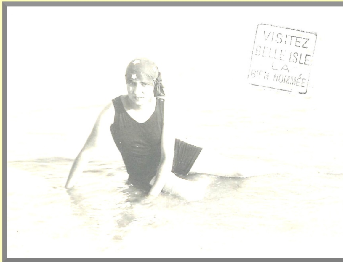
Carte postale et flamme d'oblitération.

La reproduction ou représentation de cet article, notamment par photocopie, n'est autorisée que dans un strict cadre pédagogique, après autorisation sollicitée auprès de l'association En Envör , l'histoire contemporaine en Bretagne. En conséquence, et conformément aux dispositions du code de la propriété intellectuelle, seule est permise l'utilisation pour un usage privé sous réserve de dispositions différentes, voire plus restrictives, du code de la propriété intellectuelle. Il est cependant interdit à l'utilisateur, en dehors de cet usage, de copier, modifier, distribuer, transmettre, diffuser, représenter, reproduire, publier, concéder sous forme de licence, transférer ou exploiter de toute autre manière les informations présentes sur le site enenvor.fr . Dès lors, toute autre utilisation est constitutive de contrefaçon et sanctionnable au titre de la propriété intellectuelle, sauf autorisation préalable et écrite de l'auteur ainsi que de l'association En Envör , l'histoire contemporaine en Bretagne, société éditrice d' En Envör , revue d'histoire contemporaine en Bretagne.