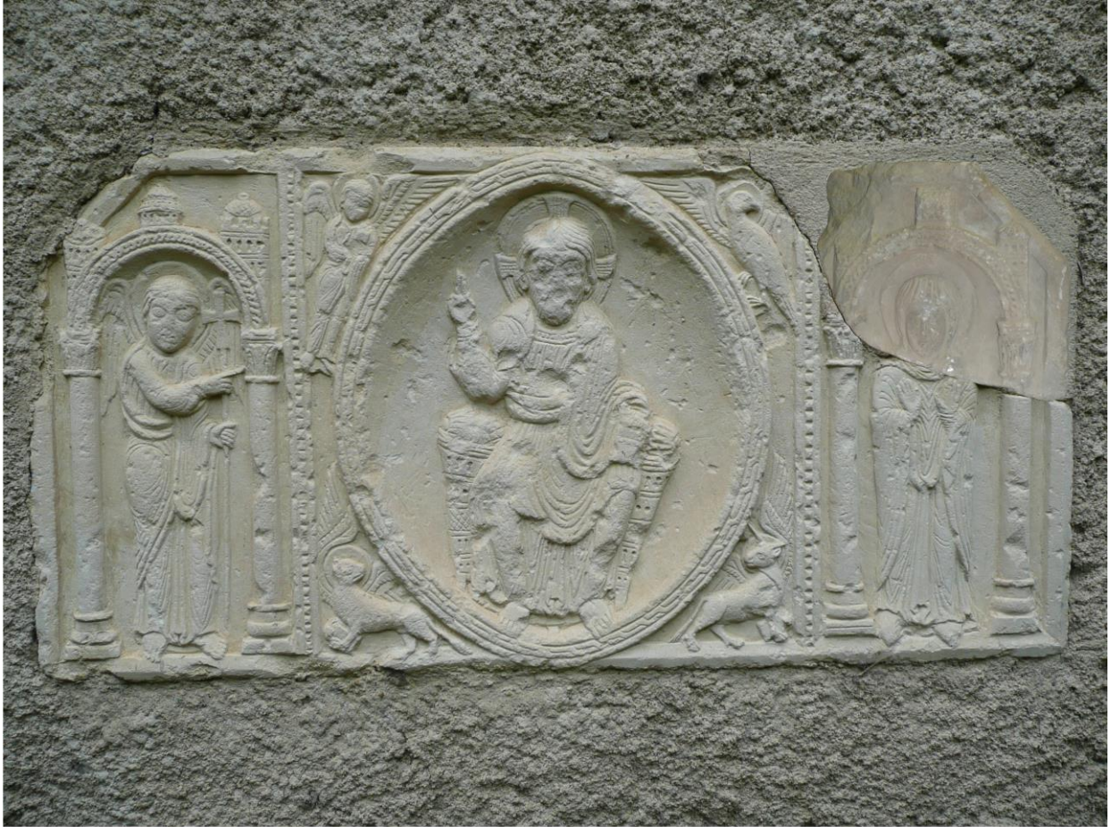
Fig. 20 : le retable de Saint-Orens d'Auch, montage restituant l'état primitif.