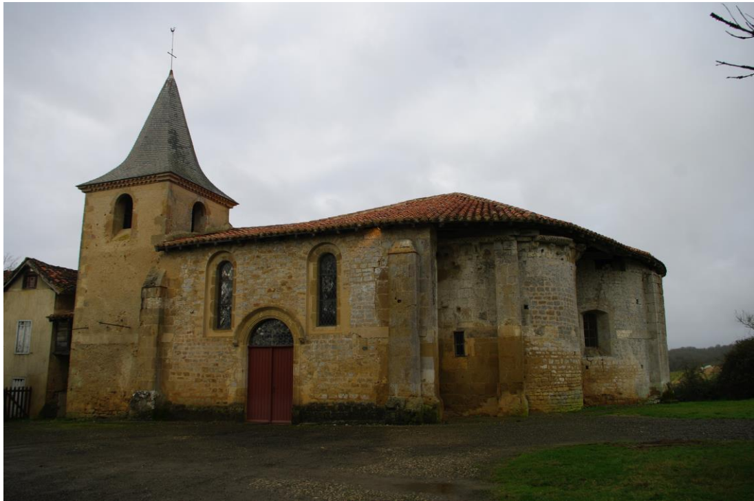
Fig. 12 : Lasserrade, église de Croute, vue depuis l'est.