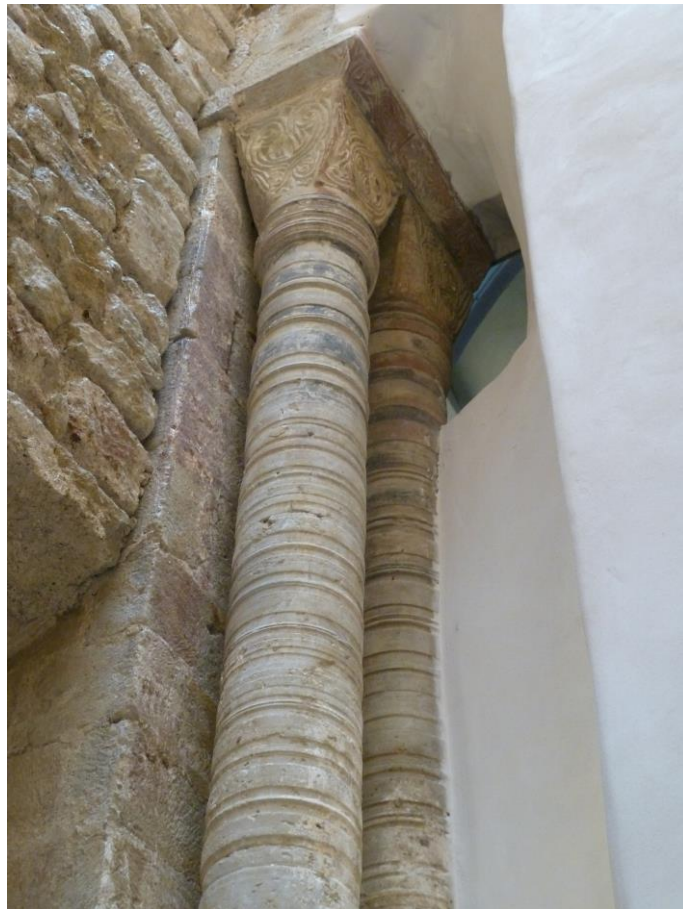
Fig. 11 : Saramon, ancienne abbatale, la tour Saint-Victor, détail de l'élévation intérieure côté sud.