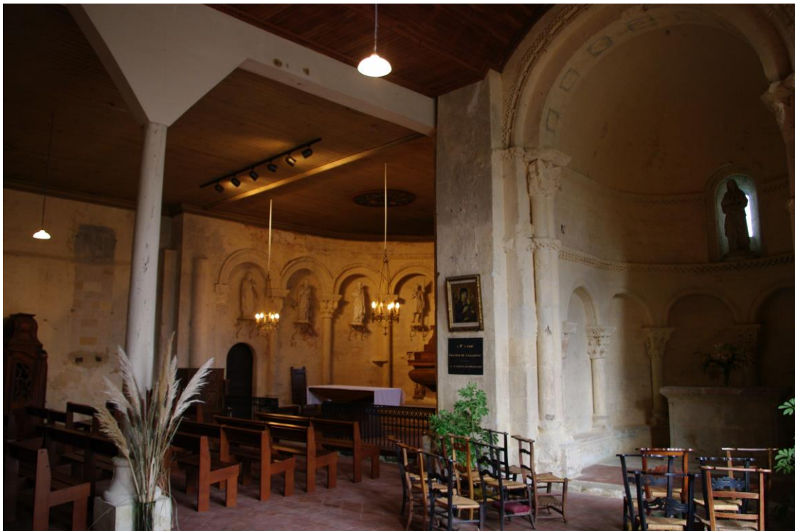
Fig. 13 : Lasserrade, église de Croute, vue intérieure.