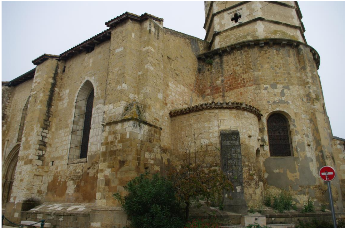
Fig. 18 : Vic-Fezensac, église Saint-Pierre, l'église vue du sud-est.