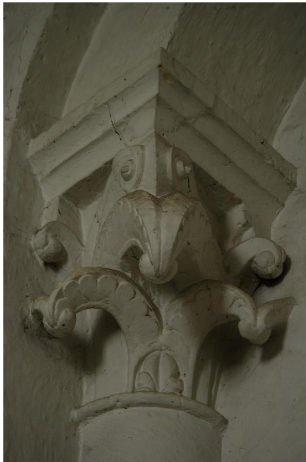
Fig. 19 : Vic-Fezensac, église Saint-Pierre, sacristie nord, le chapiteau sud.