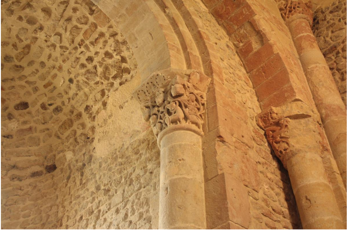
Fig. 5 : Saint-Mont, église Saint-Jean-Baptiste, absidiole sud, détail.