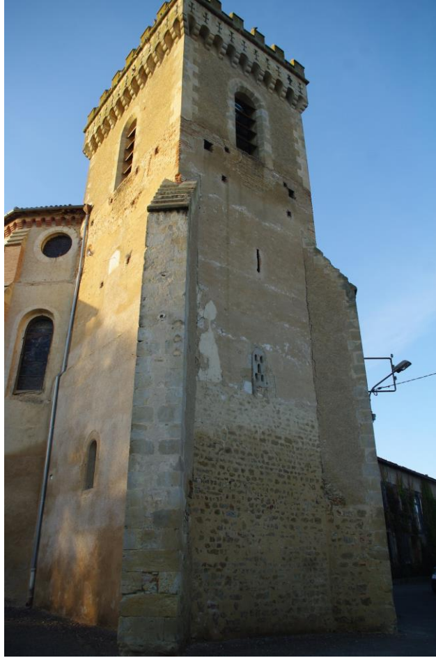
Fig. 3 : Saramon, ancienne abbatale, le chevet.