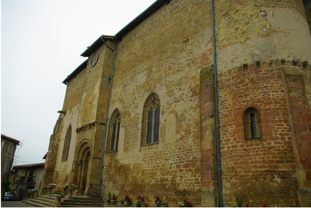
Fig. 16 : Aignan, église Saint-Laurent, l'édifice vu depuis le sud-est.