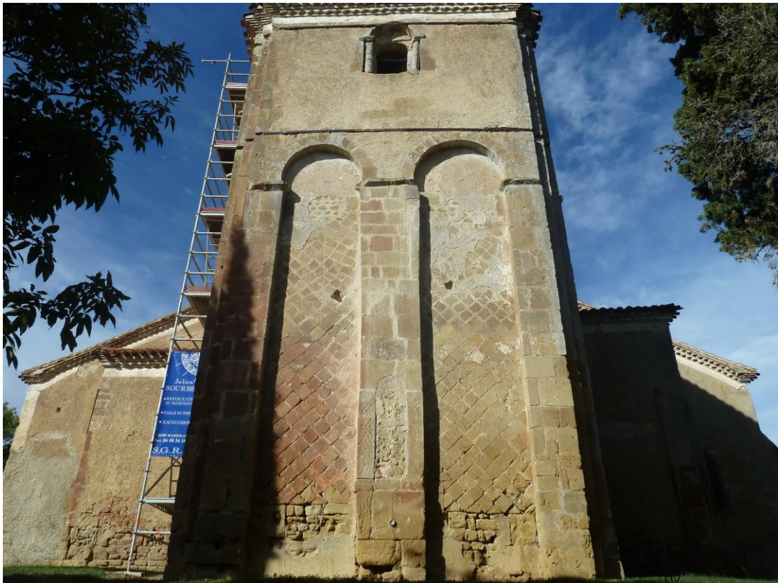
Fig. 2 : Peyrusse-Grande, église Saint-Mamet, le chevet.