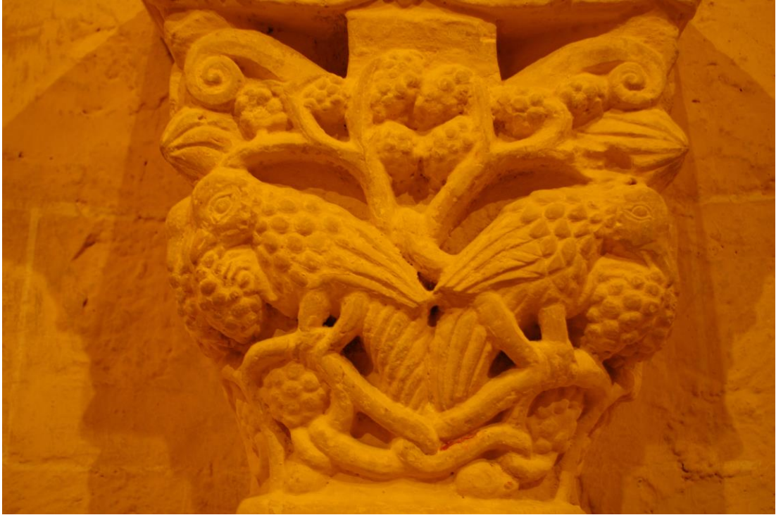
Fig. 14 : Lasserrade, église de Croute, l'un des chapiteaux de l'absidiole est.