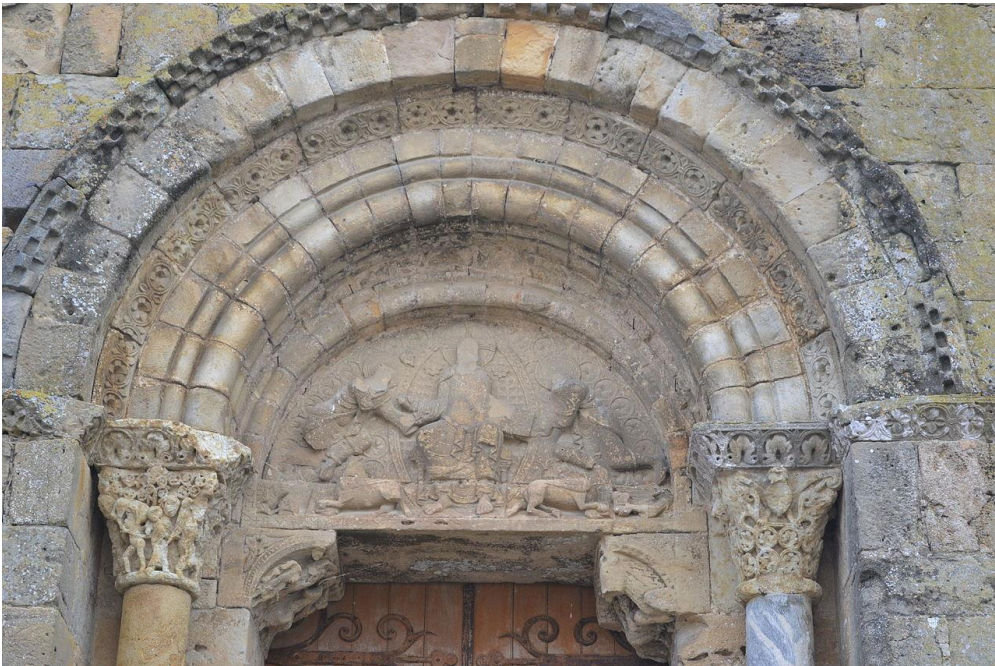
Fig. 4 : Tasque, église Saint-Pierre, le portail occidental.