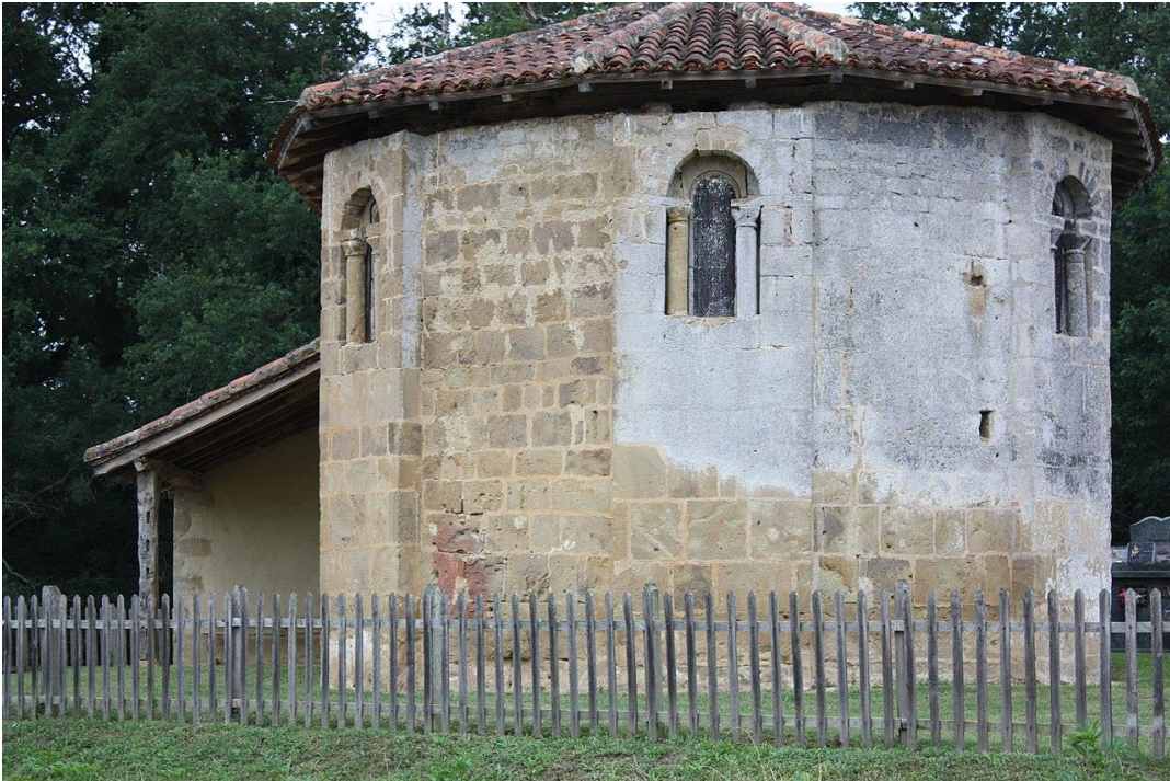
Fig. 1 : Belloc-Saint-Clamens, église Saint-Clamens, le chevet.