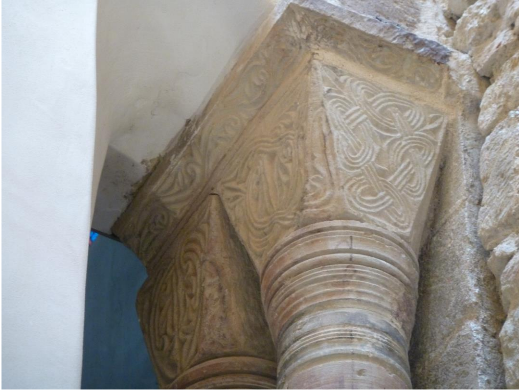
Fig. 10 : Saramon, ancienne abbatale, la tour Saint-Victor, les deux chapiteaux situés côté nord.