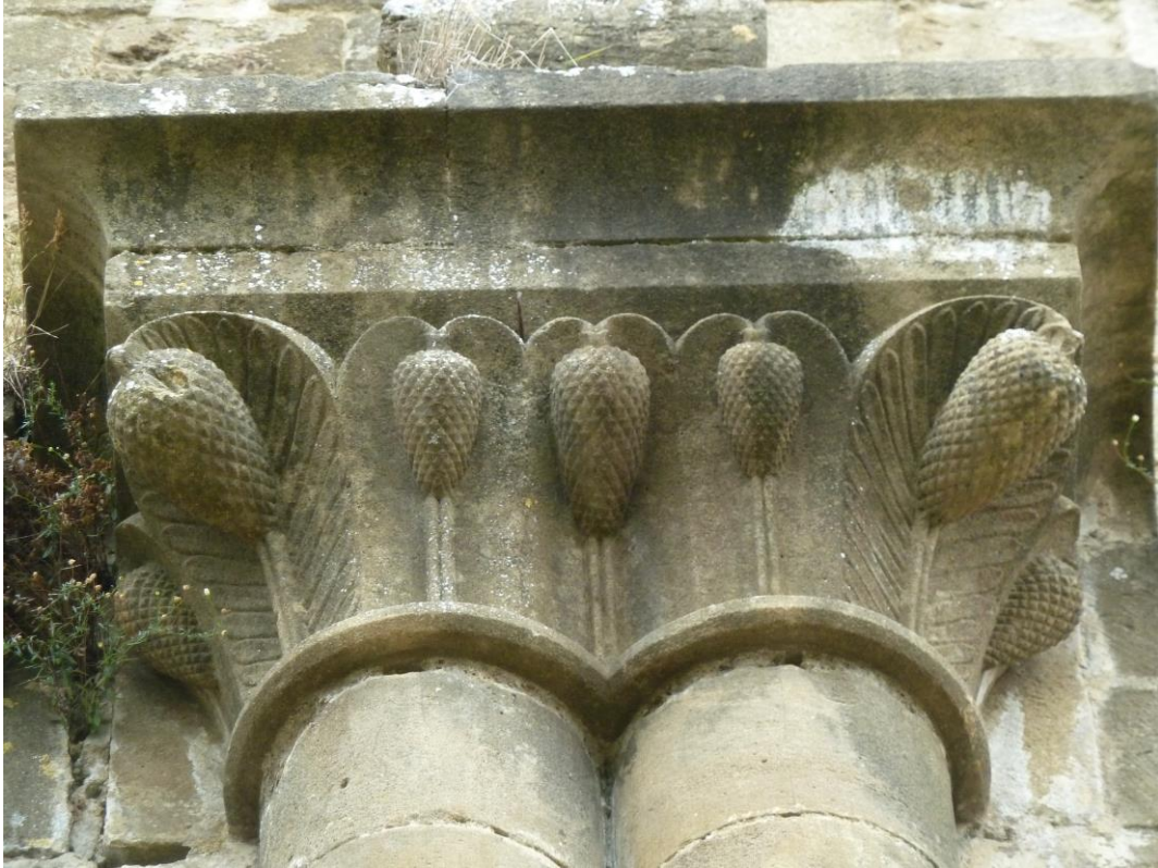
Fig. 7 : Marciac, église paroissiale, chapiteau double provenant de la Case-Dieu.