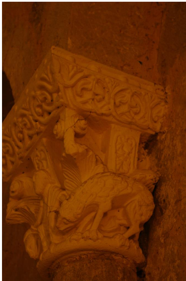
Fig. 17 : Aignan, église Saint-Laurent, abside d'axe, Daniel entre les lions .