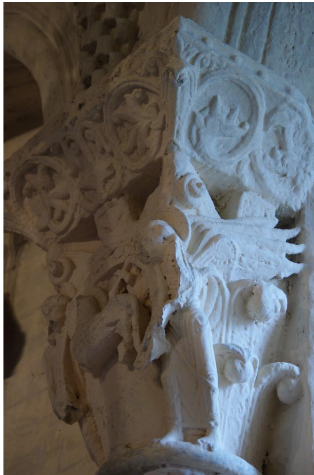
Fig. 15 : Lasserrade, église de Croute, abside, le chapiteau axiale de l'arcature.