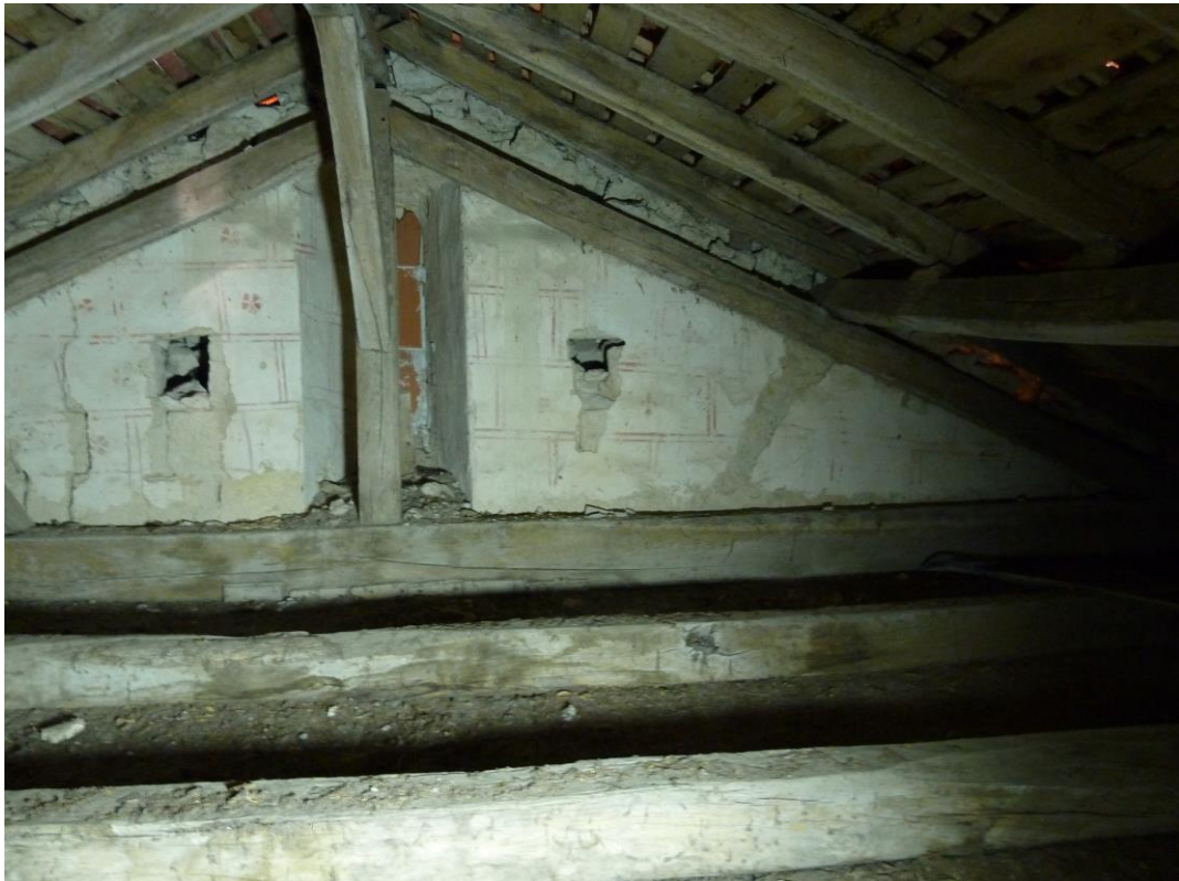
Fig. 6 : Larroque-sur-l'Osse, église de Heux, la fenêtre supérieure orientale aujourd'hui dans les combles.