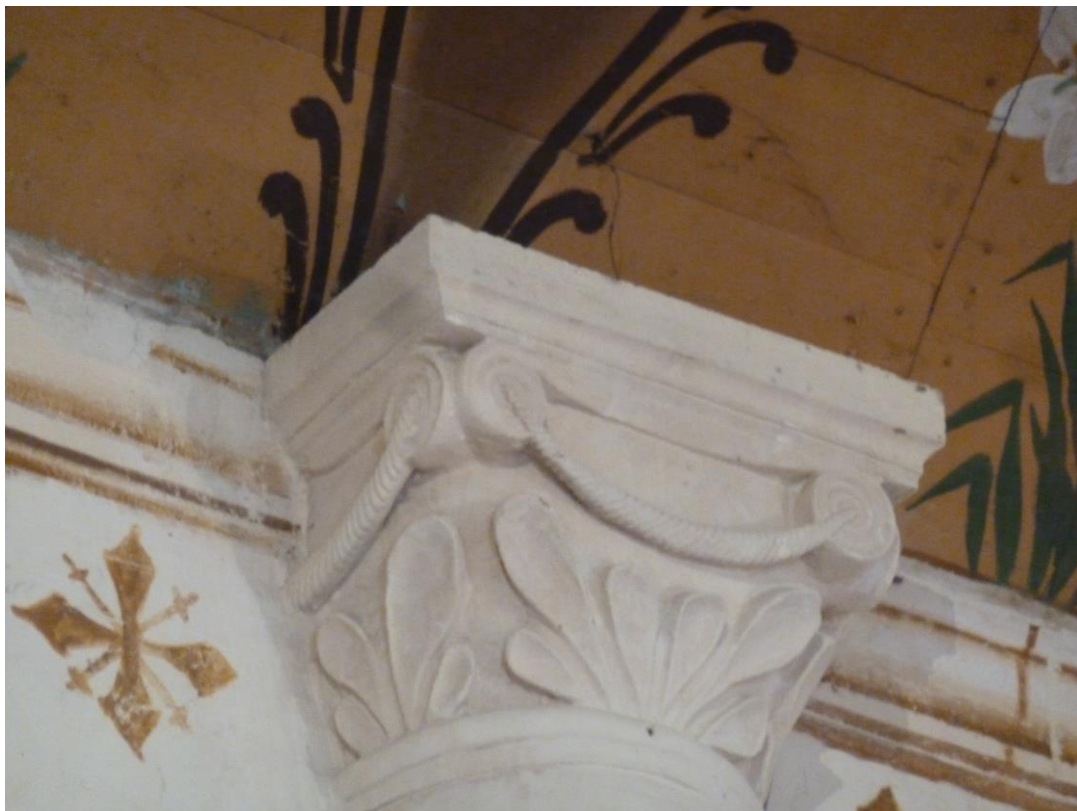
Fig. 7 : Larroque-sur-l'Osse, église de Heux, le chapiteau nord-ouest.