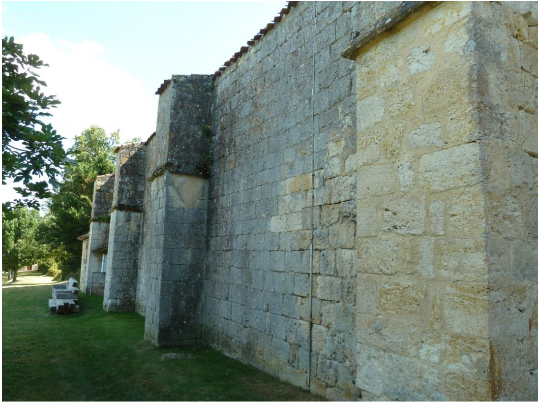
Fig. 3 : Larroque-sur-l'Osse, église de Heux, élévation nord, depuis l'angle nord-ouest.