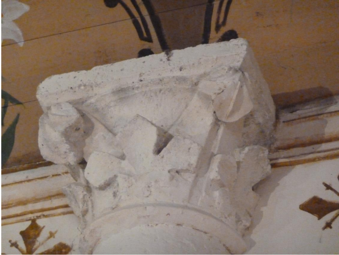
Fig. 8 : Larroque-sur-l'Osse, église de Heux, le chapiteau nord-est.