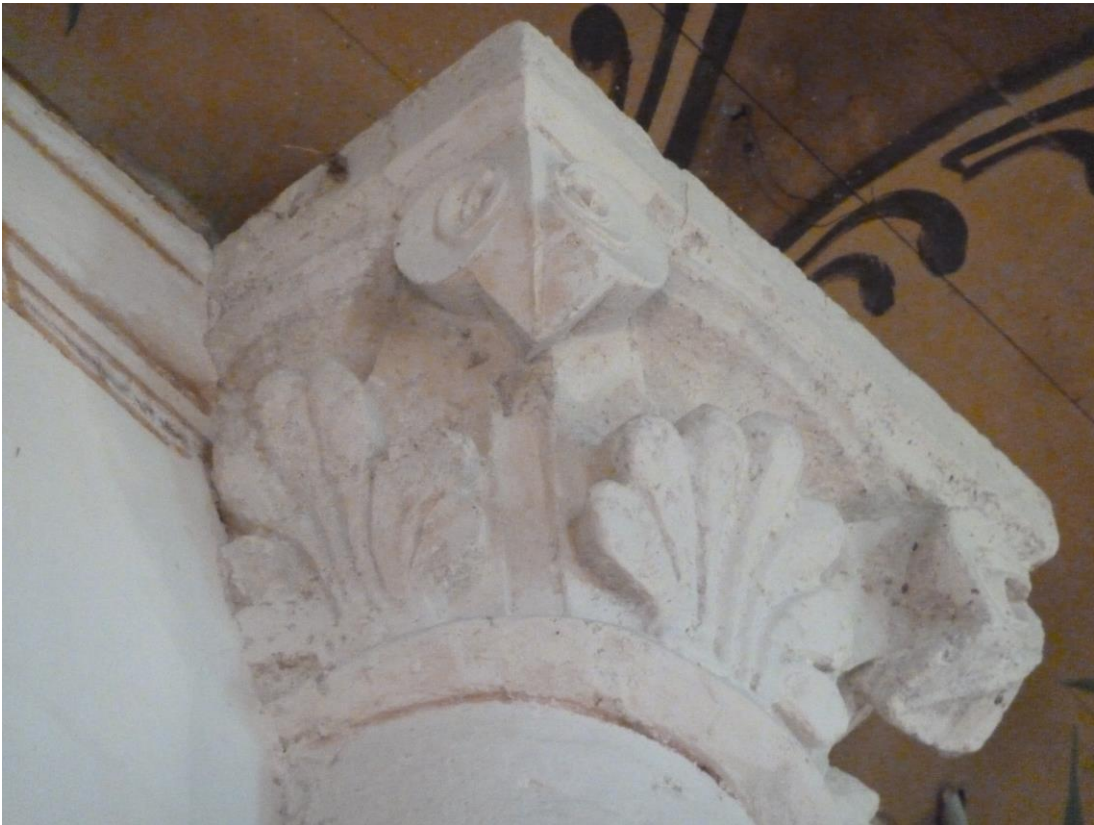
Fig. 9 : Larroque-sur-l'Osse, église de Heux, le chapiteau sud-est.