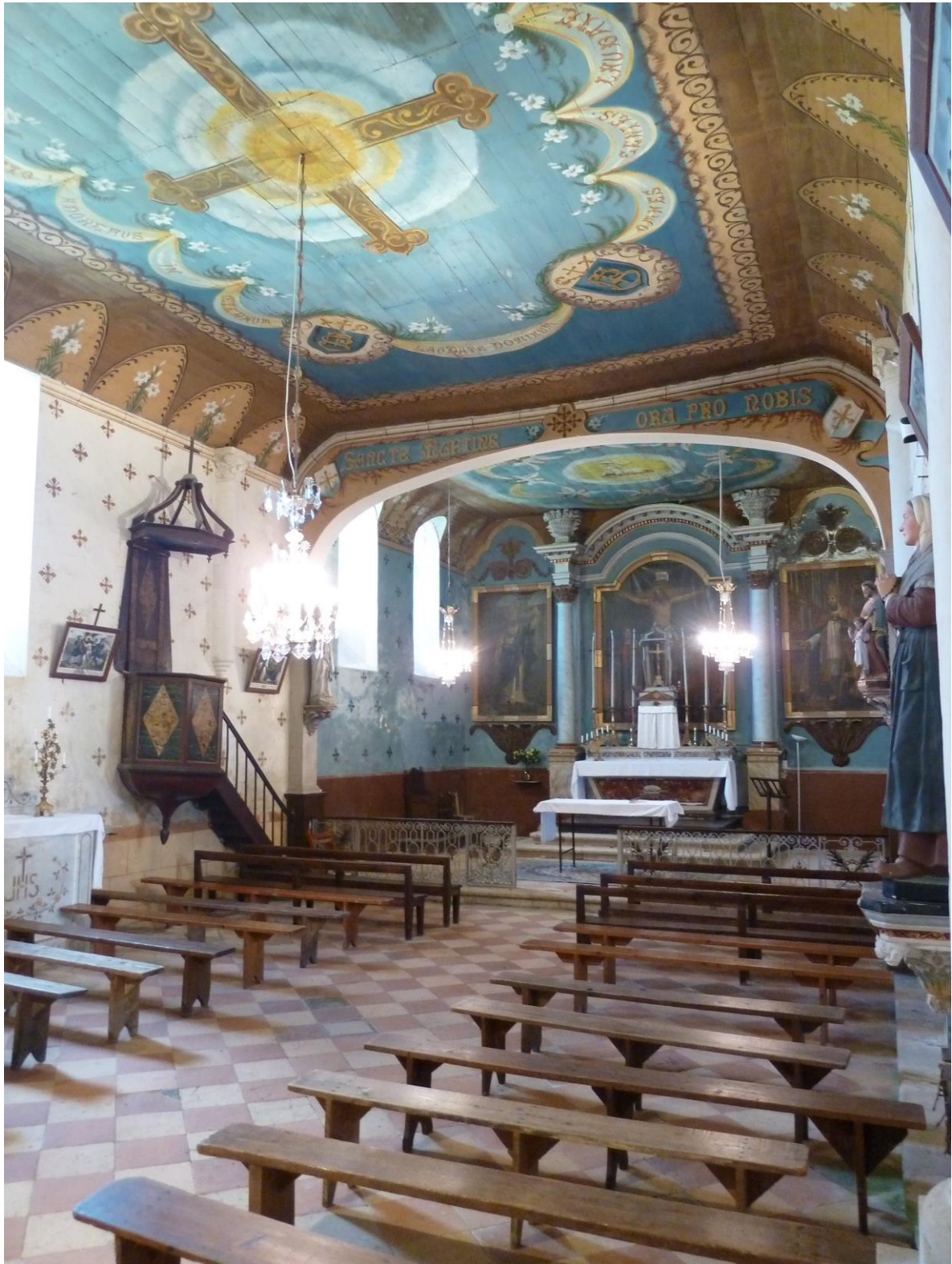
Fig. 5 : Larroque-sur-l'Osse, église de Heux, vue intérieure, vers l'est.