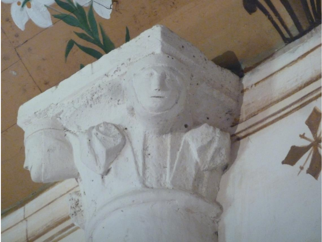
Fig. 10 : Larroque-sur-l'Osse, église de Heux, le chapiteau sud-ouest.