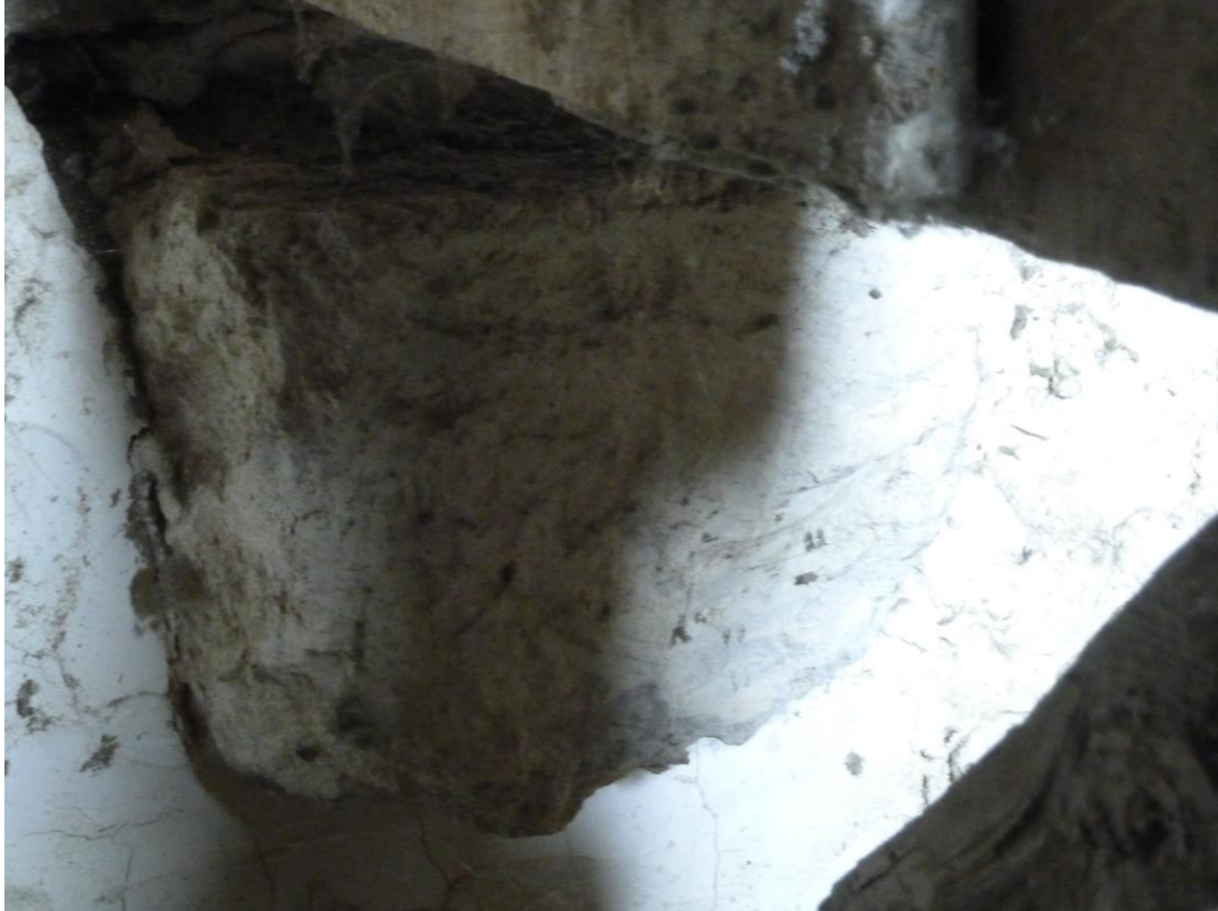
Fig. 12 : Larroque-sur-l'Osse, église de Heux, un 2 e chapiteau situé dans les combles ?