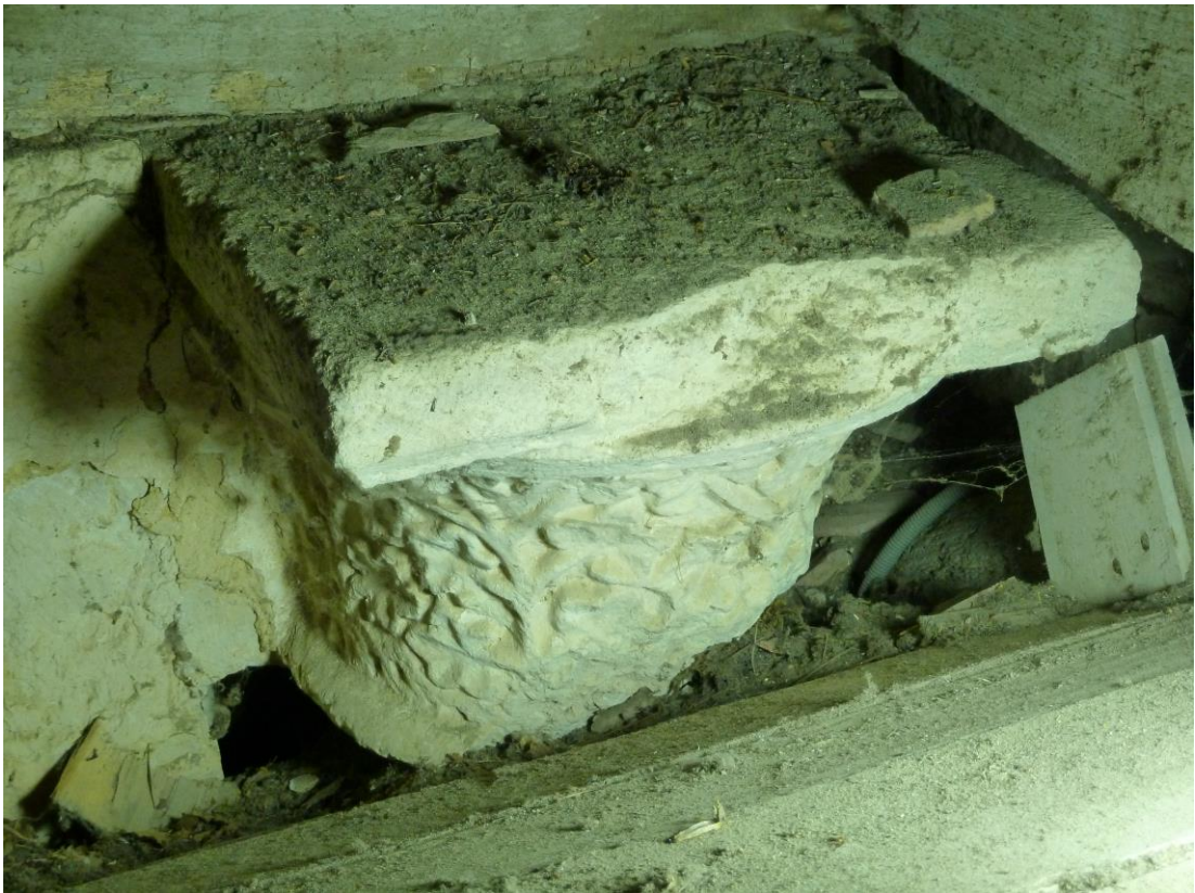
Fig. 11 : Larroque-sur-l'Osse, église de Heux, le chapiteau situé dans les combles.