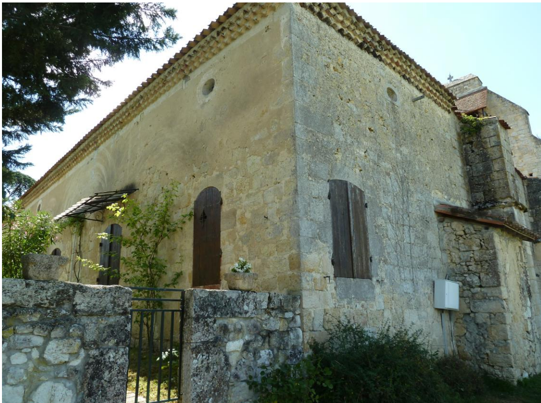
Fig. 2 : Larroque-sur-l'Osse, église de Heux, le presbytère vu depuis l'angle nord-est.