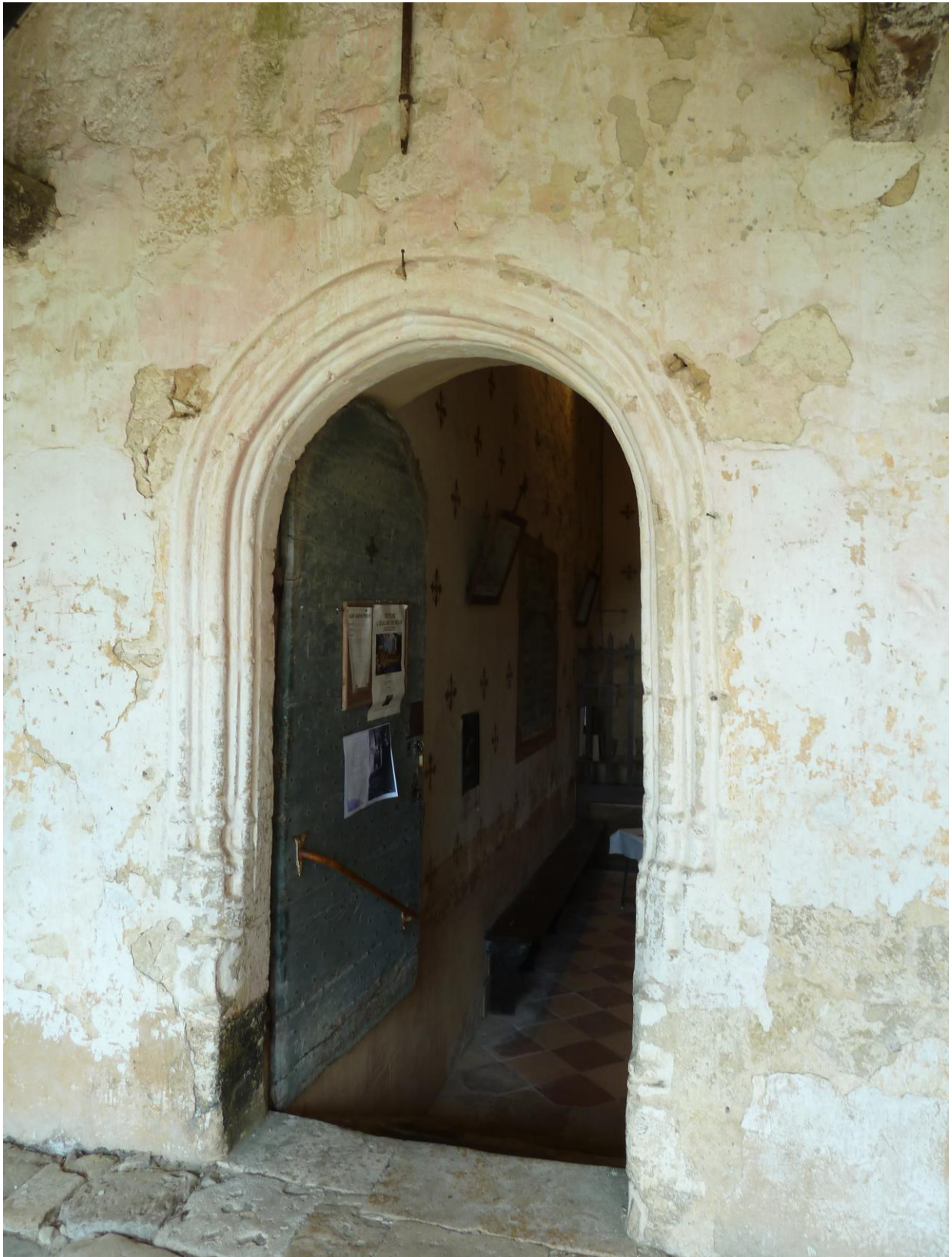
Fig. 4 : Larroque-sur-l'Osse, église de Heux, le portail d'accès à l'église.