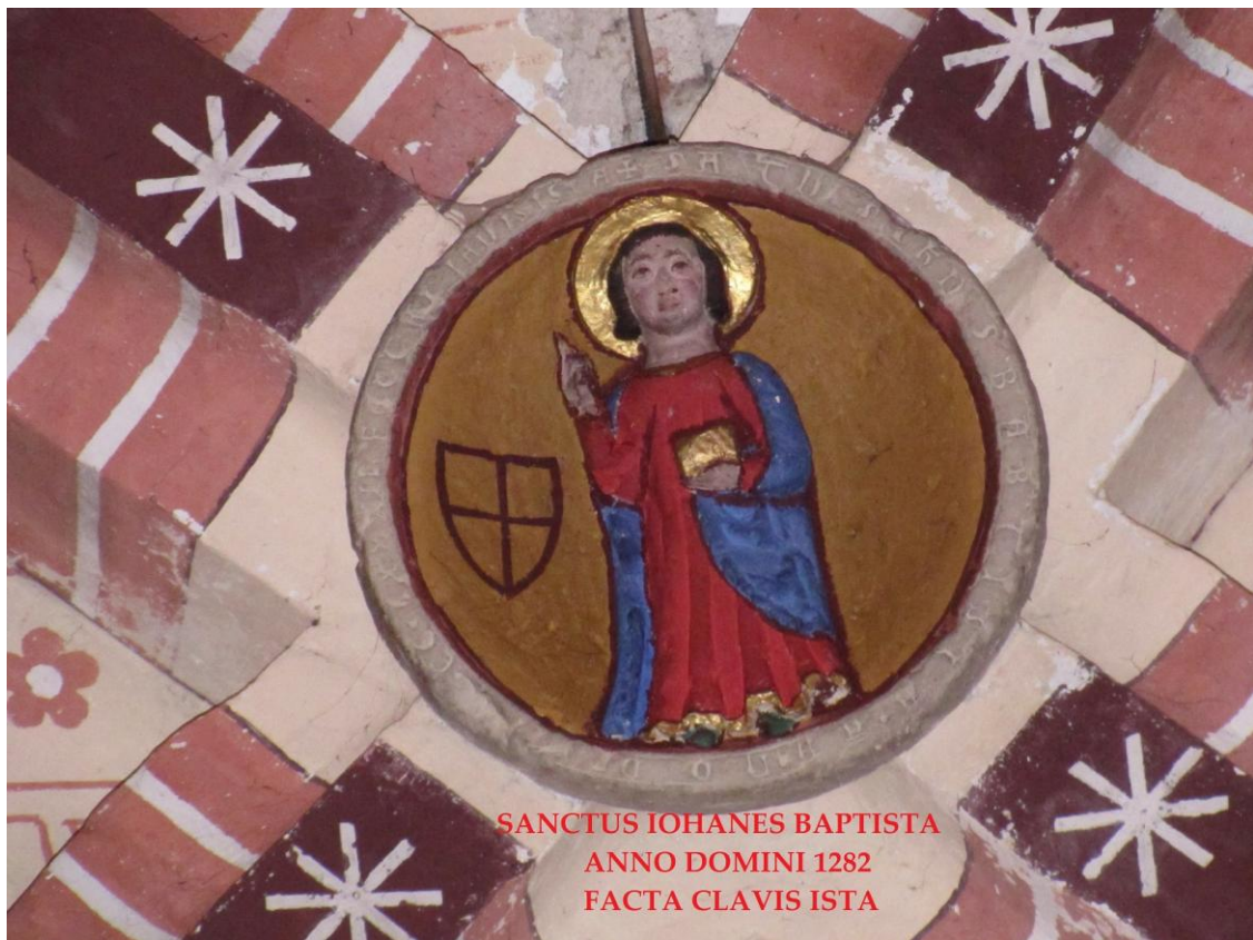
Fig. 17 : Poucharramet, église paroissiale, la clef de voûte centrale.