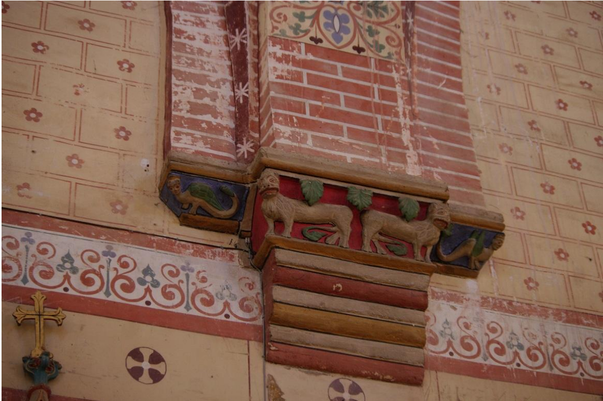
Fig. 6 : Poucharramet, église paroissiale, premier doubleau côté sud, détail des retombées.