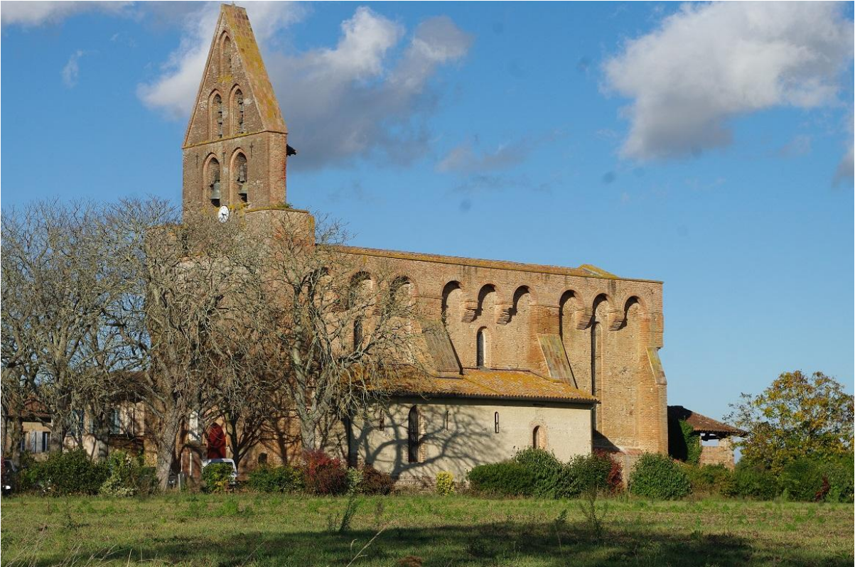
Fig. 1 : Poucharramet, l'église paroissiale vue depuis le sud-ouest.