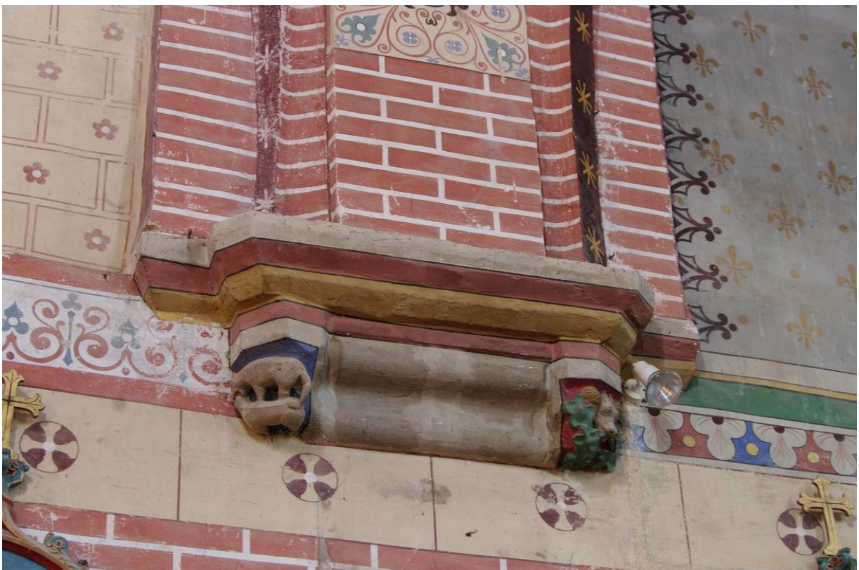
Fig. 7 : Poucharramet, église paroissiale, second doubleau côté nord, détail des retombées.