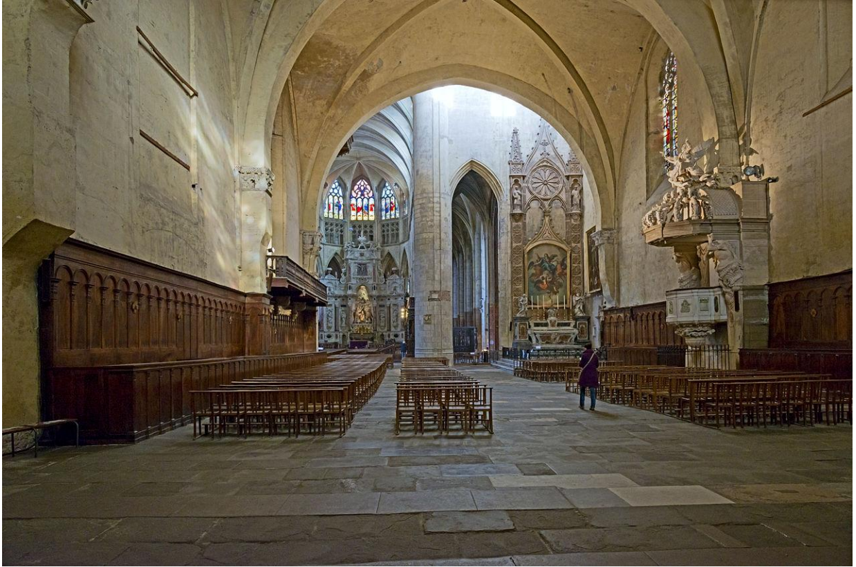
Fig. 3 : Toulouse, cathédrale Saint-Etienne, vue intérieure de l'église en direction de l'est.