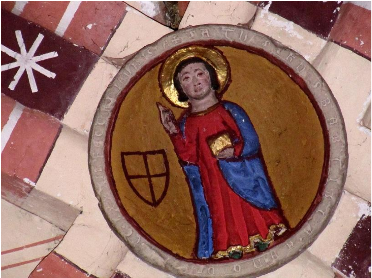
Fig. 15 : Poucharramet, église paroissiale, la clef de voûte centrale.