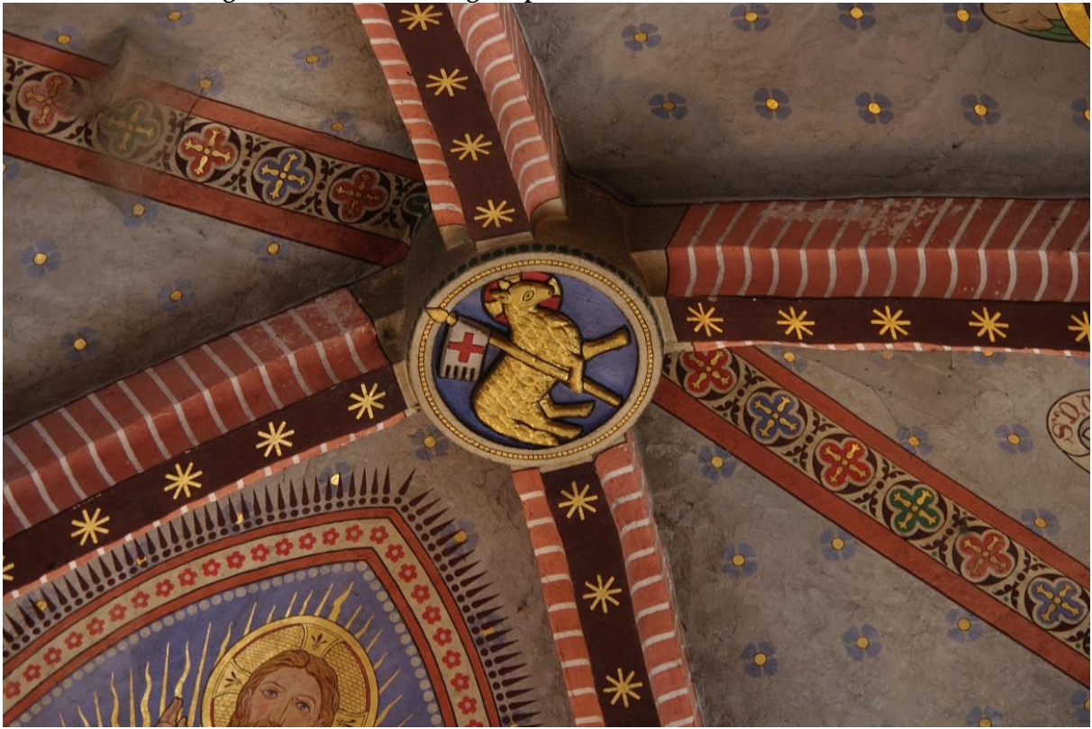
Fig. 14 : Poucharramet, église paroissiale, la clef de voûte est.