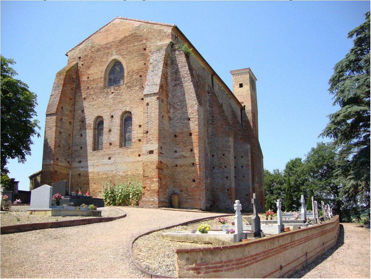
Fig. 10 : Saint-Christaud, église paroissiale, vue d'ensemble depuis l'est.