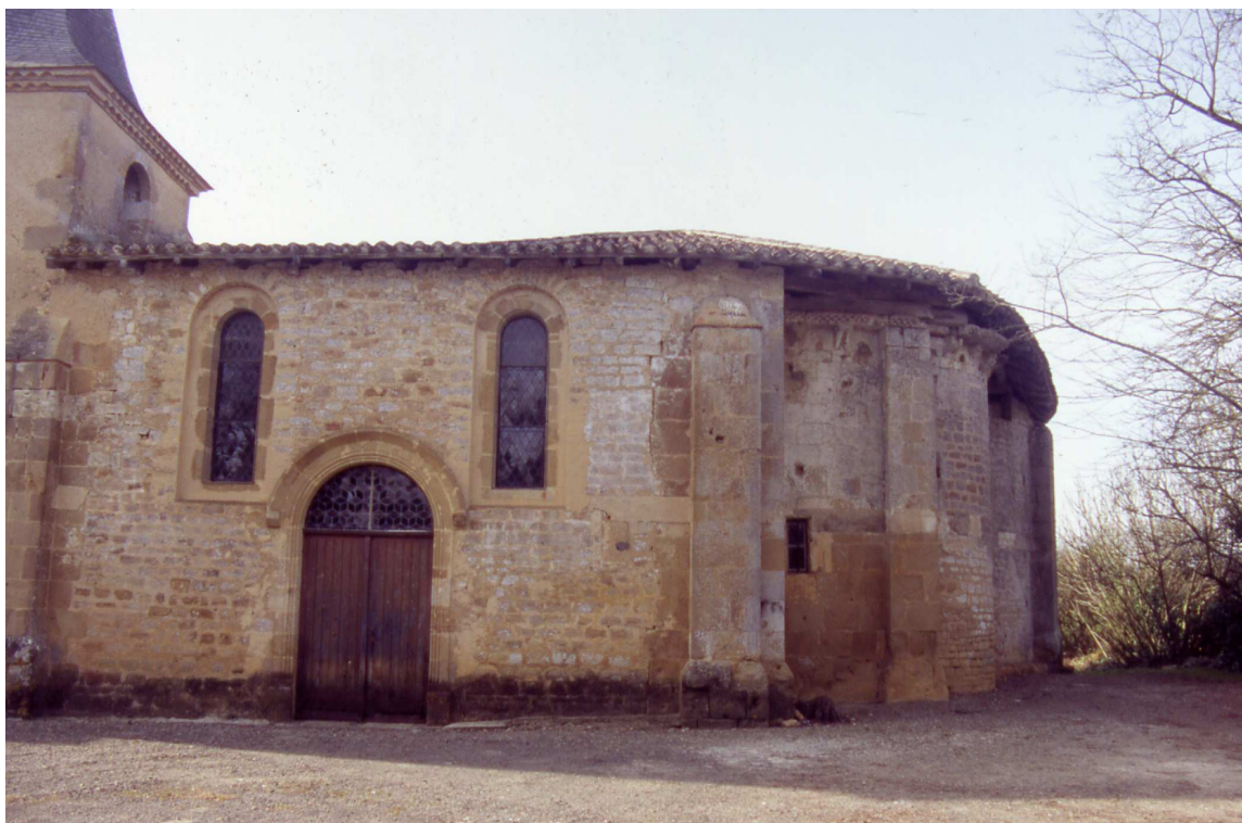
Fig. 1 : Lasserade, église de Croute, vue générale.