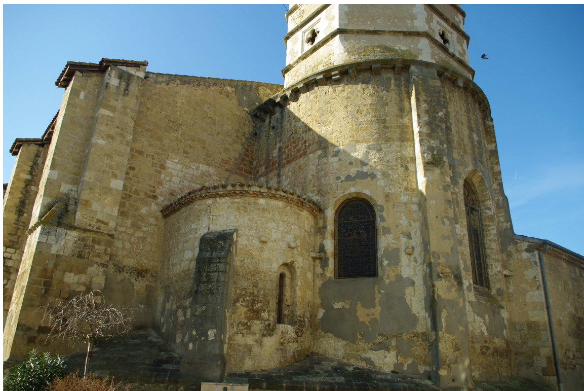
Fig. 20 : Vic-Fezensac, ancienne collégiale Saint-Pierre, le chevet.