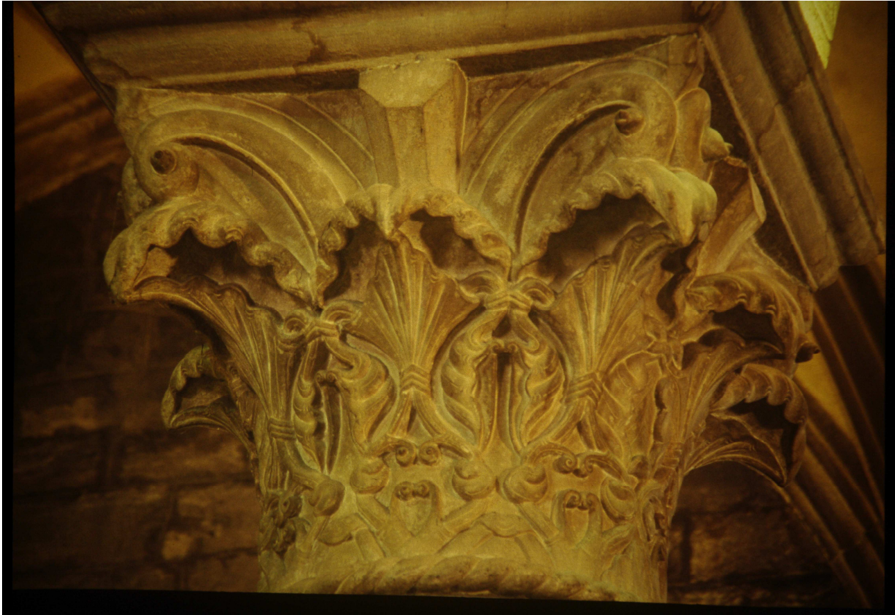
Fig. 17 : cathédrale Saint-Pierre de Jaca, un chapiteau de la nef.