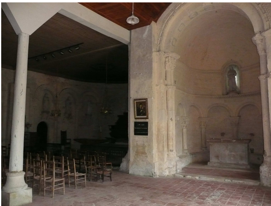
Fig. 2 : Lasserade, église de Croute, vue intérieure. (Cliché C. Balagna).