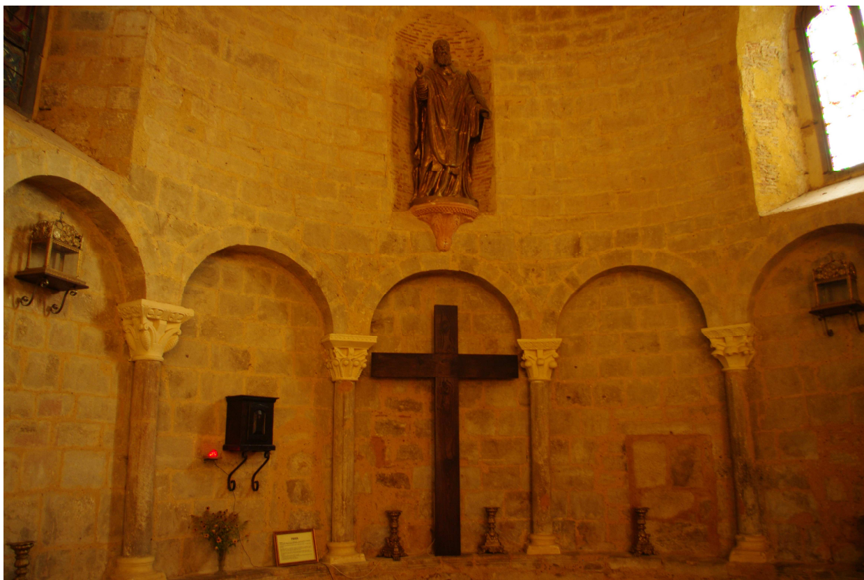
Fig. 14 : église Saint-Laurent d'Aignan, l'abside d'axe, détail.