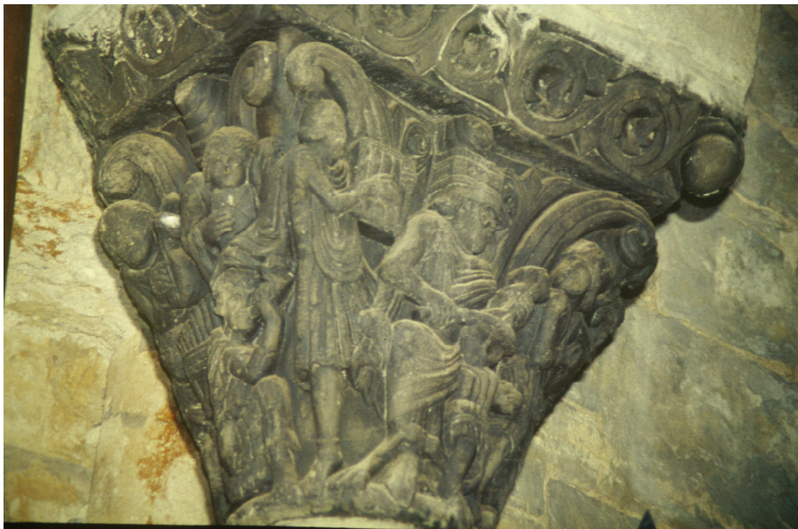
Fig. 8 : Jaca, cathédrale Saint-Pierre, chapiteau.