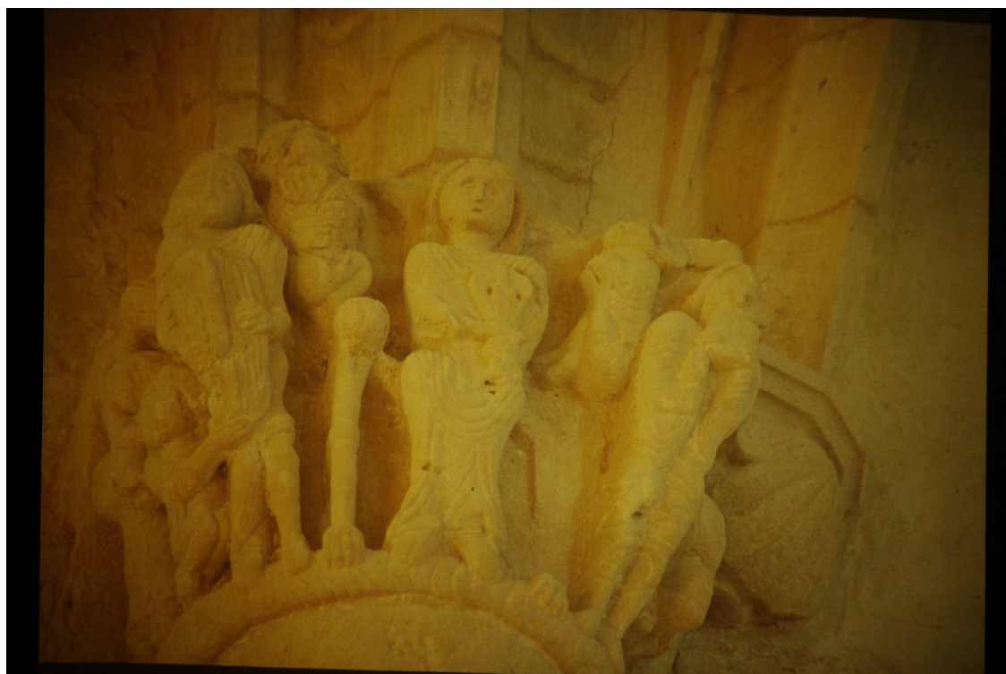
Fig. 9 : Saint-Mont, ancienne abbatale, chapiteau. (Cliché C. Balagna).