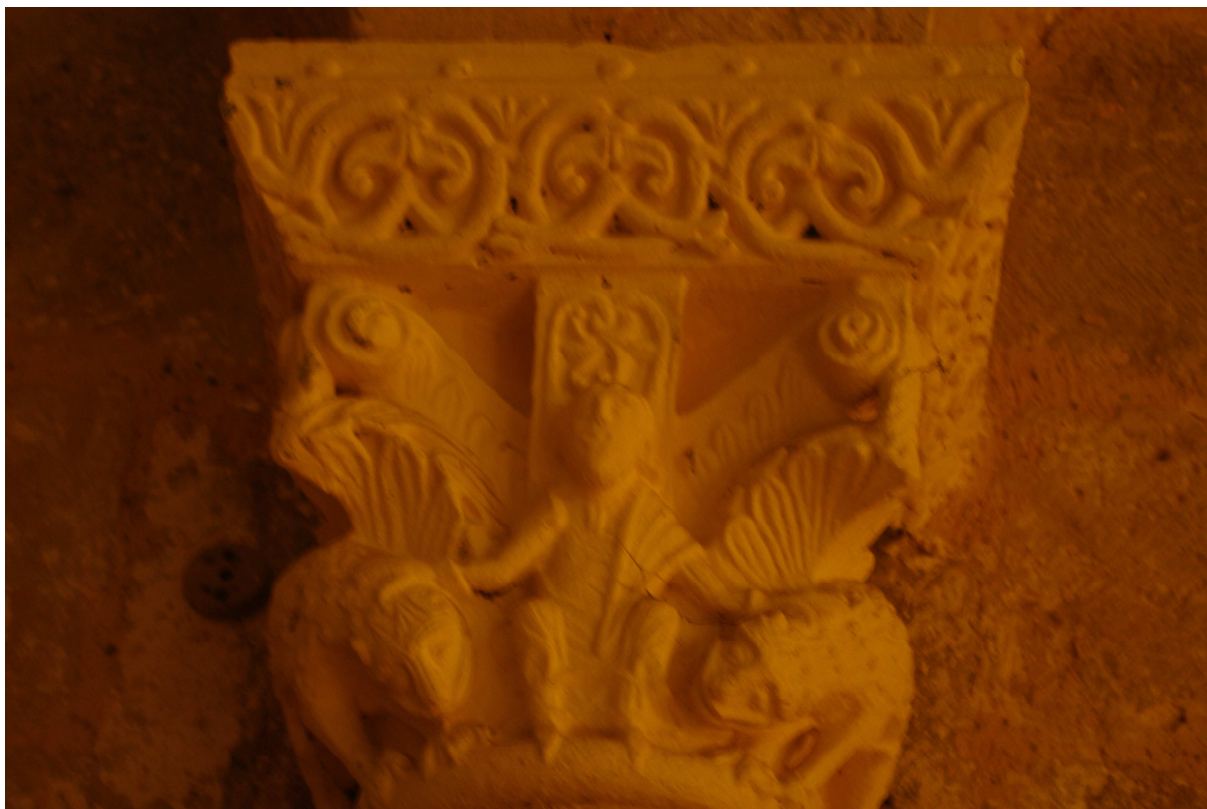
Fig. 18 : église Saint-Laurent d'Aignan, abside d'axe, chapiteau n° 10.