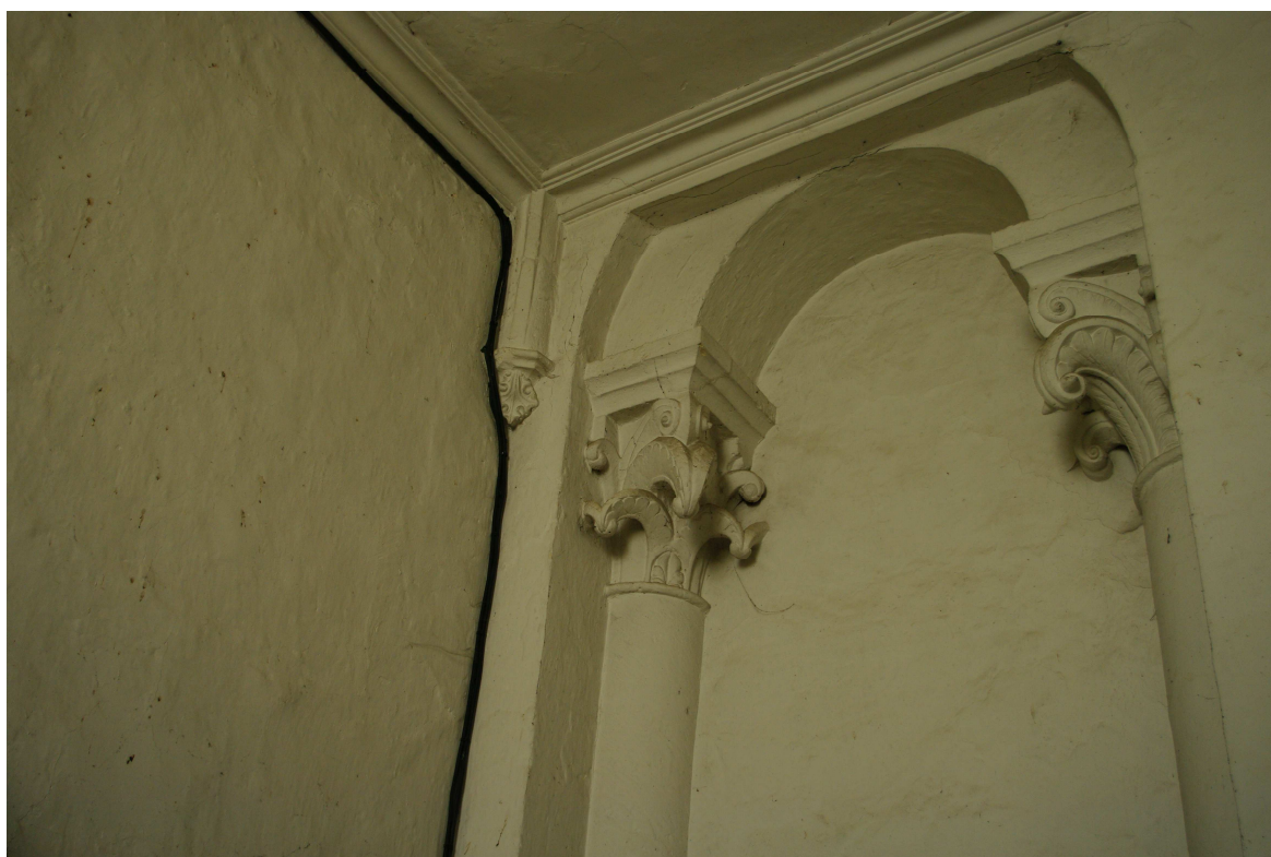
Fig. 21 : Vic-Fezensac, ancienne collégiale Saint-Pierre, la sacristie nord actuelle, vue intérieure.