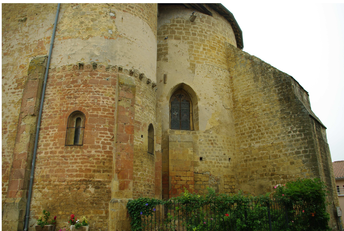
Fig. 11 : église Saint-Laurent d'Aignan, le chevet depuis l'angle sud-est.