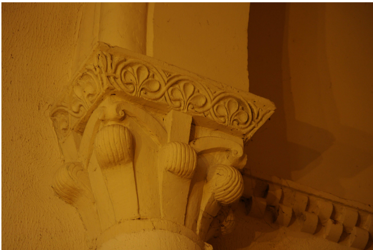
Fig. 12 : église Saint-Laurent d'Aignan, absidiole sud, chapiteau n° 1..