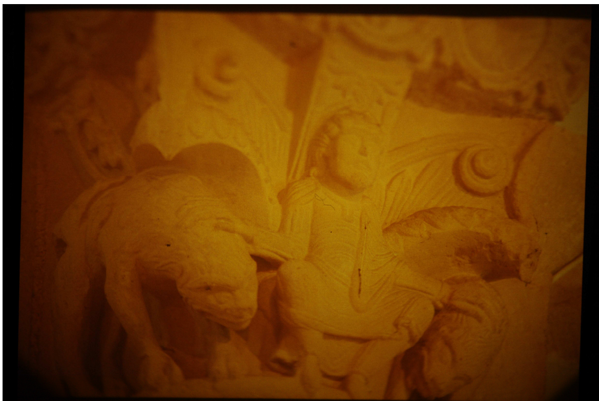
Fig. 19 : église de Sedze-Maubecq, chapiteau.