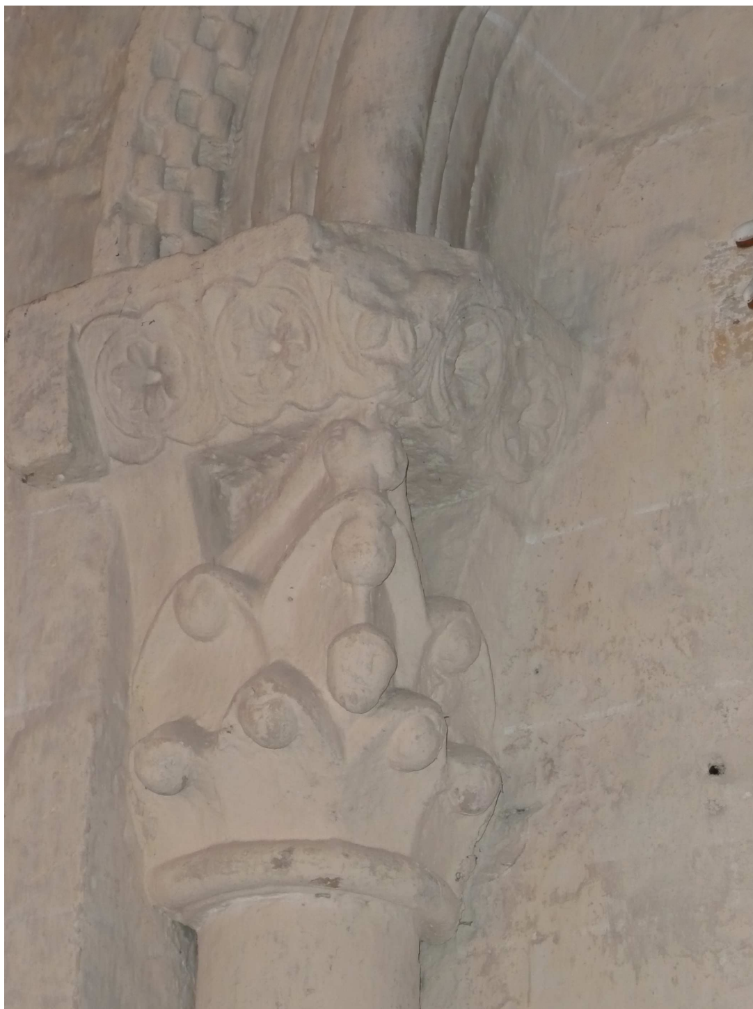
Fig. 3 : Lasserade, église de Croute, chapiteau n° 1. (Cliché C. Balagna).