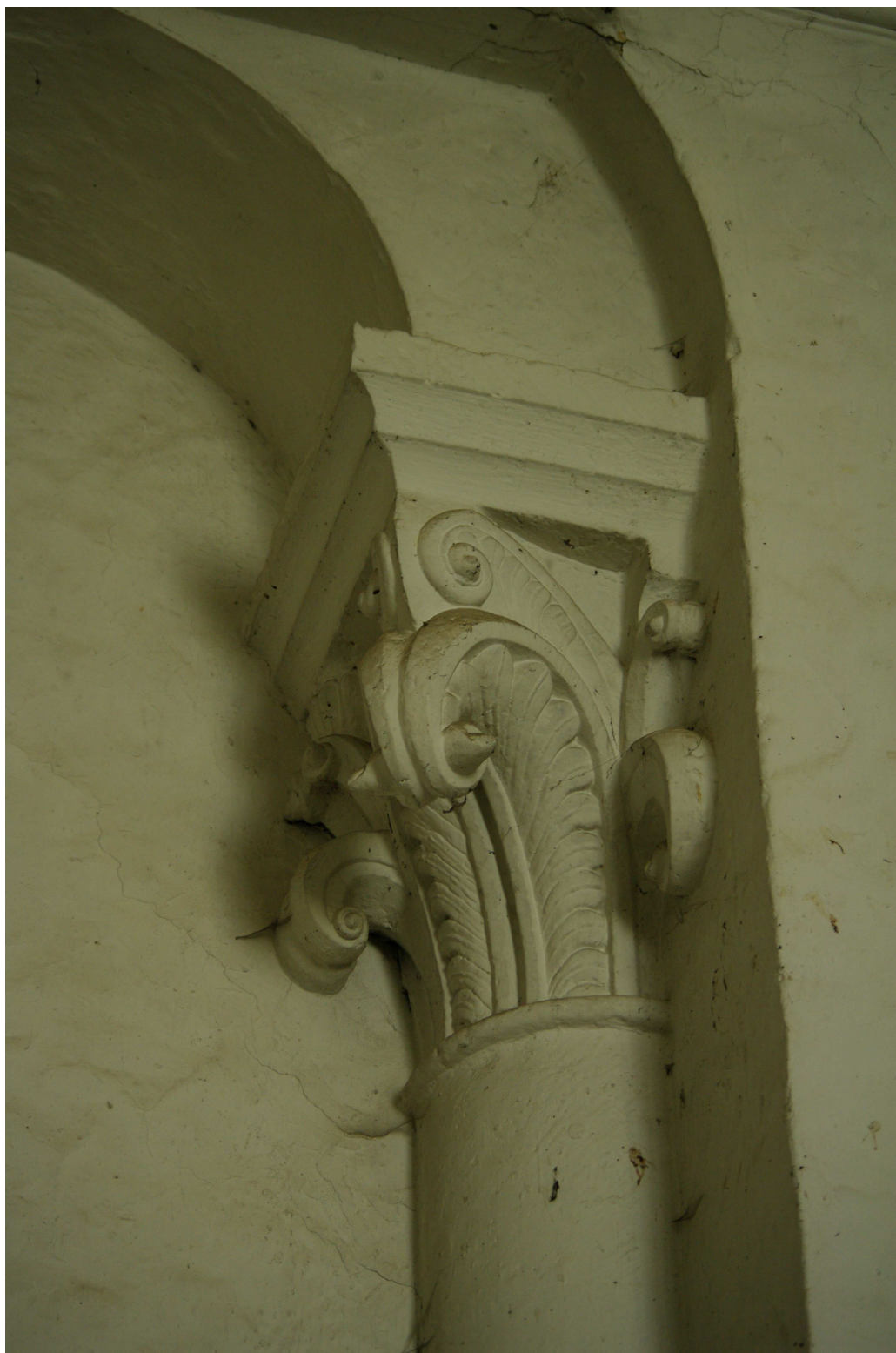
Fig. 23 : Vic-Fezensac, ancienne collégiale Saint-Pierre, la sacristie nord actuelle, le chapiteau de droite. (Cliché C. Balagna).