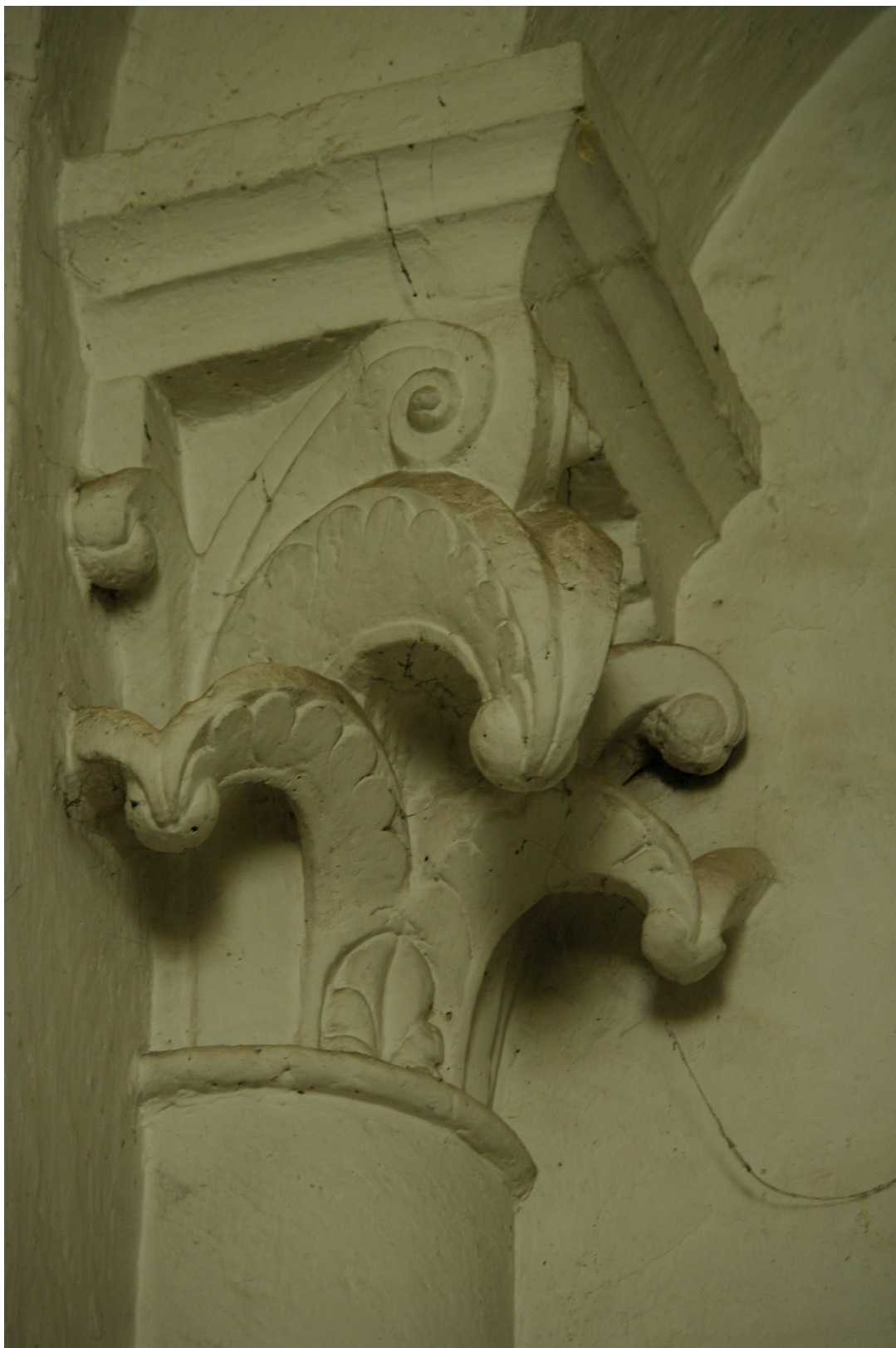
Fig. 22 : Vic-Fezensac, ancienne collégiale Saint-Pierre, la sacristie nord actuelle, le chapiteau de gauche.