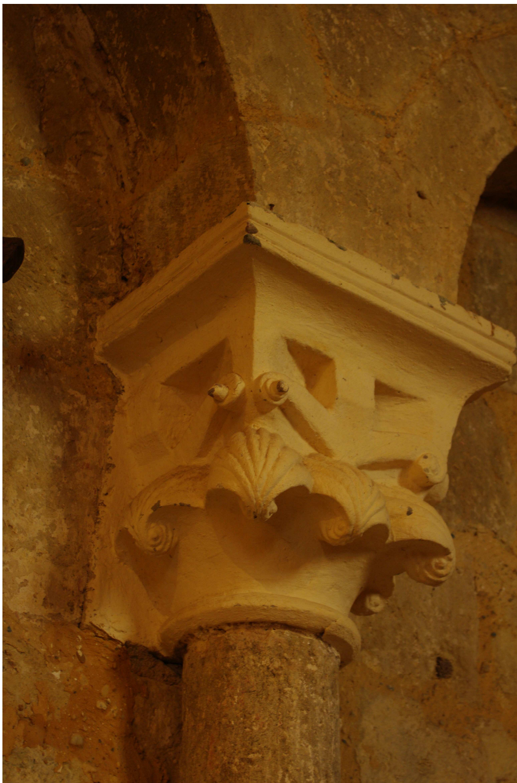
Fig. 16 : église Saint-Laurent d'Aignan, abside d'axe, chapiteau n° 3. (Cliché C. Balagna).