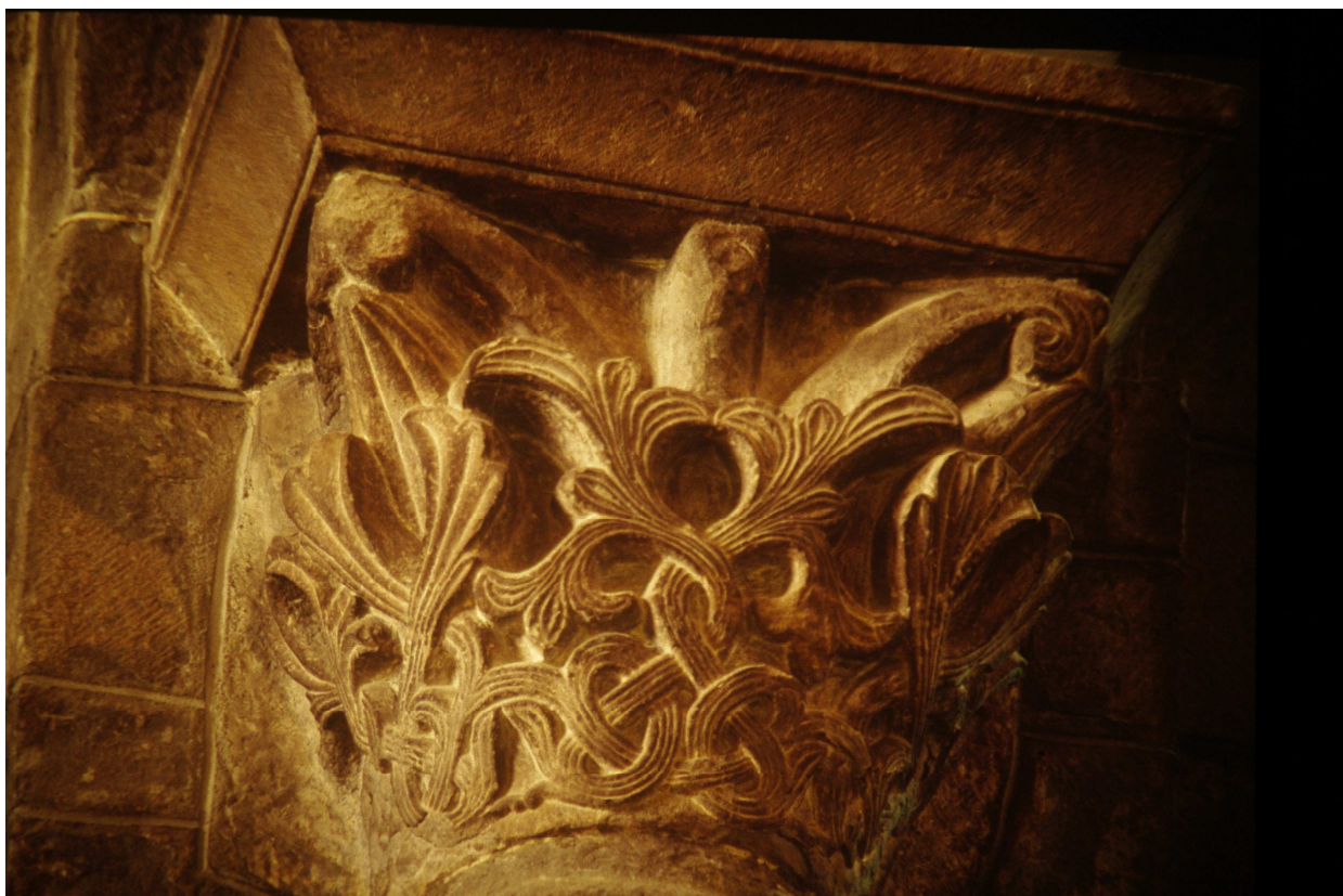
Fig. 6 : Jaca, cathédrale Saint-Pierre, chapiteau.