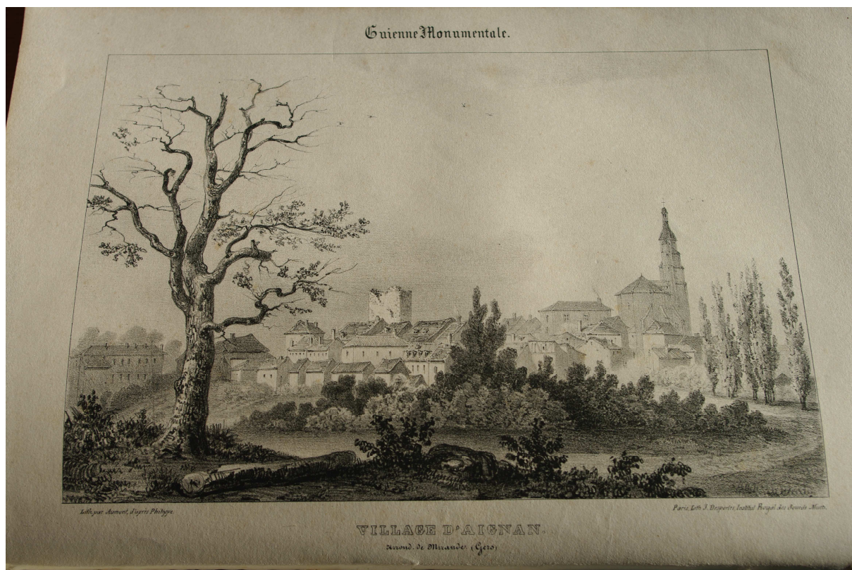
Fig. 10 : Guienne monumentale, le village d'Aignan, vers 1840. (Cliché C. Balagna).