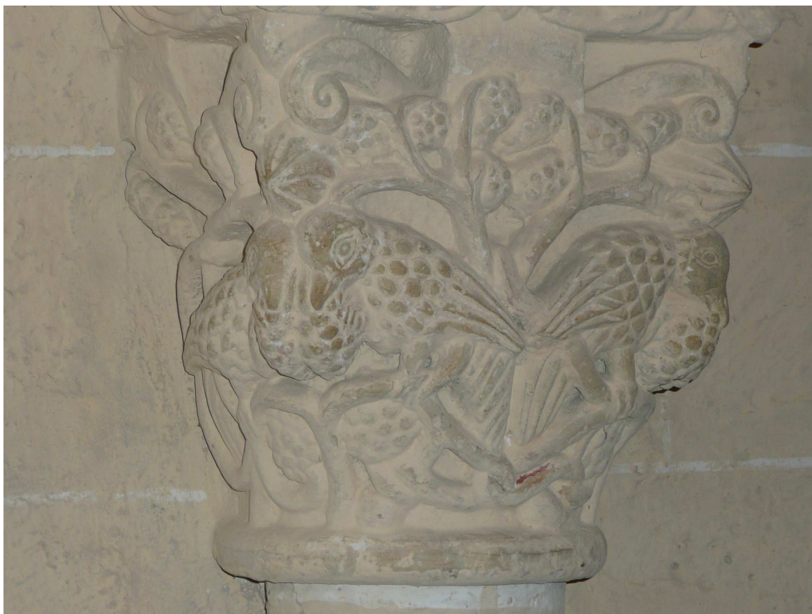
Fig. 5 : Lasserade, église de Croute, chapiteau n° 16.