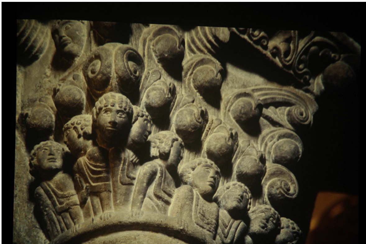
Fig. 4 : Jaca, cathédrale Saint-Pierre, chapiteau.