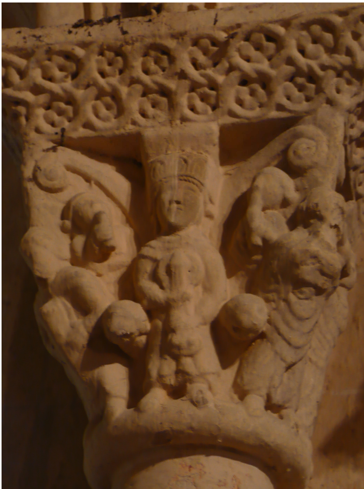
Fig. 7 : Lasserade, église de Croute, chapiteau n° 16. (Cliché C. Balagna).