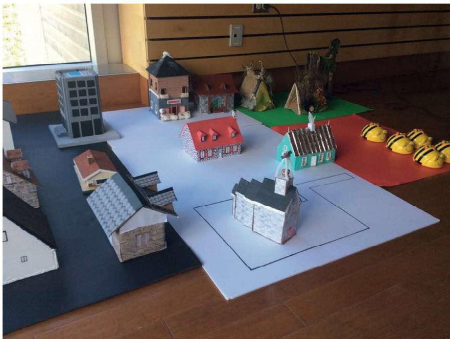
Figure 2. Construction de la maquette d'une ville (#SmartCityMaker).

mis en place en Finlande permet de réintégrer la complexité à l'école et ainsi d'éviter le réductionnisme et la décontextualisation de l'approche disciplinaire. Les méthodes d'apprentissage par phénomène ont pour objectif de développer chez les apprenants des connaissances approfondies sur les thèmes et les matières liés à un phénomène donné (par exemple, le changement climatique ou les villes intelligentes) et de développer les compétences transversales, comme la résolution co-créative de problèmes et la pensée informatique.