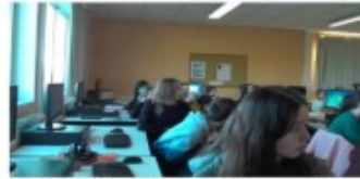
S2 – Val- 4ème 6 – Séquence « Sherlock Holmes » Avril, 23rd 2018 - Collège Ségalen, Chateaugiron

Il s'agit d'un cours en classe de quatrième, environ X élèves. Les élèves sont en binômes face à des ordinateurs répartis autour de la salle et sur un flot central (à vérifier). On ne voit pas le tableau.