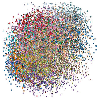
FIGURE 4 – Visualisation des plongements issus de sur-DNN

plongements résultants de X-LSTM permettent une synthèse par sélection d'unités satisfaisante (cf. Tableau 1). Plus d'informations sur les modèles, les attributs utilisés et les performances associées sont disponibles dans (Perquin et al. , 2018).