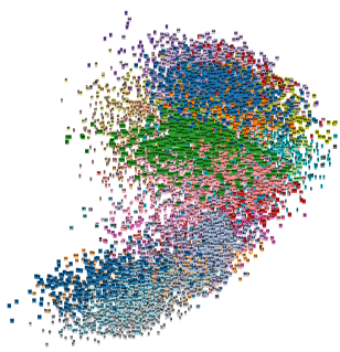
FIGURE 2 – Visualisation des plongements issus de ref-DNN