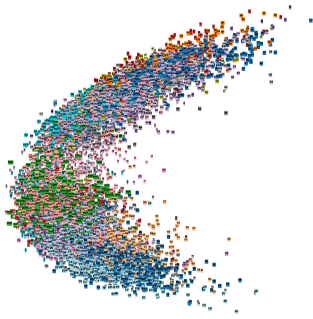
FIGURE 3 – Visualisation des plongements issus de sous-DNN