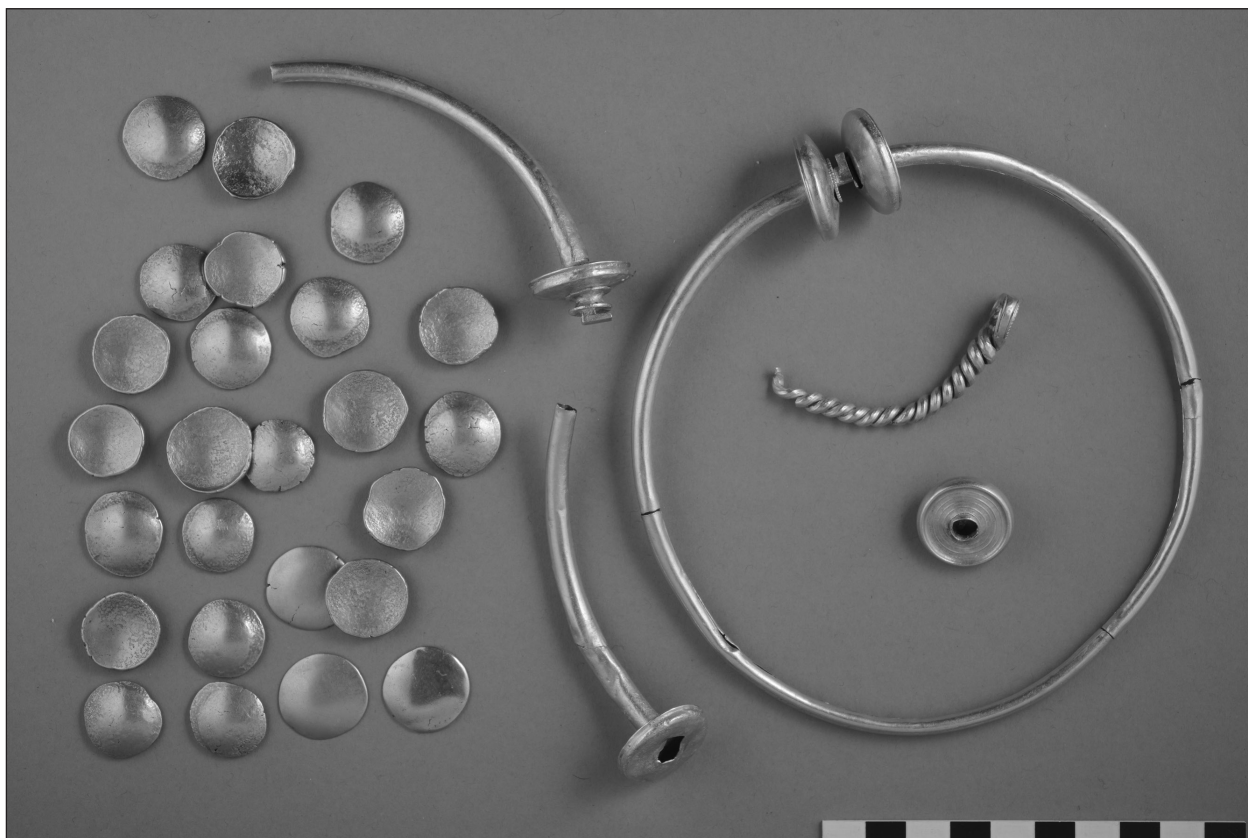
Fig. 3 Dépôt de Beringen, Belgique, Limbourg (Photo B. Armbruster, conservation Musée de Tongres)

L'approche technologique se prête tout particulièrement à la mise en évidence de traditions et d'innovations locales, mais aussi d'influences étrangères et de réseaux d'échanges, attestant de la mobilité des personnes, des objets et des idées. Par l'examen des états de surface, des traces d'outils, d'usure et de manipulations, les objets d'orfèvrerie peuvent être replacés dans une chaîne opératoire complexe comprenant toutes les étapes de leur fabrication (mise en forme, décoration, assemblage, finitions) et de leur utilisation jusqu'à leur enfouissement, tenant compte des éventuels réparations, traitements ou réutilisations. Une démarche expérimentale permet également de mettre à l'épreuve les résultats obtenus.