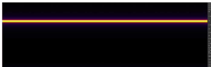
Figure 2 : Spectrogramme d'un son pur à 2 KHz.

Cette idée de pur et d'impur, concernant le son et nos perceptions du son nous renvoie aux réflexions de Murray Schafer, qui distingue le « Low-Fi », son produit par l'activité humaine du « Hi-Fi », son produit par les phénomènes naturels.