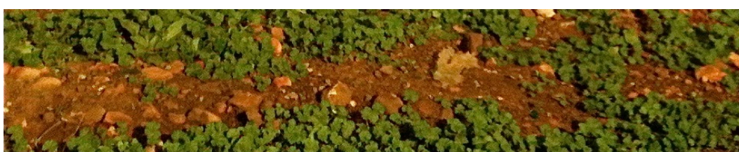
Photographie 2 : Ruissellement d'eau sur une terre d'argile à Sejnane (Tunisie)

Pour la petite anecdote, j'ai fait une captation de ces sons en Tunisie à l'occasion d'un projet sur le travail des potières de Sejnane. Dans un trajet solitaire, j'ai éprouvé un véritable choc esthétique : C'est en pleine campagne sur une terre argileuse ; les sons issus de l'activité humaine sont quasiment inexistants ; il a beaucoup plu.