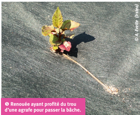
⑤ Renouée ayant profité du trou d'une agrafe pour passer la bâche.

Des espèces ligneuses compétitrices peuvent être plantées dans la bâche. On prendra cependant bien garde à l'étanchéité des ouvertures ainsi créées que les renouées ne manqueront pas d'explorer. Il peut s'agir de boutures courtes ou longues de salicacées ou d'autres ligneux connus pour leurs effets sur la renouée comme le sureau hîble ou la bourdaine ; d'autres essences forestières peuvent également être utilisées en fonction du contexte stationnel. Pour les bâches recouvertes de 20 à 30 centimètres de terre utilisée comme lest, on pourra procéder à un ensemencement, voire à la plantation de ligneux bas (encadré ⑤, voir aussi l'article de Dommanget et al. , pages 74-79, dans ce même numéro).