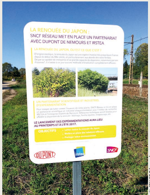
1 Affiche du partenariat industriel et scientifique.

Les premiers résultats au bout de deux années d'installation sont encourageants. Les expérimentations se poursuivent pour déterminer les meilleures solutions.