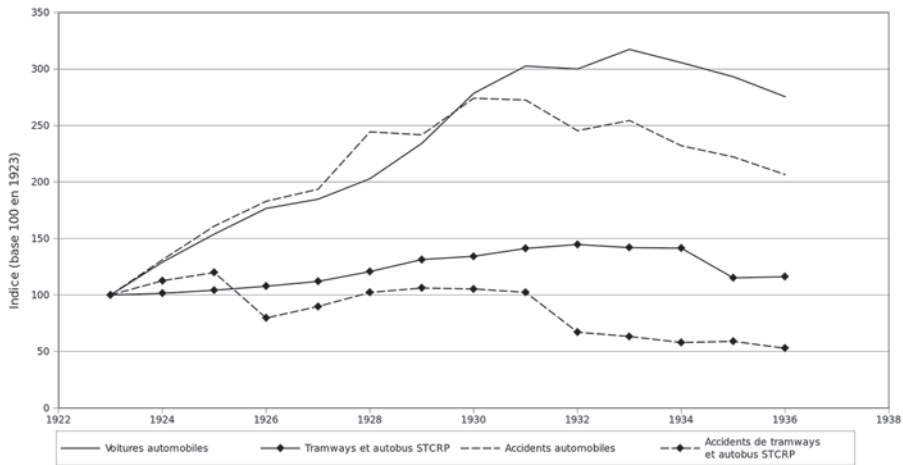
Figure 1 : Évolution du parc et du nombre d'accidents automobiles du département de la Seine et du réseau de surface de la STCRP, 1923-1936 (base 100 en 1923) 39

Les tests et simulateurs employés au sein du laboratoire de la STCRP sont efficaces et permettent de réduire le taux d'échec des machinistes, la sélection s'opérant avant leur entrée en apprentissage 37 . En 1926, le nombre d'accidents s'avère inférieur de 16,5 % chez les machinistes sélectionnés par tests psychotechniques. Cette régulation du facteur humain se poursuit, si bien qu'entre 1923 et 1936, les accidents passent de 1,5 à 0,6 par machiniste et par an et de 7,7 à 2,6 aux 100 000 km parcourus (fig. 1) 38 .