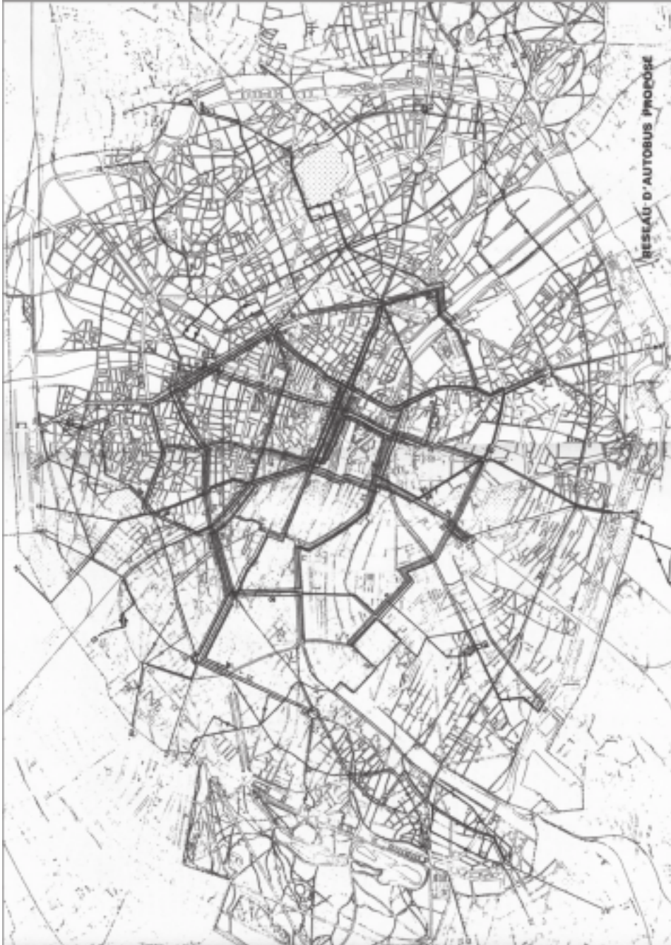
Figure 3. Programme de réorganisation proposé par l'APUR en 1971