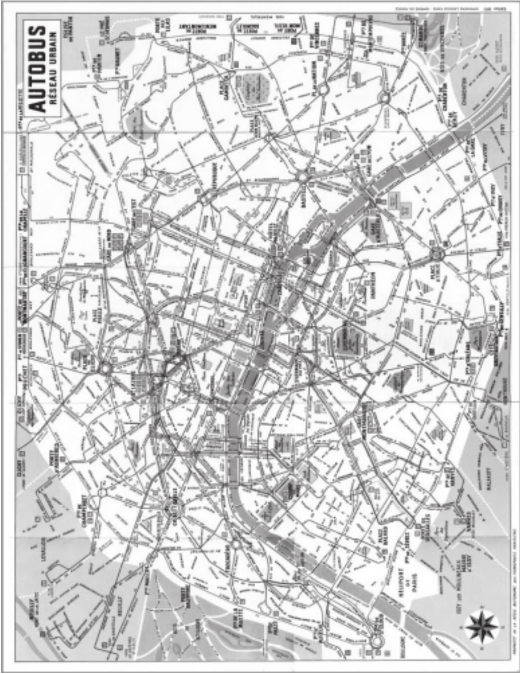
Figure 4. Plan du réseau d'autobus en 1971 © RATP.