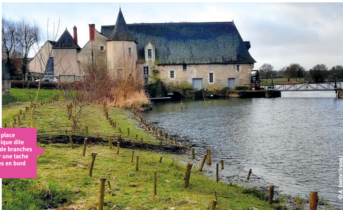
➊ Mise en place de la technique dite de couche de branches à rejets sur une tache de renouées en bord de rivière.