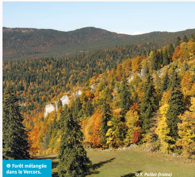
2 Forêt mélangée dans le Vercors.

Les préconisations de gestion pour adapter les forêts au changement climatique visent à préserver les biens et services qu'elles fournissent. Ces mesures passent par des améliorations génétiques et par la mise en œuvre de pratiques qui impliquent des interventions humaines