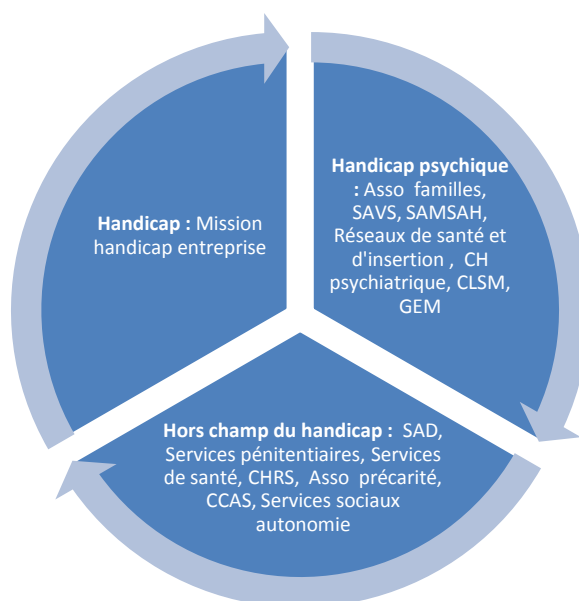
Figure 2 : Structures d'appartenance des participants à l'enquête

Il aurait été intéressant que la diversité des groupes soit plus grande encore. Elle a toutefois pu être assurée, comme en témoigne le fait constaté dans les trois départements que la plupart des acteurs ne se connaissaient pas, en particulier quand ils ne sont pas du même champ d'intervention et parfois même quand ils le sont. Le fait d'appartenir à des structures qui sont partenaires joue dans le sens d'une interconnaissance, principalement quand les acteurs interviennent sur les mêmes territoires (quartiers, communes, circonscriptions...).