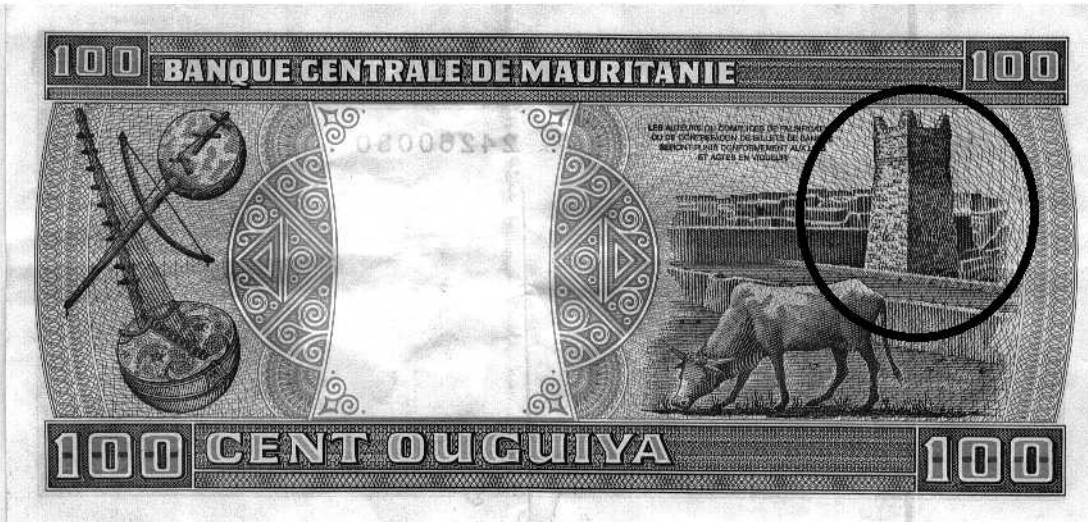
Fig 3 : La représentation des minarets des mosquées des villes anciennes