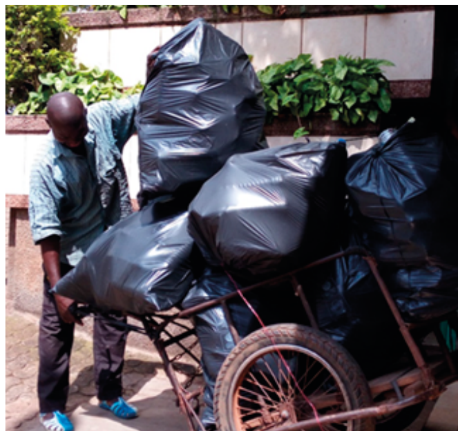
Figure 3. Bidons vides des produits d'entretien et bouteilles (PET) d'eau minérale collectés par un récupérateur informel

Le développement de l'activité touristique au Cameroun et particulièrement dans la région du Centre, connaît une expansion croissante. En dépit des contraintes sécuritaires