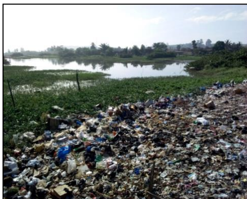
Photo II : Dégradation du fleuve par les activités de charbon de bois (quartier Sotref)

Photo I : Dégradation du lac par les ordures ménagères (quartier Sonouko)