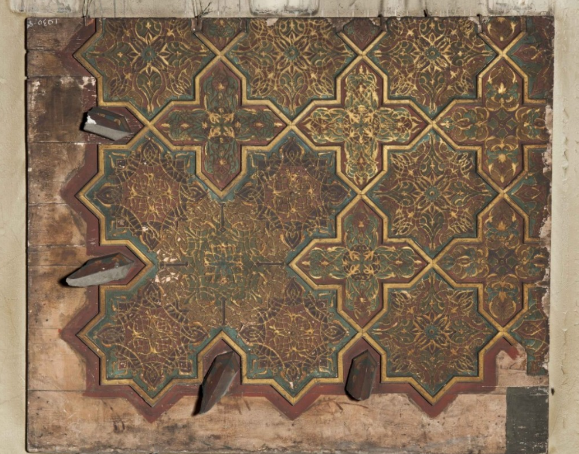
Quart du plafond dans les collections du Victoria and Albert Museum exposé lors de l'exposition universelle de 1878 à Paris.