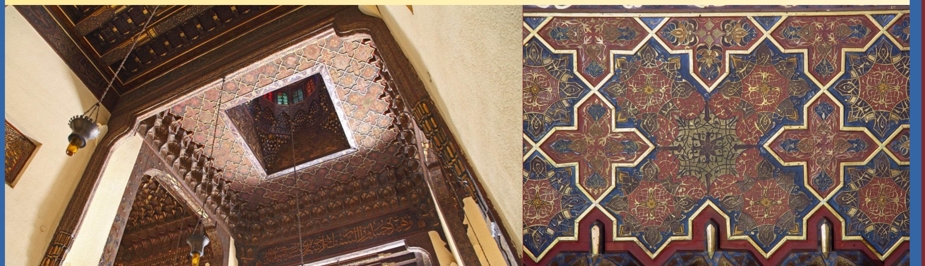
Plafond du grand hall de l'ambassade aujourd'hui