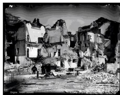
Village de Diano Marina (Ligurie) après le séisme de 1887