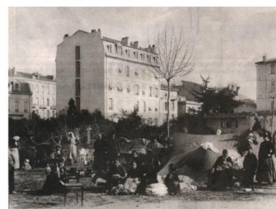
Centre ville de Nice après le séisme de 1887