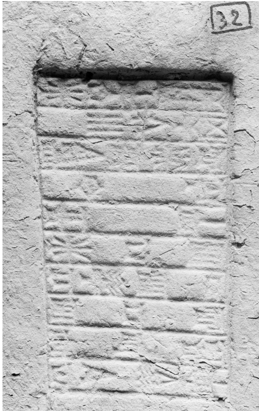
Fig. 3 : Photographie de l'exemplaire publié par M. Birot en 1968

(n° 13458, carnet IV des photographies d'A. Parrot, service des archives de la MAE)