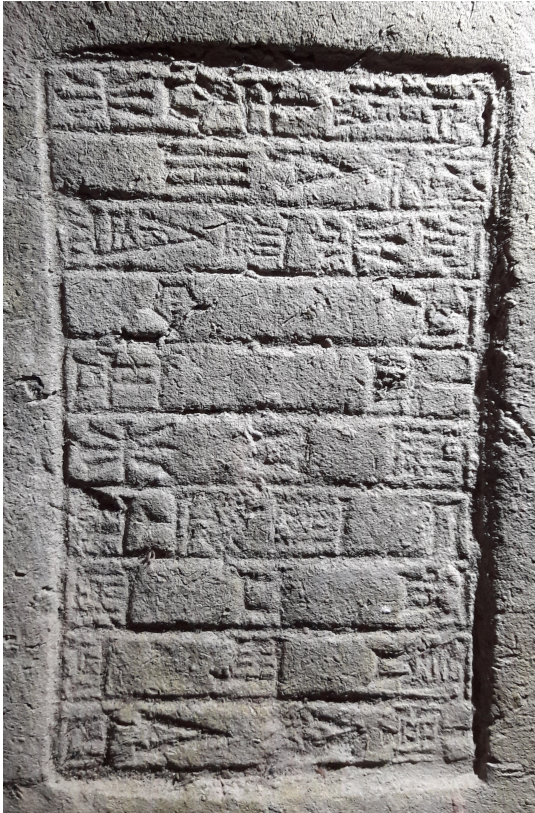
Fig. 1 : Photographie de l'inscription

10. Noter l'emploi des préfixes ba-ni pour le causatif.