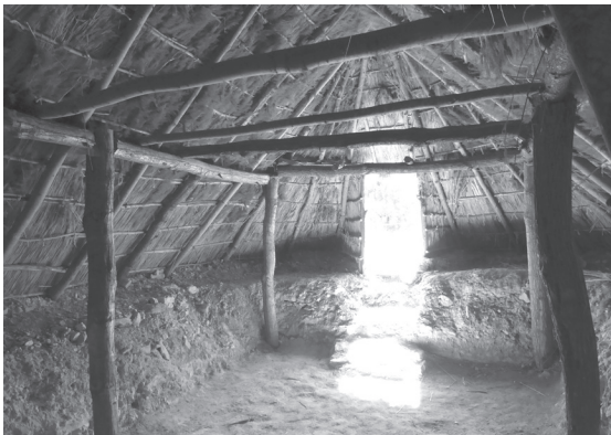
Fig. 7 > Vue intérieure du cellier.