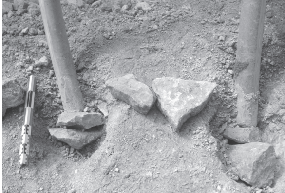
Fig. 5 > Ancrage des chevrons au sol.