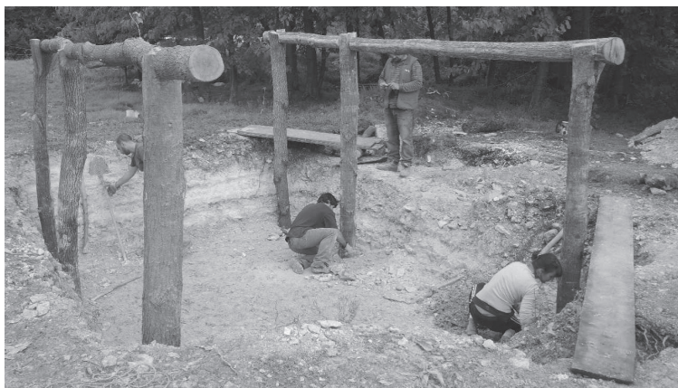
Fig. 4 > Poteaux plantés en terre dans l'excavation restituée.

Toujours dans la moitié nord de la France, sur le site de « La ZAC du Bourg » à Ingré (Loiret), en périphérie immédiate du bourg ancien correspondant d'après les textes à la curtis d'Hugues le Grand, duc des Francs, qu'il concède en 946 à Notre-Dame de Chartres, deux exemples ont été mis au jour 9 . L'occupation des IX e -X e siècles explorée sur 2,4 ha s'organise en douze parcelles construites, appartenant à trois exploitations agricoles distinctes s'ouvrant sur deux chemins perpendiculaires (CC, pl. VIII, fig. 9). Le premier cellier qui nous intéresse ici se trouve au