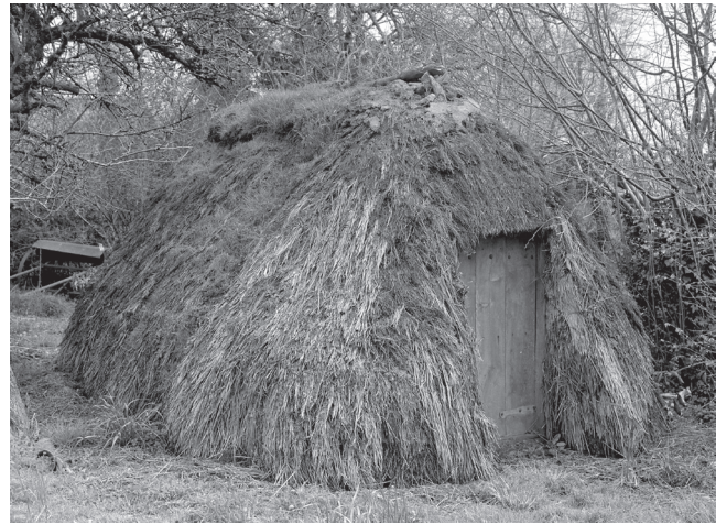
Fig. 2 > Le Cambout (22), lieu-dit Le Gastry, taudio construit dans les années 1960.

La restitution de cette structure s'est basée sur le modèle ethnographique des « loges » du centre de Bretagne et d'Anjou-Touraine, récemment étudiées 8 . Il s'agit de remises agricoles en bois construites pour les dernières au milieu du XX e siècle, dont les techniques de construction sont similaires à celles mises en œuvre au haut Moyen Âge avec des poteaux plantés, un sol la plupart du temps excavé et une couverture végétale. Les loges de Bretagne, appelées traditionnellement « taudion », « houra », « loge », « cave » ou « cellier », ont un plan ovale de 8 × 4 m en moyenne avec des croupes semi-circulaires aux extrémités, une toiture en bruyère qui descend jusqu'au sol et une charpente à cruck constituée de couples d'arbalétriers courbes plantés en terre (fig. 2). Leur sol est systématiquement surcreusé de 10 à 20 cm, plus rarement de 40 cm à 1 m, conférant à toutes ces loges une fraîcheur utile pour le stockage de fûts de cidre (fig. 3).