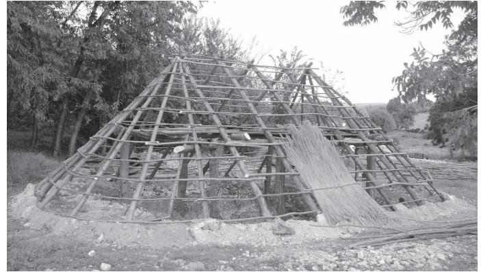
Fig. 6 > Vue arrière du cellier avec son abside et le talus périphérique en pied de toiture.