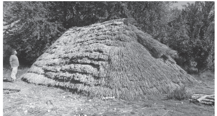
Fig. 8 > Cellier achevé avec sa couverture en roseaux.

sein de la parcelle 6 installée à l'angle des deux chemins et abritée par la construction 11 (CC, pl. VIII, fig. 10). Si le plan exact du bâtiment accueillant cette structure n'est pas connu, très perturbé par de multiples fosses et silos, une superficie de l'ordre de 50 \text{ m}^2 est restituée a minima ( 10 \times 5 \text{ m} ). Le cellier se trouverait dans ces conditions dans le tiers nord du bâtiment, le long du chemin, et occuperait toute sa largeur. Il s'agit indéniablement d'un bâtiment à usage d'habitation si l'on en juge par la présence de latrines repérées dans l'angle sud-ouest de son emprise. Le cellier proprement dit mesure 4,70 \text{ m} de long d'est en ouest pour 2,10 \text{ m} de large ( 9,80 \text{ m}^2 ) et une profondeur conservée de 1,50 \text{ m} . Il est creusé dans le limon et le calcaire sous-jacent. Le côté sud se trouve bordé par quatre trous de poteaux aménagés dans la paroi, creusés aux dimensions de chacun des poteaux. Au nord, les deux trous de poteaux sont encore clairement visibles et un troisième, dans l'alignement vers l'est, a été repéré au diagnostic. L'angle nord-est est absent ; il pourrait avoir été détruit lors de l'effondrement des deux silos probablement synchrones au cellier et situés dans son angle nord-est.