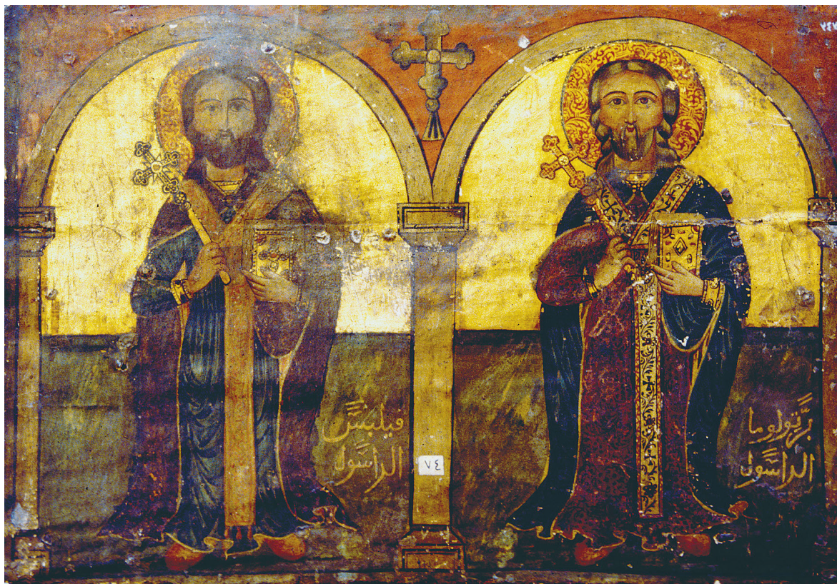
Fig. 13. Saint Philippe et Saint Barthélemy, attribué à Yūḥannā al-Armanī al-Qudṣī, v. 1780, ancienne cathédrale Saint-Marc d'al-Azbakiyya, M.C. 3430, Musée copte, Le Caire.

d'invoquer ses louanges pour soi-même et sa famille et de s'assurer une place de choix au Ciel le moment venu. Les noms des frères al-Ġūharī sont dispersés un peu partout dans les églises du Caire prouvant ainsi leur bonne fortune, mais aussi cette volonté de redistribution à leurs coreligionnaires. Le nom d'Ibrāhīm est ainsi peint sur deux panneaux attribués à Yūḥannā al-Armanī et datés de 1493 de l'ère de Dioclétien (1777). Ils sont réalisés pour le sanctuaire de saint Mercure que le mubāšir fait réaménager dans l'église de la Vierge-Marie de Ḥārat Zuwayla. La première icône figure la Vierge et l'Enfant, les archanges Michel et Uriel, et saint Pierre. La seconde représente les archanges Gabriel et Raphaël, et saint Paul. À l'instar du panneau orphelin sur lequel sont peints les saints Philippe et Barthélemy, ces images font partie du décor plus vaste d'une iconostase. L'ensemble démembré est aujourd'hui complété par des images de mêmes types peintes par Yūḥannā al-Armanī, mais où les détails et les couleurs dénotent une certaine hétérogénéité.