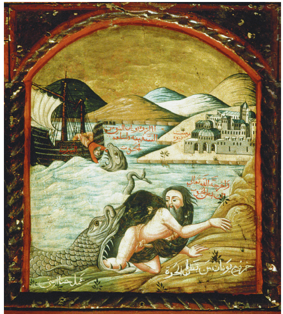
Fig. 9. Jonas rejeté par le monstre marin par Yūḥannā al-Armanī al-Qudṣī, 1777, Le Caire, église Saint-Mercure.