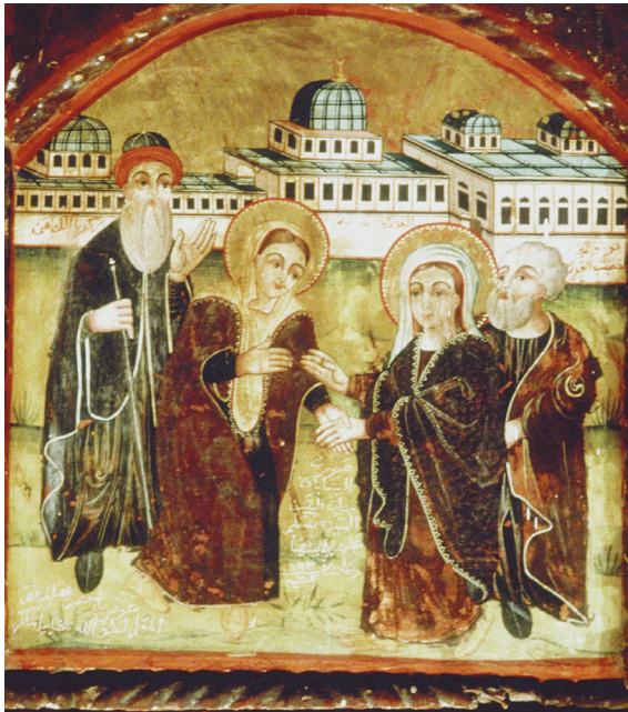
Fig. 6. La Visitation par Yūḥannā al-Armanī al-Qudṣī, 1777, Le Caire, église Saint-Mercure.