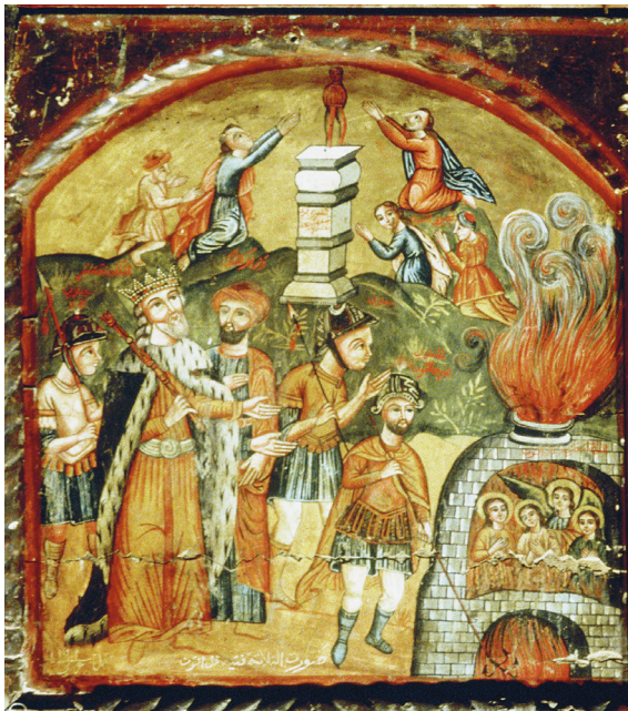
Fig. 8. Les Trois Hébreux dans la fournaise par Yūḥannā al-Armanī al-Qudṣī, 1777, Le Caire, église Saint-Mercure.