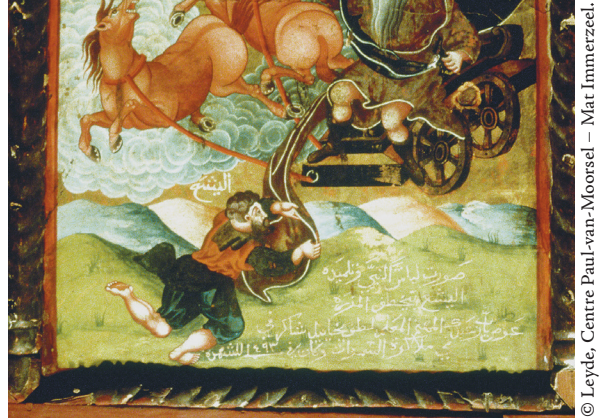
Fig. 7. Élie emporté au ciel donne son manteau à Élisée par Yūḥannā al-Armanī al-Qudṣī, 1777, Le Caire, église Saint-Mercure.