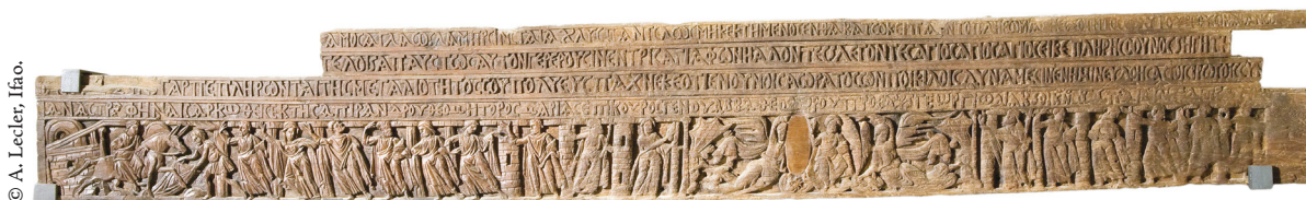
Fig. 2. Linteau, 735, église de la Vierge-Marie al-Mu'allāqa, M.C. 753, Le Caire, Musée copte.

12 du mois de Pachon, 3 e indiction, 451 de l'ère de Dioclétien.