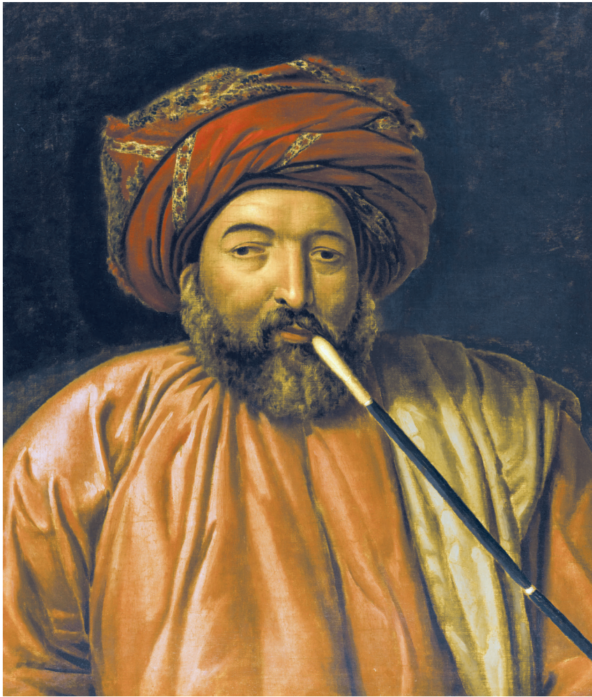
Fig. 12. Le Cheikh Guerguess El-Gohari par Michel Rigo, première moitié du XIX e siècle, Rueil-Malmaison, musée national des châteaux de Malmaison et de Bois-Préau.