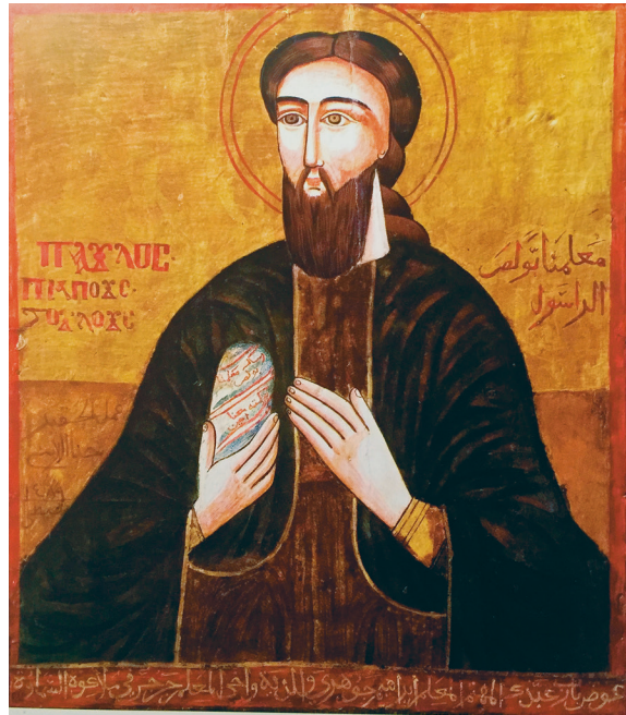
Fig. 14. Saint Paul (détail de la Deesis ) par Yūḥannā al-Armanī al-Qudṣī, 1773, Le Caire, Fum al-Ḥaliġ, église Saint-Ménas.

L'œuvre la plus marquante de Yūḥannā al-Armanī dans cette église est l'icône principale figurant saint Méнас (fig. 15) 93 . Datée de 1487 de l'ère de Dioclétien (1771), elle est encore placée dans sa maqṣūra du XVIII e siècle sculptée en bas-relief et peinte. Le martyr y est peint à cheval dans un paysage verdoyant planté d'arbres. Il est nimbé, porte une barbe et de longs cheveux gris, et tient dans sa main droite une lance crucigère qu'il plante dans la tête d'un démon ailé. Devant le cheval, un juif et un chrétien sont placés devant une petite architecture. Selon la tradition, il s'agit de l'évocation d'un prêt octroyé par le premier au second, dont ce dernier nia l'existence et refusa le remboursement. Le juif fit alors jurer le chrétien sur le tombeau de Méнас provoquant la colère et la vengeance du saint 94 . Ces deux personnages, contrairement à Méнас, sont vêtus de tuniques, de manteaux et de turbans à la mode ottomane contemporaine. L'inscription peinte en partie inférieure rend encore une fois hommage à celui grâce à qui le panneau existe : « Souviens-toi Ô Seigneur de Ton serviteur qui a travaillé dur pour cela al-mu'allim Ibrāhīm al-Ġūharī ».