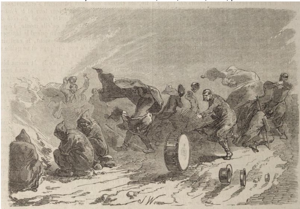
Figure 3. « Coup de vent en Crimée (14 novembre 1854) », gravure tirée de : Histoire populaire contemporaine de la France , Paris, Lahure, 1866, p. 140

Pour conclure, on peut formuler deux autres hypothèses quant à l'effet, toujours difficile à appréhender, de ce genre de publications à succès sur la culture historique française et, plus largement, européenne, quant aux représentations collectives relatives à la Guerre de Crimée. La première réside dans la façon nouvelle d'appréhender ce conflit lointain, dont témoigne l'évolution