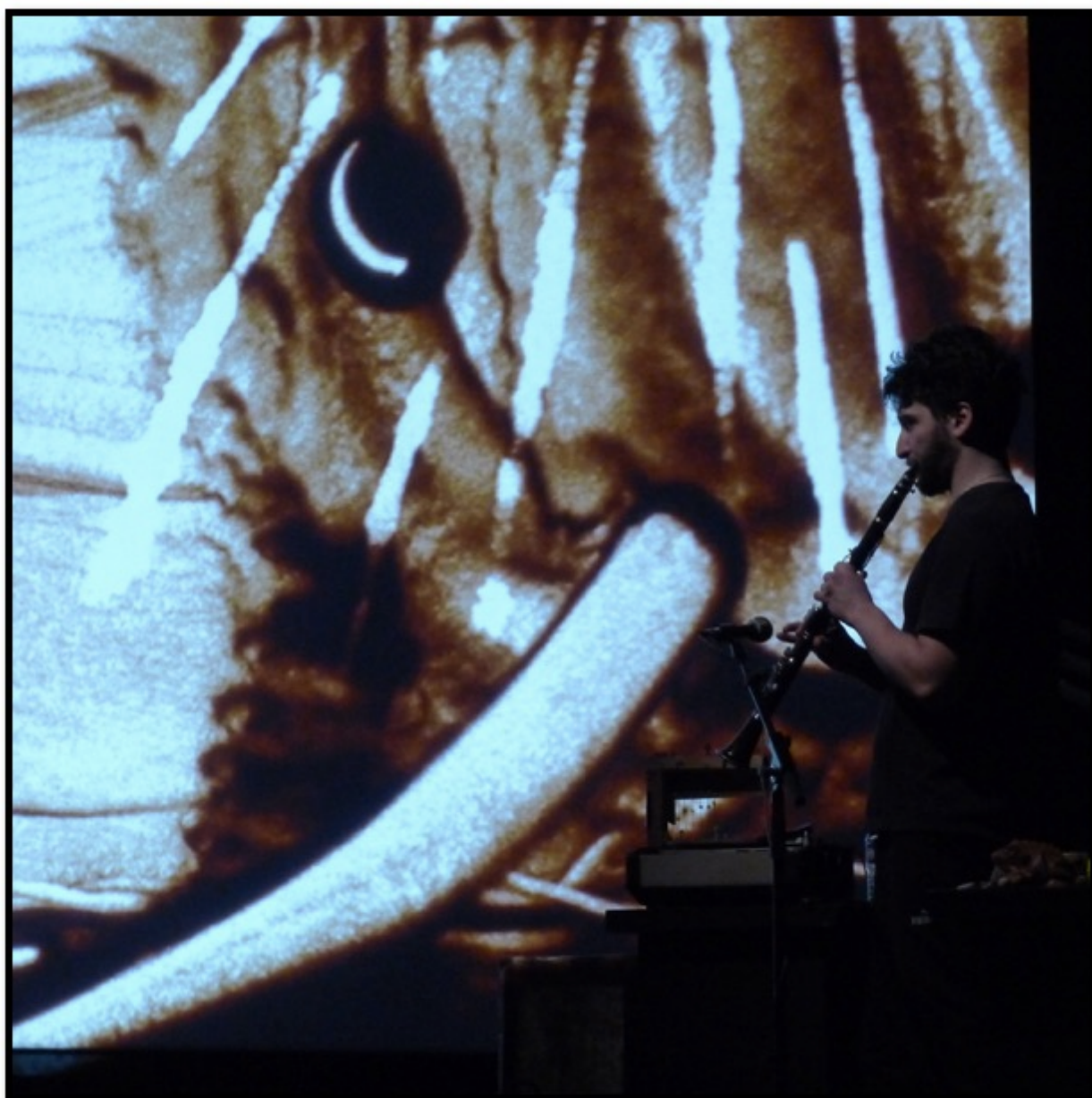
Quand un animal te regarde, 2016. Conception et mise en scène de Jade Duviquet.