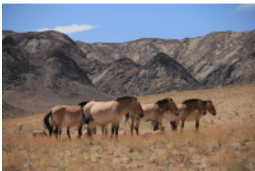
Le cheval de Przewalski vit à l'état sauvage en Mongolie.