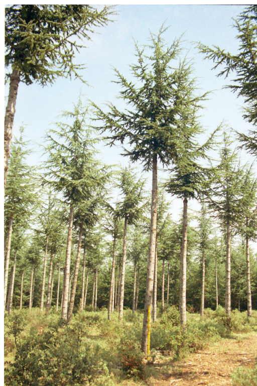
Figure 1 - Aperçu du traitement de réduction de la surface foliaire le plus intensif