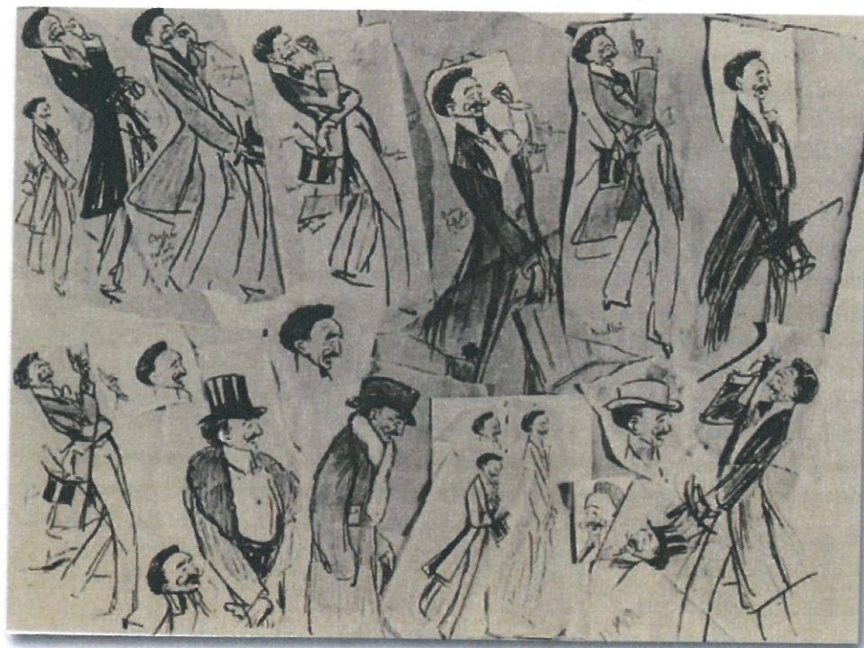
Figure 3 : Sem (Georges Goursat, 1863-1934), études physiologiques du comte Robert de Montesquiou, 1891.