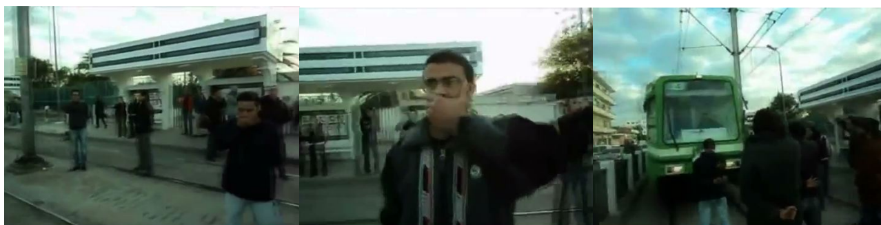
FIG 5 Captures d'écran de la vidéo de la flashmob. Tunisie, 2010.

D'autres vidéos montrant des actions qui ne se revendiquent pas nécessairement de la forme flashmob mais se définissent « en soutien » à une cause sont également comparables. La formule « en soutien » est ainsi présente dans le titre et/ou la description qui accompagne(nt) la vidéo en ligne, et l'action filmée est caractérisée par le petit nombre de participants et par la position centrale du filmeur. Ainsi, dans une autre vidéo 23 « en soutien » à Sidi Bouzid, le filmeur est placé au centre d'un groupe d'hommes qui chantent des slogans. C'est donc à lui, et par extension aux futurs spectateurs, que sont adressés les chants, et l'action semble donc bien pensée pour la caméra plus que pour la rue.