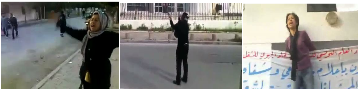
FIG 2 Captures d'écran de trois vidéos montrant des personnes isolées. Tunisie, 2011.

Les expressions de courage individuel sont également susceptibles de participer à mobiliser. Les filmeurs s'attachent ainsi souvent à des personnes isolées (fig. 2) qui démontrent, dans leurs paroles ou leur attitude, avoir surmonté la peur. Ce peuvent être de simples prises de paroles face à la foule, comme cette femme qui, montée sur un muret, accuse frontalement les responsables des misères endurées 11 ; ou des explosions de colère ou de joie comme cet homme qui tente d'éprouver la liberté acquise après le départ de Ben Ali, en criant sa joie, seul, sur l'Avenue Bourguiba 12 . Ces vidéos sont souvent liées au mot « courage », présent dans les titres, les descriptifs et jusque dans la bande-son, comme ici où une femme répète hors-champ « Qu'il est courageux, mon dieu qu'il est courageux ! » (en français).