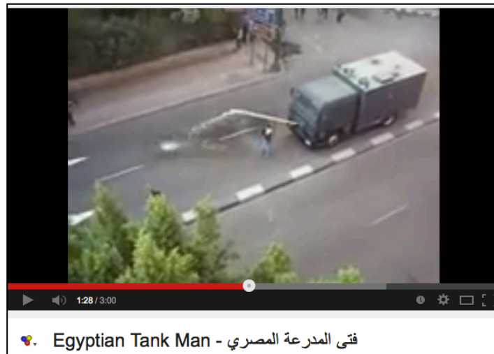
FIG 3 Capture d'écran de la vidéo sur Youtube de l'homme face au canon à eau. Égypte, 2011.

le cas de l'homme de l'avenue Bourguiba) et aucune image fixe n'a scellé son destin. Il est un anonyme parmi d'autres dont le courage, s'il n'est pas « iconique », a pu être symbolique.