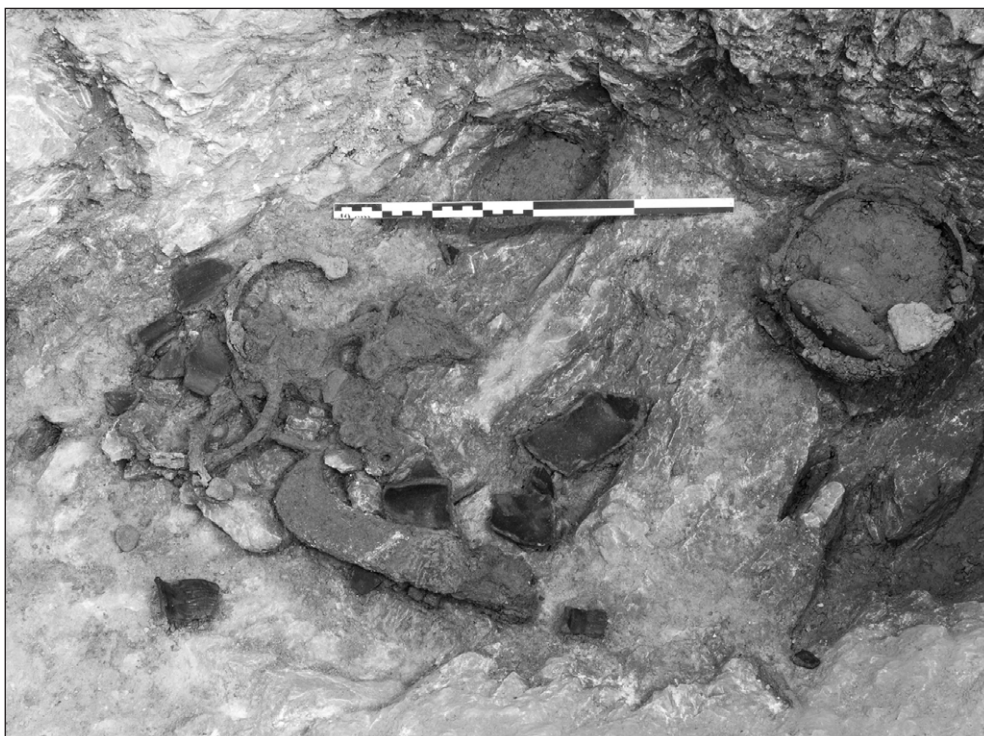
Fig. 3. Le Mormont (VD, Suisse). Fosse 559. Dépôt composé d'une entrave, d'une serpe et d'un récipient en bois à cerclage en fer et de céramique.