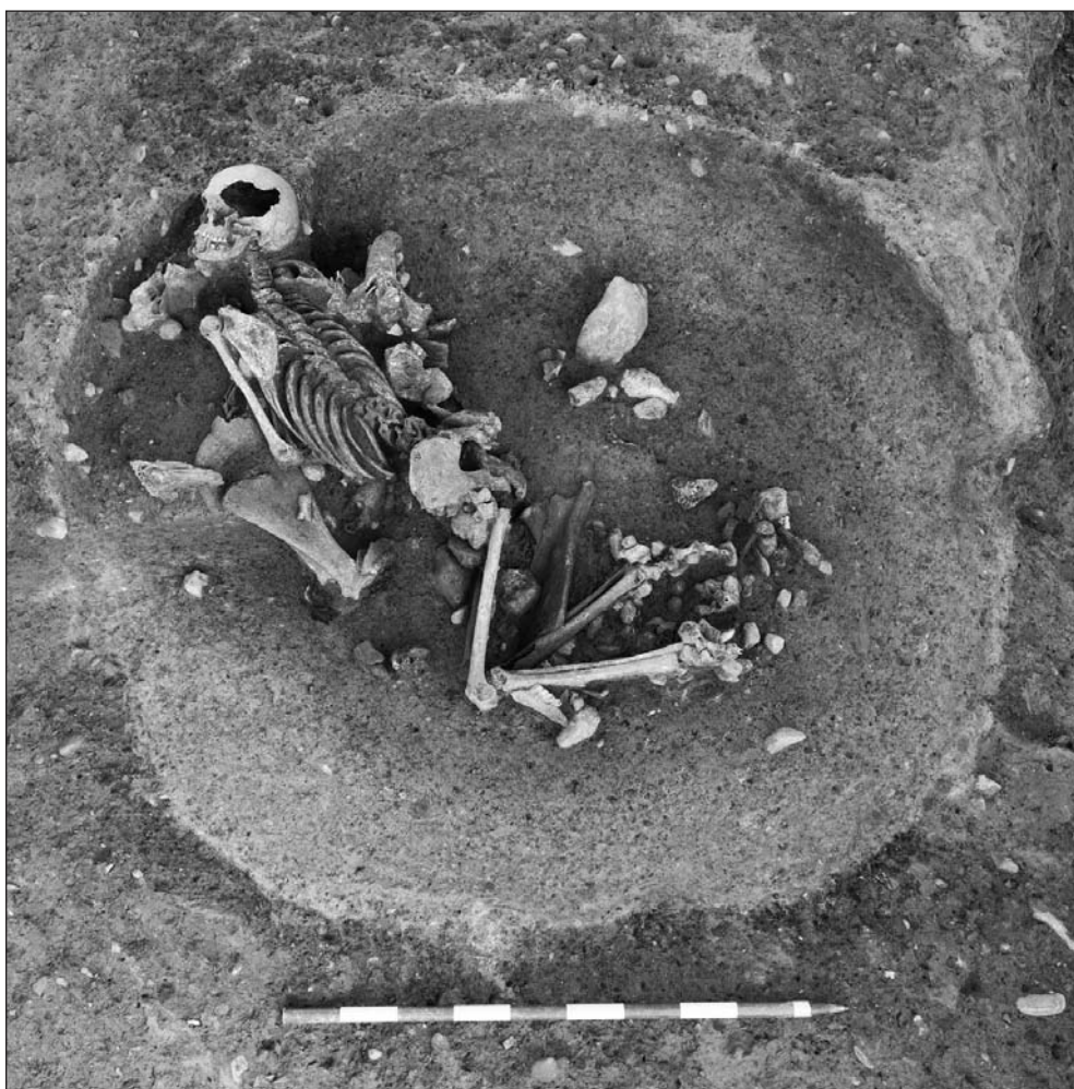
Fig. 4. Le Mormont (VD, Suisse). Fosse 481. Dépôt du squelette d'une femme adulte accompagné des scapula, de chevilles osseuses et de fragments de crâne de bovins.