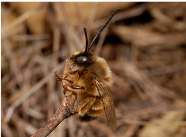
Figure 3. Mâle d' Eucera nigrilabris LEPELETIER (Hymenoptera, Apidae) à l'émergence, 4.III.2007, Narbonne (F)

Au cours de la première quinzaine du mois de mars 2007, nous avons réalisé des prospections dans la région de Perpignan-Narbonne (Aude, France). Nos recherches se sont particulièrement orientées sur différents sites comme le camp militaire de Rivesaltes (42.7944°N, 2.86719°E, WGS84) ou encore l'aire de Narbonne-Jonquières de l'autoroute A61 (43.1545°N, 2.95499°E, WGS84) où nous avons capturé plusieurs spécimens de chaque sexe de N. agrestis , une abeille cleptoparasite de grande taille (12,5-14,5mm). A l'époque de nos observations, la faune d'abeilles sauvages était relativement peu diversifiée sur les sites d'étude. Nos recensements ont tout de même permis d'inventorier les espèces suivantes sur le site du camp militaire de Rivesaltes : Andrena (Melandrena) nigroaenea (KIRBY) (Andrenidae), Anthidium (Rhodanthidium) sticticum FABRICIUS (Megachilidae), Anthophora (Anthophora) plumipes (PALLAS) (Apidae), Eucera (Pareucera) caspica MORAWITZ, E. (Heterucera) elongatula VACHAL et E. (Eucera) nigrilabris LEPELETIER (Apidae) (Figure 3).