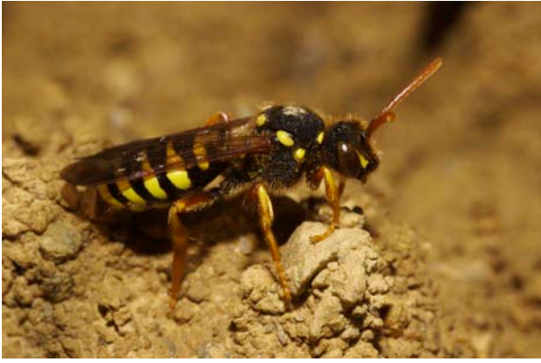
Figure 1. Femelle de Nomada goodeniana (KIRBY) (Hymenoptera, Apidae), 8.III.2007, Cadillon (F)