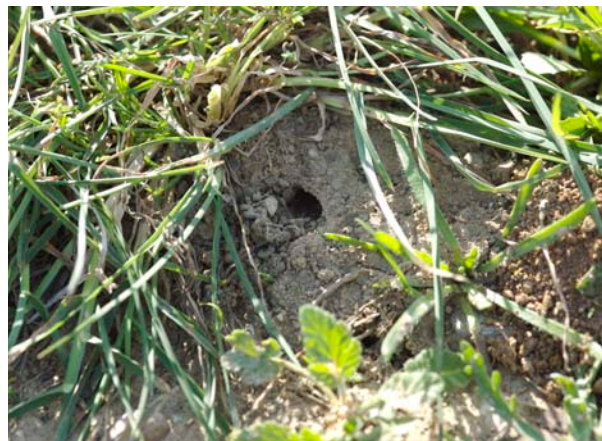
Figure 4. Entrée du nid souterrain d' Eucera nigrilabris LEPELETIER (Hymenoptera, Apidae), 16.III.2007, Narbonne (F)