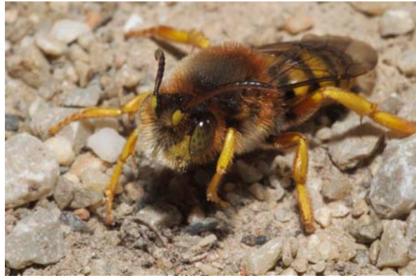
Figure 2. Mâle de Nomada agrestis FABRICIUS (Hymenoptera, Apidae), 11.III.2007, Narbonne (F)