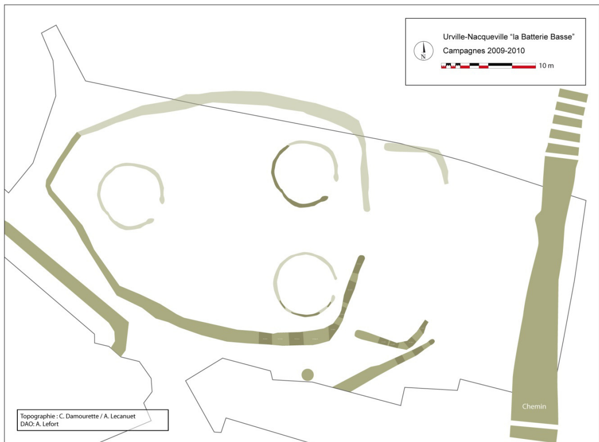
Figure 1 Emprise de la fouille 2010 et relevé des structures (en haut). Restitution hypothétique (en bas).