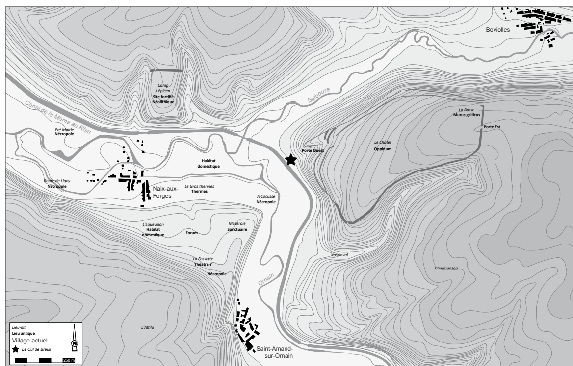
Figure 1 : Plan général de l'oppidum et de l'agglomération antique de Nasium