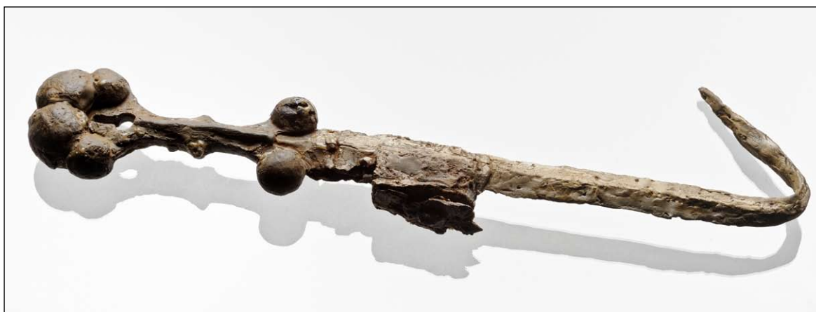
Fig. 1 : Épée à sphères de Mailhac.

Les épées à sphères, parfois nommées à rognons ou à bulbes, font l'objet depuis maintenant près d'un siècle d'un important débat chronologique. Celui-ci tient tout autant à la spécificité de leurs contextes de découverte qu'à leur morphologie très particulière (fig. 1). Les différentes datations qui ont été proposées jusqu'à présent s'échelonnent sur une fourchette de plusieurs siècles, entre le Hallstatt final et le terme de l'âge du Fer. Ces propositions se sont appuyées tantôt sur les très rares assemblages de mobilier, réels ou supposés, apparus au gré des découvertes, tantôt sur des aspects purement technologiques.