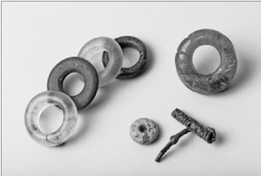
Fig. 3. Vufflens-la-Ville (VD). Le mobilier de la sépulture féminine St. 388. Diamètre de la petite perle en ambre : 14 mm.

attaché sur l'arc et des bracelets côtelés à couverture interne jaune caractéristiques d'une phase évoluée de LTC2. Le haut de la séquence peut quant à lui être attribué à LTD1b classique, avec des marqueurs comme la fibule de Nauheim, de Lauterach ou encore l'association récurrente de potins à la grosse tête et de quinaires à la légende Kaletedu. Le début du 1 er siècle de notre ère semble peu représenté, comme en témoignent la rareté des fibules filiformes à corde interne ou d'autres marqueurs de LTD1b récente et de LTD2a. Quelques éléments plus anciens, découverts hors contexte, sont également attestés. Un bracelet en verre bleu à décor bourgeonnant et de rares fibules de schéma La Tène moyenne à long pied orné d'une perle massive évoquent un contact avec LTC1, tandis qu'une agrafe de ceinture à décor géométrique incisé et une fibule à double timbale renvoient respectivement au Hallstatt C et D3.