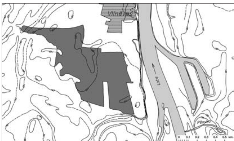
Fig. 1 - Plan de localisation du site de Vlíněves

Le site de Vlíněves se trouve en Bohême centrale, dans le district de Mělník, sur la rive gauche de l'Elbe à moins de 3 km en aval de sa confluence avec la Vltava (Figure 1).